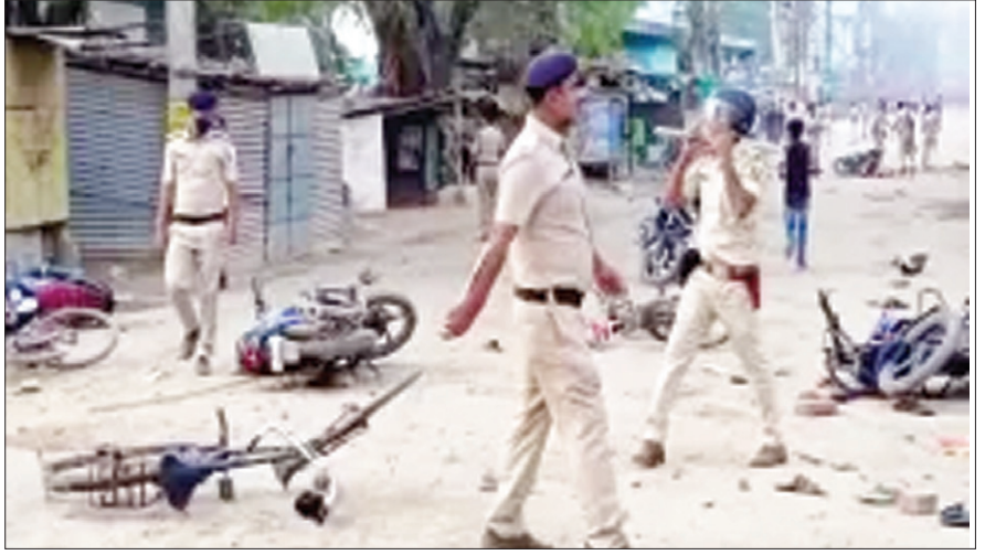
बवाल के बाद गोर्चा संभालते पुलिस के जवान

● नालंदा, सासाराम और गया से अब तक 61 गिरफ्तार, सासाराम में पांच आईपीएस अधिकारियों की तैनाती