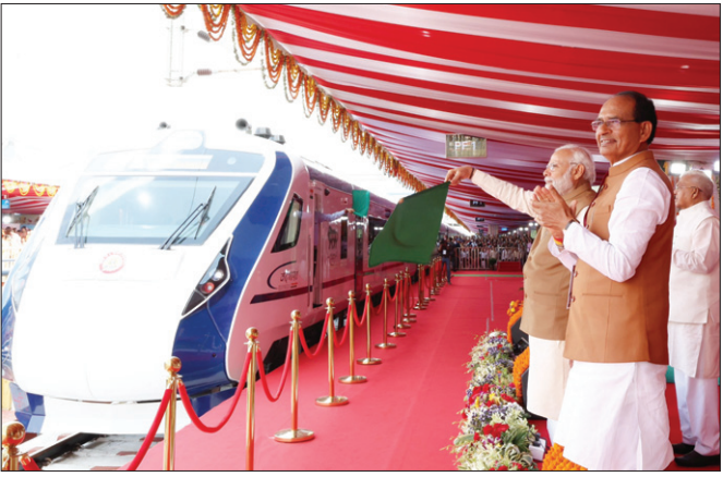
नलापति स्टेशन में वंदे भारत ट्रेन को हरी झंडी दिखाते पीएम नरेंद्र मोदी

प्रधानमंत्री नरेंद्र मोदी ने शनिवार को कहा कि वंदे भारत ट्रेन नए भारत की उमंग और तरंग का प्रतीक है। यह भारत की आधुनिकतम ट्रेन है, जिसके लोकार्पण का उन्हें सौभाग्य मिला है। रेलवे के इतिहास में यह पहली बार हुआ है कि कोई प्रधानमंत्री इतने कम अंतराल में किसी रेलवे स्टेशन पर देबाबा किसी कार्यक्रम में आया है। पहले रानी कमलापति स्टेशन के लोकार्पण में आया था और आज वंदे भारत ट्रेन को हरी झंडी दिखाते आया है। प्रधानमंत्री शनिवार को भोपाल के रानी कमलापति स्टेशन पर वंदे भारत एक्सप्रेस को हरी झंडी दिखाकर रवाना करने के बाद सभा को संबोधित कर रहे थे। इस मौके पर राज्यपाल मंगूभाई पटेल,