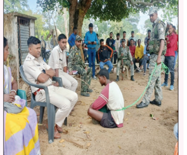
गिरफ्तार आरोपी से पूछताछ करती पुलिस।