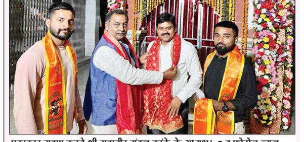
पुरस्कार ग्रहण करते श्री महावीर मंडल कांके के अध्यक्ष।

श्री महावीर मंडल कांके की झांकी हुई पुरस्कृत