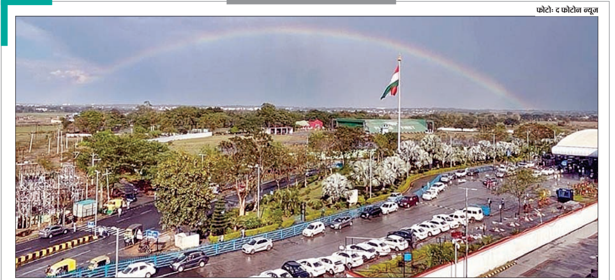
झारखंड का मौसम लगातार करवट ले रहा है। बीते कुछ दिन से राज्य के कई हिस्सों में बारिश हो रही है। इसी बीच इंद्रधनुष के इस खूबसूरत नजारे ने सभी को आकर्षित कर लिया। रांची में शनिवार को दोपहर में हल्की आंधी के बाद बारिश शुरू हुई। शाम को बारिश रुकने के बाद यह मनोरम दृश्य देखने को मिला। इंद्रधनुष को देख सबको कौतूहल हुआ। कई लोगों ने इस नजारे को अपने मोबाइल के कैमरे में कैद कर लिया। रांची में इंद्रधनुष का यह नजारा वाकई बेहद खूबसूरत दिख रहा था।

माओवादियों की सक्रियता के लिहाज से अति माओवाद प्रभाव श्रेणी में हैं जबकि 16 जिलों में माओवादियों का प्रभाव है। देश के अति माओवाद प्रभाव वाले 25 में आठ जिले झारखंड के हैं। झारखंड में माओवाद प्रभाव वाले 16 जिलों में रांची, खुंटी, बोकारो, चतरा, धनबाद, पूर्वी सिंहभूम, गढ़वा, गिरिडीह, गुमला, हजारीबाग, लातेहार, लोहरदगा, पलामू, सिमडेगा, सरायकेला-खरसावा, पश्चिमी सिंहभूम शामिल हैं। वहीं आठ अति माओवाद प्रभावित जिलों में चतरा, गिरिडीह, गुमला, खुंटी, लोहरदगा, लातेहार, सरायकेला-खरसावा, पश्चिमी सिंहभूम हैं।