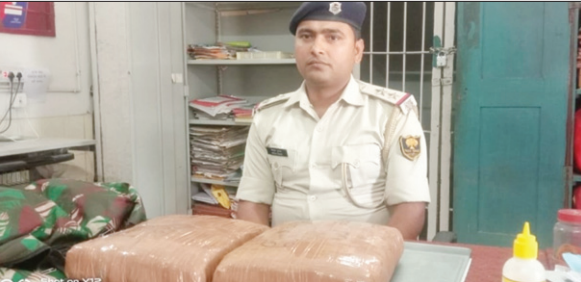
पकड़े गये गांजे के साथ रेलवे पुलिस।