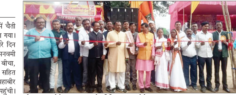
फीता काटकर मेले का उद्घाटन करते अतिथिगण।

इस दौरान लेम जय श्रीराम जय हनुमान के भक्ति जयकारों से गुंजाता रहा। इससे पूर्व