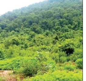
आधारभूत संरचना और सेवाओं से संबंधित क्रिटिकल गैस को भरा जायेगा। इसके लिए भारत सरकार के गृह मंत्रालय ने देश के अति उपग्रवाद प्रभावित जिलों में विशेष केंद्रीय सहायता देने की योजना बनायी थी, जिसमें छह जिले झारखंड के हैं। झारखंड के आठ जिले

राज्य के छह नक्सल प्रभावित जिलों गिरिडीह, गुमला, खुंटी, सरायकेला, चतरा और चाईबासा को वित्त वर्ष 2022-23 के लिए 51.73 करोड़ रुपये मिले हैं। यह राशि केंद्र प्रायोजित पुलिस आधुनिकीकरण योजना अंतर्गत विशेष केंद्रीय सहायता योजना के तहत दी गयी है। गिरिडीह को 10.25 करोड़, गुमला को 10.25 करोड़, खुंटी को 9.89 करोड़, सरायकेला को 10.25 करोड़, चाईबासा को 10.25 करोड़ और चतरा 84 लाख रुपये मिले हैं। इस राशि से राज्य के छह जिलों में सार्वजनिक