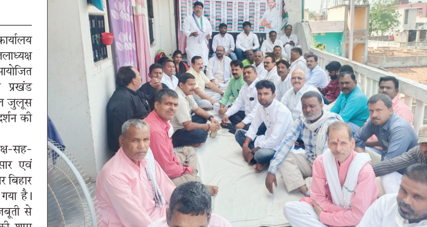
घरने पर बैठे लोजपा (रामविलास) कार्यकर्ता।