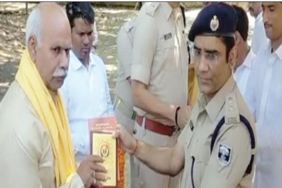
सेवानिवृत्त पुलिसकर्मी को सम्मानित करते एसएसपी।