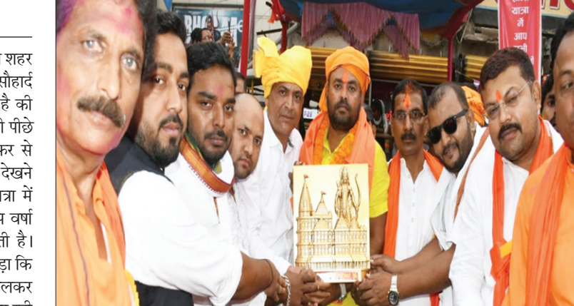
शोभायात्रा के आयोजकों को सम्मानित करते मुस्लिम समुदाय के लोग।

पूर्णिमा हिंदू मुस्लिम एकता के प्रतीक का शहर माना जाता है। पूर्णिमा में सामाजिक सौहार्द तथा आपसी ताना-बाना इतना मजबूत है की एक दूसरे के सम्मान करने में कोई कभी पीछे नहीं हटते। इसी कड़ी में पूर्णिमा में फिर से नया अंदाज मुस्लिम समुदाय की ओर से देखने को मिला। ऐसे तो रामनवमी शोभा यात्रा में मुस्लिम समुदाय द्वारा शरबत, ठंडई,पुष्प वर्षा इत्यादि की व्यवस्था हर बार की जाती है। परंतु इस बार और एक नया अध्याय जुड़ा कि मुस्लिम समुदाय के कई सारे युवकों ने मिलकर जब रामनवमी शोभा यात्रा सड़क से गुजर रही थी उन्हें रोककर दर्जनों मुस्लिम युवकों ने मिलकर सम्मानित किया। श्रीराम शोभायात्रा के संयोजकों में बंटी