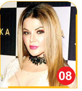
राखी ने प्रियंका से लिया पंगा