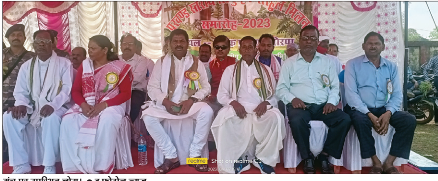
गंध पर उपस्थित लोग।

कलश यात्रा पंचवहनी मंदिर प्रांगण से निकलकर विभिन्न क्षेत्रों का भ्रमण करते हुए लवणा डैम पहुंचा। यहां पुरोहित द्वारा पूरे विधि-विधान एवं वैदिक मंत्रोच्चारण के बीच कलशों में जल भरवाया गया। इसके बाद पुनः कलश यात्रा यज्ञस्थल पर पहुंची। जहां कलशों