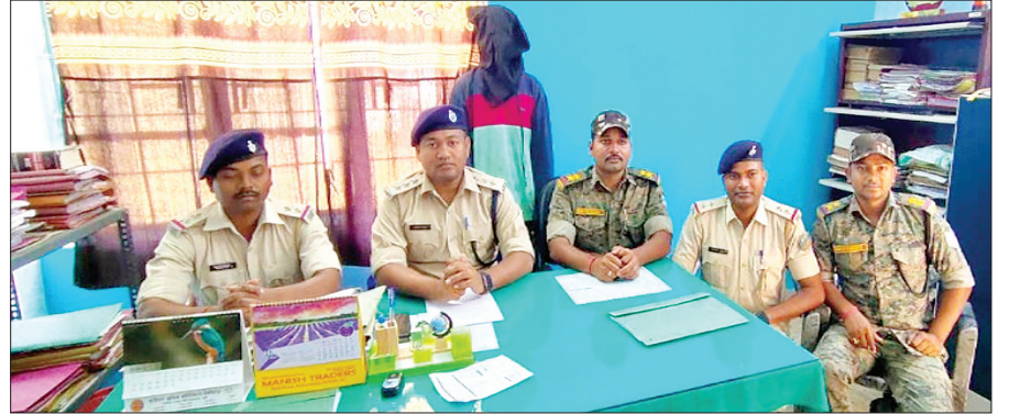
गिरफ्तार आरोपी के साथ पुलिसकर्मी • फोटोन न्यूज