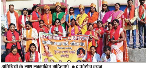
अतिथियों के साथ सम्मानित महिलाएं।

भारतीय जनता पार्टी महिला मोर्चा जिला रामगढ़ के तत्वावधान में रविवार को भुरकुंडा पंचवत सचिवालय में सुषमा स्वराज अवार्ड समारोह का आयोजन हुआ। कार्यक्रम का शुभारंभ भाजपाईयों ने पंडित दीनदयाल उपाध्याय एवं डॉ. श्यामा प्रसाद मुखर्जी के तस्वीर पर पुष्प अर्पित एवं दीप प्रज्वलित कर किया। कार्यक्रम में महिला सशक्तिकरण जागरूकता के तहत आत्मनिर्भरता के साथ समाज में बेहतर कार्य कर रही