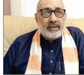
गिरिराज सिंह।

केन्द्रीय ग्रामीण विकास और पंचायती राज मंत्री गिरिराज सिंह ने कहा है कि नीतीश कुमार बिहार को दूसरा बंगाल बनाना चाहते हैं। ममता बनर्जी से प्रतिस्पर्धा कर रहे हैं। ममता बनर्जी के गजवा-ए-हिंद के रास्ते पर चल रहे हैं। बिहार की स्थिति दुर्भाग्यपूर्ण हो गई है। इसका जवाब नीतीश कुमार को देना होगा। नालंदा एवं सासाराम में रामनवमी जुलूस के दौरान बड़की हिंसा को लेकर रविवार को जारी वीडियो में गिरिराज सिंह ने कहा है कि क्या नीतीश कुमार को पता नहीं था कि हर साल की तरह रामनवमी जुलूस निकलने वाला है। बिहार सरकार का आईबी, इंटीलिजेंस और सिस्टम क्या कर रहा था। जुलूस के मुस्लिम मोहल्ले में जाने