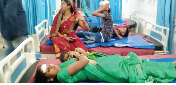
अस्पताल में मर्ती घायल।