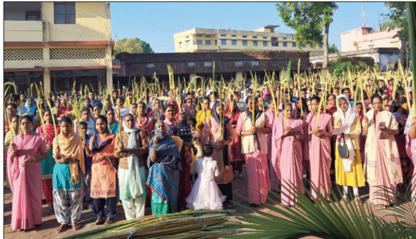
शोभायात्रा में शामिल मसीही सदुदाय के लोग।