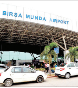
वाले दिनों में देश का नंबर वन एयरपोर्ट बनाने की प्रेरणा मिलेगी। उन्होंने बताया कि इस सर्वे में एयरपोर्ट पर मिलने वाली जनसुविधा और उसके कार्यप्रणाली का ध्यानपूर्वक जांच के बाद ग्रैंडिंग की जाती है। इसमें 50 से अधिक मानक तय किये गये थे। जैसे एयरपोर्ट स्टाफ के व्यवहार, सफाई, शॉपिंग की सुविधा, पार्किंग की सुविधा, रेस्टोरेंट में पैसे के एक्जेंशन में मिलने वाली सुविधाएं और ग्राउंड पर मिलनेवाली स्टाफ की सुविधाएं शामिल हैं।