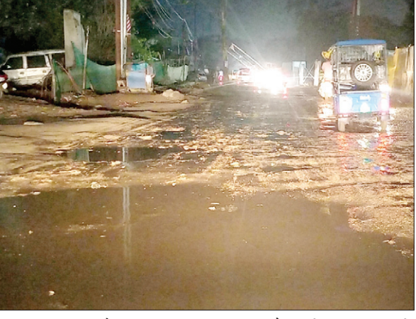
बाइक सवार इस दौरान फिसलकर गिरे। उन्हें चोट भी आई। मालूम हो प्लाईओवर निर्माण के कारण बहुबाजार से कांटाटोली की ओर जाने वाले रास्ते को एक लेन कर दिया गया है। इससे रास्ता संकरा हो गया है। कांटाटोली चौक से बहुबाजार तक सर्विस लेन में सैकड़ों छोटे-बड़े गड्ढे भरे पड़े हैं। जुड़को ने सर्विस लेन को

पूरी सड़क पर कीचड़ और फिसलन के चलते दर्जनों बाइक सवार गिर गए। वाहन सवारों की सर्विस लेन से गुजरने में काफी मुश्किलों का सामना करना पड़ा। शाम छह बजे से आठ बजे से तक लंबा जाम लगा रहा। सैकड़ों गाड़ियां फंसी रही। बहुबाजार से कांटाटोली चौक तक सड़क के गड्ढों में वर्षा का पानी भर गया था। दर्जनों