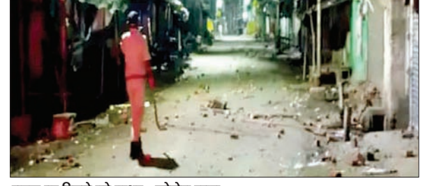
सड़क पर बिखरे पड़े पत्थर • फोटोन न्यूज