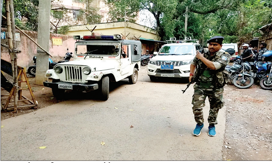
मंडल कारा के बाहर पुलिस वाहन व जवान