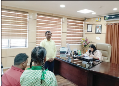
जनता की समस्या सुनती उपायुक्त। ● द फोटोन न्यूज

सोमवार को उपायुक्त रामगढ़ सुश्री माधवी मिश्रा ने अपने कार्यालय कक्ष में जिले के सुदूरवर्ती क्षेत्रों से अपनी समस्याओं को लेकर उनसे मिलने आए लोगों से मुलाकात की। इस दौरान लोगों ने भूमि विवाद, आवास, नामांकन, विभिन्न योजनाओं के लाभ सहित अपनी विभिन्न समस्याओं से उपायुक्त को अवगत कराया जिसके उपरान्त उपायुक्त ने मामलों के निष्पादन हेतु संबंधित अधिकारियों को आवश्यक कार्रवाई करने का निर्देश दिया।