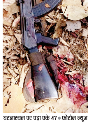
घटनास्थल पर पड़ा एके 47