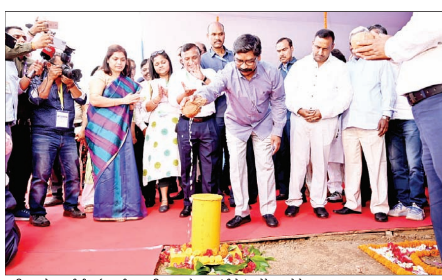
गारियल फोडकर टीसीआईएल की आधारशिला रखते मुख्यमंत्री हेमंत सोरेन

मुख्यमंत्री हेमंत सोरेन ने सोमवार को जमशेदपुर में टीसीआईएल के विस्तार परियोजना की भूमि पूजन कर आधारशिला रखी। टाटा समूह के लोग भी उद्योग नीति की लॉन्चिंग के दौरान उपस्थित थे। कार्यक्रम में बतौर मुख्य अतिथि मुख्यमंत्री ने कहा कि जिस प्रकार आज दि टिनप्लेट कंपनी ऑफ इंडिया लिमिटेड (टीसीआईएल) के विस्तार परियोजना के लिये आधारशिला रखी गई है। मुझे आशा है कि यह कार्य समय से पूरा