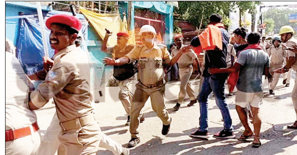
उग्र लोगों को काबू करते पुलिसकर्मी

साहिबगंज नगर थाना क्षेत्र के पटेल चौक के पास स्थित बजरंगबली की प्रतिमा को सोमवार को कुछ असाामाजिक तत्वों ने क्षतिग्रस्त कर दिया। इसके विरोध में स्थानीय लोगों ने एनएच-80 को तीन घंटे तक जाम कर दिया। शहर में जमकर पथराव किया। एक धार्मिक स्थल को भी आग के हवाले कर दिया। तनावपूर्ण स्थिति को देखते हुए भारी संख्या में सुरक्षा बलों को तैनात कर दिया गया है। उपायुक्त के निर्देश पर दिन में करीब सवा एक बजे से लेकर मंगलवार सुबह नौ बजे तक इंटरनेट सेवा बंद कर दी गयी है। तनाव को देखते हुए डीसी ने एहतियातन यह कदम उठाया है। उन्होंने जियो और