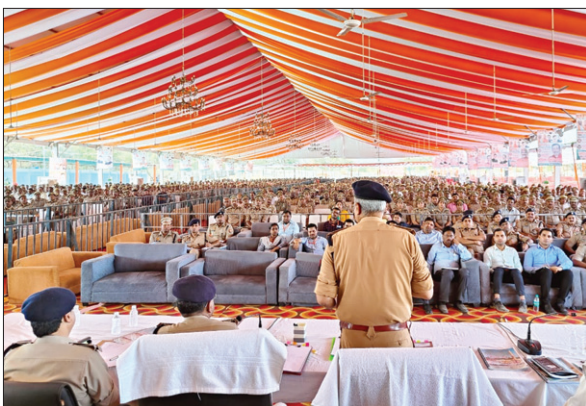
गृहमंत्री के आगमन की तैयारियों में जुटे अफसर। ● द फोटोन न्यूज़

कौशांबी महोत्सव में केन्द्रीय गृहमंत्री अमित शाह के आगमन की तैयारी अंतिम रूप में पहुंच गई है। महोत्सव स्थल तक आने वाले वाहनों को पांच किलोमीटर दूर रोक दिया जाएगा। मंच पर वीआईपी के बैठने की व्यवस्था मुख्य मंच से 60 फीट दूर की गई है। मंच पर जाने के लिए शासन स्तर से लोगों को पास जारी किए गए हैं। केवल वही लोग ही मंच पर पहुंच सकेंगे। पुलिस अधीक्षक समर बहादुर ने गुरुवार को बताया कि कार्यक्रम स्थल से लेकर बाहर तक पुलिस का सख्त पहरा एवं निगरानी व्यवस्था की गई है। सुरक्षा