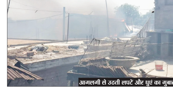
अगलगी से उड़ती लपटें और धुएं का गुबार