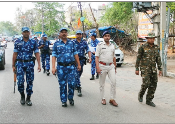
पलैग मार्च करते जवान।

जिसमें 11 अप्रैल तक रैपिड एक्शन फोर्स की बटालियन मौजूद रहेगी। इस फोर्स का रामगढ़ में आने का मकसद सिर्फ यही है कि जनता