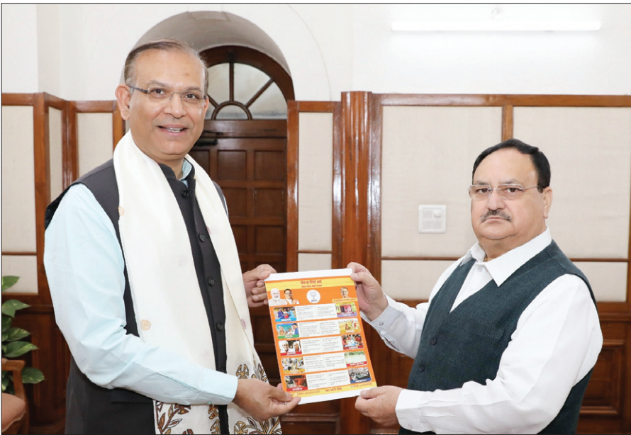
जेपी नड्डा को सेवा का रिपोर्ट कार्ड दिखाते सांसद जयंत सिन्हा।

श्री जयंत सिन्हा जी ने उनके समक्ष हजारीबाग लोकसभा में विशाल स्तर पर आयोजित की गयी सांसद खेल प्रतिस्पर्धा 'अमृत ट्रॉफी' की प्रति प्रस्तुत की। इस प्रतियोगिता ने खेल के क्षेत्र में इतिहास रचा। इसमें हजारीबाग लोकसभा की 300+ पंचायतों से लगभग 10 हजार खिलाड़ियों ने भाग लिया। इसके साथ ही उन्होंने