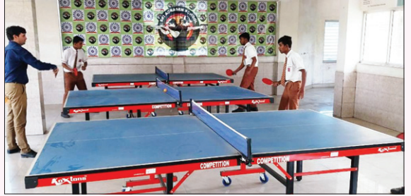
टेबल टेनिस में हिस्सा लेते बच्चों।