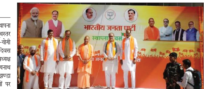
स्थापना दिवस समारोह में उपस्थित आदित्य नाथ योगी व अटल ।

सामान्य दिनों के कार्यक्रमों में लगने वाली बैनर होड़िंग से तो अटल-आडवाणी गायब ही रहते हैं। स्थापना दिवस जैसे महत्वपूर्ण अवसर पर भाजपा के प्रदेश कार्यालय के समारोह स्थल पर लगी होड़िंग से अटल आडवाणी पूरी तरह नगदर थे। उस होड़िंग में एक तरफ पार्टी के