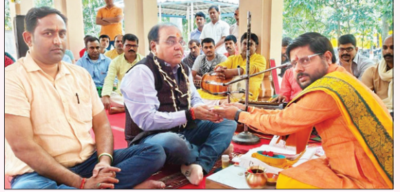
पूजा-अर्चना व अखंड-पाठ में शामिल प्लांट हेड व श्रद्धालु मत्कमणा। ● द फोटोन न्यूज

जेएसपी हनुमान मंदिर प्रांगण में भक्तिभाव से मनी भगवान हनुमान की जयंती