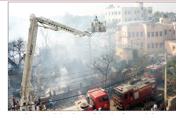
पटना में आग बुझाने में लगी फायर ब्रिगेड की गाड़ियां

पटना में आगलगी के दौरान 12 गैस सिलेंडरों की सीरियल ब्लास्ट से पूरा इलाका दहल उठा। आसपास के लोग सहम उठे। इस भीषण अगलगी की घटना में लोगों के लाखों रुपये केश, जेवर और कीमती सामान जलकर राख हो गये। बर्तन से लेकर पेटों में रखे नकद भी नहीं बच सका। पीड़ितों ने बताया कि घर का पूरा सामान जल गया है। कुछ भी नहीं बचा। साढ़े पांच घंटे की कड़ी मशकत के बाद जब आग पर काबू पाया गया। इसके बाद पीड़ित अपने-अपने जले सामान को देखने के लिए पहुंचे और रोने लगे। इस दौरान पीड़ित लोग पुलिस से भी भीड़ गये। दरअसल, पुलिस पीड़ितों को अंदर जाने से रोक रही थी। इसी को लेकर पीड़ित लोग आक्रोशित हो