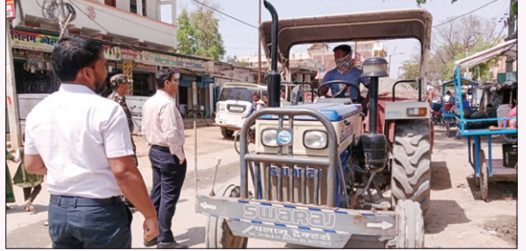
जब ट्रैक्टर। ● द फोटोन न्यूज

मेदिनीनगर में पत्थर डस्ट लदे दो ट्रैक्टरों को पकड़ा