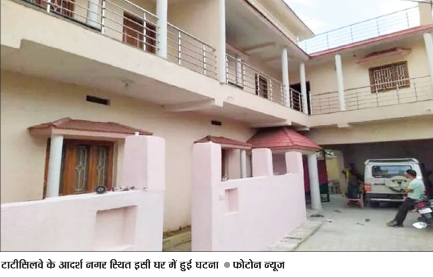
टाटीसिलवे के आदर्श नगर स्थित इसी घर में हुई घटना

● सीसीटीवी फूटेज खंगाल रही पुलिस, कई युवकों को हिरासत में लिया