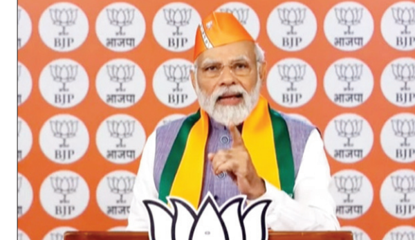
कार्यक्रम को संबोधित करते पीएम नरेंद्र मोदी

प्रधानमंत्री नरेंद्र मोदी ने भगवान हनुमान के जीवन को भारत की विकास यात्रा के लिए प्रेरणा बताया और कहा कि भारतीय जनता पार्टी (भाजपा) को भ्रष्टाचार से लड़ने की प्रेरणा भगवान हनुमान से मिलती है। प्रधानमंत्री मोदी ने गुरुवार को भाजपा के 44वें स्थापना दिवस पर पार्टी कार्यकर्ताओं को संबोधित करते हुए कहा कि भाजपा भ्रष्टाचार और वंशवाद से लड़ने के लिए प्रतिबद्ध है। भाजपा ने लोकतंत्र की कोख से जन्म लिया है। भाजपा के लिए देश सबसे ऊपर है। पार्टी भारत को भ्रष्टाचार, भाई-भतीजावाद, कानून और व्यवस्था की चुनौतियों से मुक्त करने के लिए प्रतिबद्ध है। उन्होंने कहा कि पहले