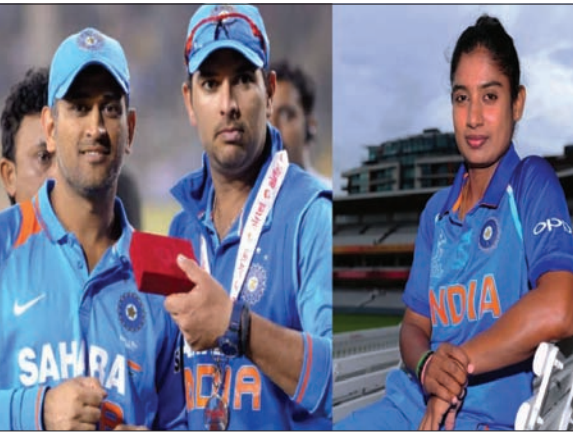
लॉर्ड्स में इंग्लैंड के साथ महिला एकदिवसीय अंतरराष्ट्रीय के बाद 7,805 रन बनाकर महिला क्रिकेट में सबसे ज्यादा रन बनाये हैं। इसमें कहां

एमसीसी ने कहा, पांच भारतीय खिलाड़ियों को मानद आजीवन सदस्यता से सम्मानित किया गया है। इसमें शामिल झुलन ने पिछले साल