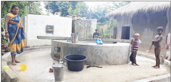
अदाणी फाउंडेशन द्वारा बनाया गया कुआँ।

अदाणी फाउंडेशन की मदद से डुमरिया, मोतिया, पटवा, बक्सरा, पेडरिया, रंगिदा, बलियाकित्ता, बिरनिया, आदि गांवों के अन्ना महागामा प्रखंड के दो दर्जन गांवों में सड़क किनारे कुएं और नलकूपों के