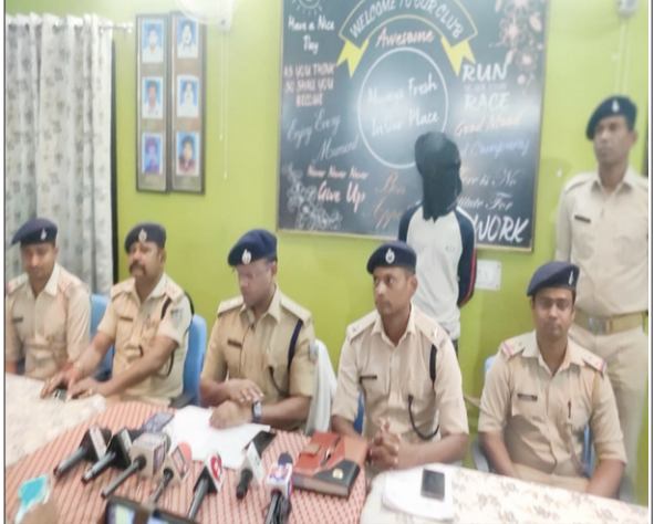
गिरफ्तार अपराधी व पैसे को जानकारी देती पुलिस।

दिल्ली के करोलबाग में रहने वाले एक स्वर्ण व्यापारी के अपार्टमेंट से करोड़ों रुपये की चोरी कर राउरकेला जा रहे एक शक्तिर को पुलिस ने बुधवार देर रात एक निजी बस से गिरफ्तार कर लिया जबकि उसके दो साथी भाग निकलने में कामयाब रहे। आज करीब सात घंटे तक बैगों व ट्रॉली बैग से मिली राशि की गिनती बैंक कर्मियों द्वारा की गई, जिसमें कुल 6 करोड़ 53 लाख 97 हजार 730 रुपये थे। राशि को जब्त कर लिया गया। गिरफ्तार आरोपित को गुमला जेल भेज दिया गया है।