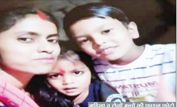
महिला व दोनों बच्चों की फाइल फोटो