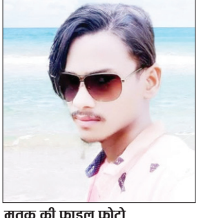
मृतक की फाइल फोटो

● मृतक अपने कुछ दोस्तों के साथ एक किराना दुकान में चोरी करने के लिए घुसा था