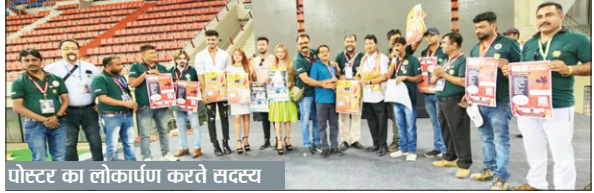
पोस्टर का लोकार्पण करते सदस्य