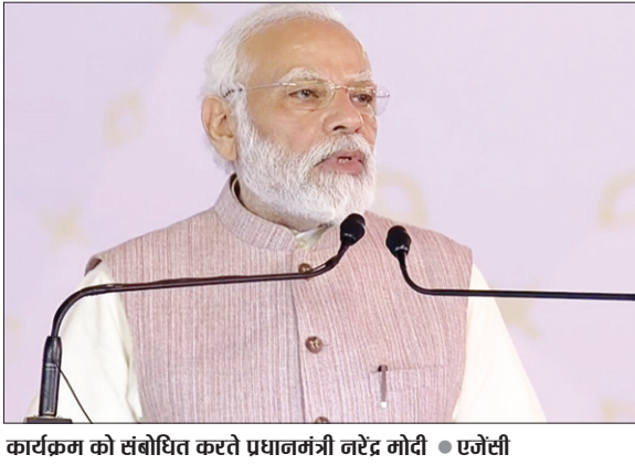
कार्यक्रम को संबोधित करते प्रधानमंत्री नरेंद्र मोदी

प्रधानमंत्री नरेंद्र मोदी ने शनिवार को कहा कि भारत डिजिटल लेनदेन के मामले में दुनिया में प्रथम स्थान पर है। उन्होंने कहा कि हमारे पास सबसे सस्ता मोबाइल डेटा है। प्रधानमंत्री मोदी शनिवार को चेन्नई में 5,200 करोड़ रुपये से अधिक की हवाई अड्डे, राजमार्ग और रेलवे परियोजनाओं का उद्घाटन करने के बाद जनसभा को संबोधित कर रहे थे। उन्होंने कहा कि आज, भारत में शहरी उपयोगकर्ताओं की तुलना में ग्रामीण इंटरनेट उपयोगकर्ता अधिक हैं। लगभग 02 लाख ग्राम पंचायतों को जोड़ने के लिए 06 लाख किलोमीटर से अधिक ऑप्टिक फाइबर बिछाया गया है। प्रधानमंत्री मोदी ने कहा कि यह नई आशाओं, नई आकांक्षाओं और नई शुरुआत का समय है। नई पीढ़ी के कुछ इंफ्रास्ट्रक्चर प्रोजेक्ट आज से लोगों की सेवा करने लोंगे। पिछले कुछ वर्षों में, भारत बुनियादी