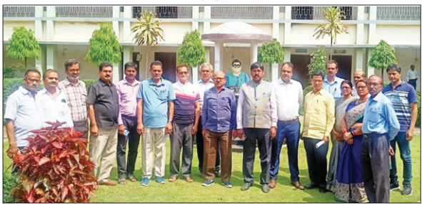
निरीक्षण के दौरान यूनिवर्सिटी की टीम व कॉलेज परिवार।

पटेलनगर भुरकुंडा जेएम कॉलेज भुरकुंडा में झारखण्ड स्टेट ओपन यूनिवर्सिटी रॉंची की टीम ने अध्ययन केन्द्र खोलने हेतु कॉलेज की विधि-व्यवस्था का शनिवार को भौतिक निरीक्षण किया। इस दौरान निरीक्षण में आए यूनिवर्सिटी के पदाधिकारियों ने सभी संसाधनों का बारीकी से अध्ययन किया। साथ ही मौजूद संसाधनों के प्रति संतुष्टि