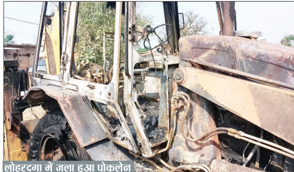
लोहरदगा में जला हुआ पोकलेन