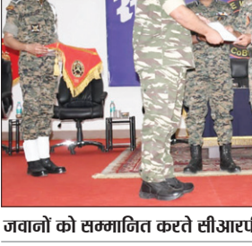
जवानों को सम्मानित करते सीआरपीएफ महानिदेशक