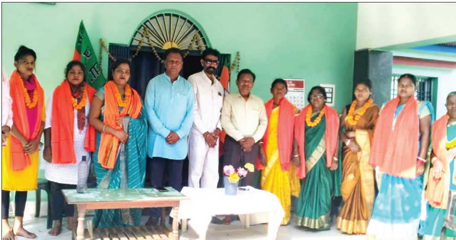
समाजहित में कार्य करने वाली महिलाओं को सम्मानित करते भाजपाई।