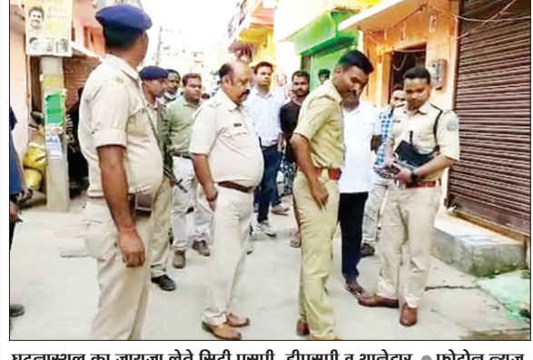
घटनास्थल का जायजा लेते सिटी एसपी, डीएसपी व थानेदार