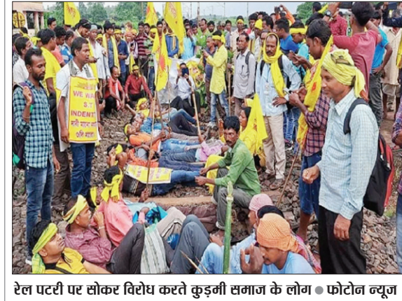
रेल पटरी पर सोकर विरोध करते कुड़ुमी समाज के लोग

पश्चिम बंगाल के खेमाशुली में कुड़ुमी जनजाति को एसटी में शामिल करने और कुड़ुमी भाषा को संविधान की आठवीं सूची में शामिल करने की मांग को लेकर शनिवार को भी रेल चक्का और हाड़वे जाम किया। बंगाल, ओडिशा और झारखंड के हजारों कुड़ुमियों का जुटान हुआ। आंदोलनकारी पीछे हटने के मूड में नहीं थे। मनोरंजन और भोजन पानी के साथ आंदोलन चल रहा था। डीजे पर झूमर गीत बज रहा था और पारंपरिक हथियारों से लैस हजारां लोग नाच रहे थे। हर दिन शाम को हजारां लोगों का महाजुटान हो रहा है। पटरियों पर बैठे कुड़ुमी समाज के प्रदर्शनकारियों के कारण दक्षिण पूर्व रेलवे को अब तक 316 ट्रेनों रद्द करना पड़ा है। इतनी बड़ी संख्या में ट्रेनों के रद्द होने से दक्षिण पूर्व रेलवे को करोड़ों रुपये का नुकसान हुआ है। अकेले खड़गपुर