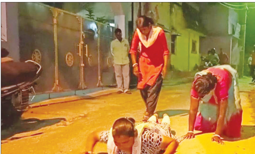
छात्रा सुगतती महिलाएँ।

तुणमूल कांग्रेस प्रमुख और पश्चिम बंगाल की मुख्यमंत्री ममता बनर्जी के राज में राजनीतिक प्रतिशोध का यह बर्बर वाक्या नैतिकता के गाल पर तमाचा है। भारतीय जनता पार्टी के शनिवार को जारी वीडियो में चार महिलाएं जमीन पर रंगती (घिसटती) दिख रही हैं। दावा किया गया है कि इनका कुसूर सिर्फ इतना है कि चारों ने हाल ही में भाजपा की सदस्यता ग्रहण की है। इन्हें सिर्फ इसलिए यह सजा दी गई।