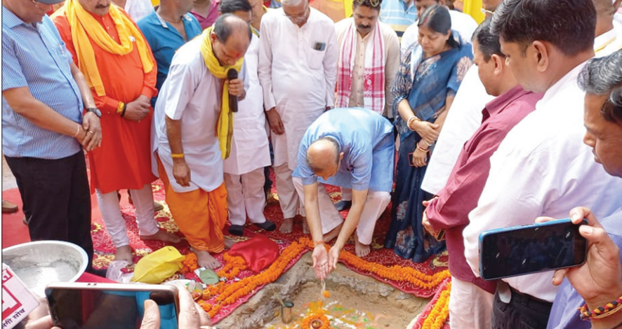
रामगढ़ बस स्टैंड के लिए गृहनिर्माण करते सांसद जयंत सिन्हा।

श्री जयंत सिन्हा ने आज रामगढ़ में प्रेसवार्ता को संबोधित किया। उन्होंने कहा कि हर झारखण्ड वासी जेएमएम-कांग्रेस सरकार से त्रस्त है। अगर हमें झारखण्ड को बचाना है तो इस निकम्मी सरकार को उखाड़ फेंकना होगा। मुझे रामगढ़ से इस प्रदर्शन की घोषणा करते हुए बेहद खुशी हो रही है, क्योंकि रामगढ़ ने ही विधानसभा उपचुनाव में एनडीए को प्रचंड जीत दिलवाकर देश में यह संदेश भेजा है कि अब झारखण्ड कि भ्रष्ट सरकार को