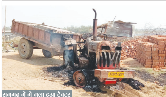
रामगढ़ में जला हुआ ट्रैक्टर

पाइप लाइन का काम चल रहा है। यह करीब आधा दर्जन नक्सलियों ने यह वारदात की। रामगढ़ जिले के गोला थाना क्षेत्र के पारसाडीह में बीएम कंपनी पुल बना रही है। यहां करीब एक दर्जन नक्सली पहुंचे और वाहन फूँक दिए।