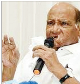
(एनसीपी) के राष्ट्रीय अध्यक्ष शरद पवार।

पवार ने आज मीडिया को दिये एक बयान में कहा कि जेपीसी की मांग हमारे सभी साधियों ने की है ये बात सच है। मगर हमें लगता है कि जेपीसी में 21 में से 15 सदस्य सत्ताधारी पार्टी के होंगे। ऐसे में देश के सामने सच्चाई कहाँ तक आ पाएगी। उन्होंने कहा कि मेरी पार्टी ने जेपीसी का समर्थन किया है लेकिन मुझे लगता है कि जेपीसी में सत्तारूढ़ पार्टी का वर्चस्व होगा