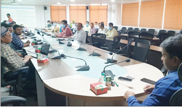
राष्ट्रीय कृमि मुक्ति दिवस पर आयोजित बैठक में उपायुक्त व अन्य। ● द फोटोन न्यूज

जिले में 20 अप्रैल को राष्ट्रीय कृमि मुक्ति दिवस के तहत विशेष अभियान चलाया जायेगा। अभियान के दौरान एक से 19 साल तक के बच्चों को कृमि नाशक एल्बेंडाजोल की गोली खिलाई जाएगी। यह गोली जिले में सभी सरकारी, निजी विद्यालयों एवं सभी आंगनवाड़ी केंद्रों पर खिलाई जाएगी।