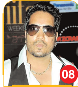
सिंगर मीका ने हाईकोर्ट से लगाई गुहार