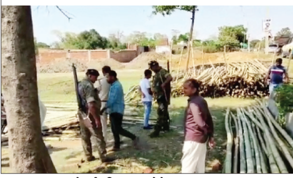
घटनास्थल पर जांच में जुटी पुलिस।