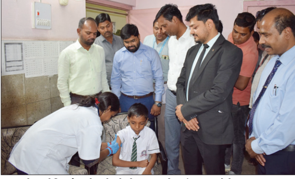
स्कूल में आयोजित कैंप में बच्चे को टीका लगाती गर्ल।