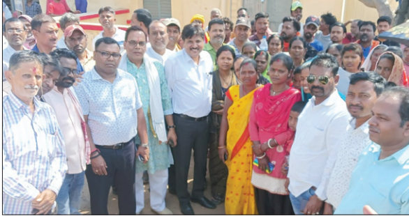
सयाल पीओ के साथ वार्ता में शामिल विस्थापित-प्रभावित ग्रामीण।

सयाल लोकल सेल को ले अब विस्थापित-प्रभावित ग्रामीण एकजुट हुए हैं। प्रबंधन से वार्ता के दौरान विस्थापितों ने एक मंच पर आकर सेल संचालन समिति का गठन करने की बात कही है। पूर्व घोषित कार्यक्रम के तहत बुधवार को सयाल परियोजना कार्यालय के समक्ष सौदा बस्ती, सरेया टोला व चारू टोंगरी के सैकड़ों विस्थापित-प्रभावित ग्रामीणों ने प्रबंधन के समक्ष लोकल सेल में अपनी शत प्रतिशत दावेदारी पेश कर प्रबंधन से अविनलंब लोकल सेल चालू करने की मांग की। विस्थापित-प्रभावितों की मांग पर प्रबंधन ने कहा कि लोकल सेल