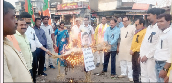
मुख्यमंत्री हेमंत सोरेन का पुतला दहन करते भाजपाई।

लाठी चार्ज के विरोध में भाजपाईयों ने मनाया काला दिवस, सीएम हेमंत सोरेन का फूका पुतला