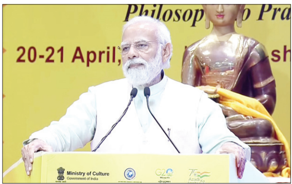
दो दिवसीय वैश्विक बौद्ध शिखर सम्मेलन को संबोधित करते पीएम

प्रधानमंत्री नरेंद्र मोदी ने गुरुवार को कहा कि बुद्ध का मार्ग भविष्य का मार्ग है। इस मार्ग पर चलने से संघर्ष के स्थान पर समन्वय और अशांति के स्थान पर शांति प्राप्त होती है। अगर दुनिया पहले से ही भगवान बुद्ध के मार्ग पर चलती तो जलवायु परिवर्तन जैसी समस्या का सामना नहीं करना पड़ता। प्रधानमंत्री नरेंद्र मोदी गुरुवार को दिल्ली स्थित अशोक होटल में प्रथम दो दिवसीय वैश्विक बौद्ध शिखर सम्मेलन के उद्घाटन सत्र में अपने विचार साझा कर रहे थे। इस दौरान दुनिया भर से आए बौद्ध धर्मावलंबियों का स्वागत