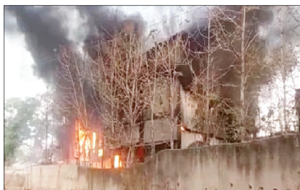
टैंक फैक्ट्री में लगी आग से निकलता धुएं का गुबार