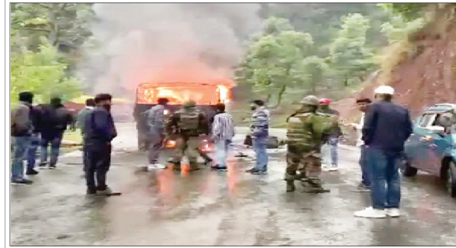
आतंकी हमले के बाद भारतीय सेना के ट्रक में लगी आग व आग बुझाने की कोशिश करते जवान

भारतीय सेना के अनुसार, अज्ञात आतंकवादियों ने गुरुवार की शाम को राजौरी सेक्टर में भीमबर गली और पुंछ के बीच हाइवे से गुजर रही सेना की गाड़ी पर ग्रेनेड से हमला कर दिया। आतंकियों ने बारिश और कम दृश्यता का फायदा उठाते हुए यह अटैक किया, जिसमें सेना के पांच जवानों की झुलसकर मौत हो गई वहीं एक जवान गंभीर रूप से जख्मी हो गया। आर्मी जवानों ने घायल को इलाज के लिए