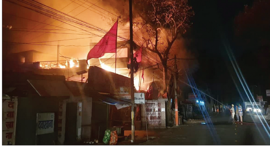
कोकर इंडस्ट्रियल एरिया स्थित विकास फर्नीचर दुकान में लगी आग को बुझाते लोग