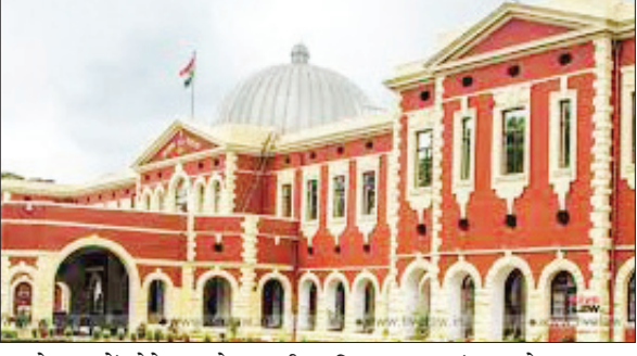
अपने पक्ष में होने पर मोरहाबादी के दुकानदारों ने इसे लेकर खुशी जताई। दुकानदारों ने रंग गुलाल लगाकर, एक दूसरे को मिठाई