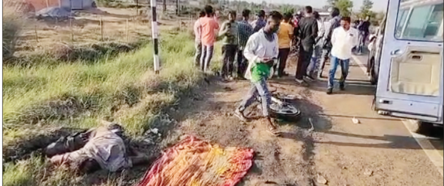
घटना स्थल पर मृत पड़ा युवक व गमगीणों की भीड़।

गंभीर रूप से घायल हो गए। जानकारी के अनुसार पहली घटना कोटार ओवर ब्रिज के निकट एक अज्ञात वाहन ने साइकिल सवार युवक को अपनी चपेट में ले लिया। इससे उसकी मौत घटनास्थल पर ही हो गई। घटना की सूचना पाकर पहुंची