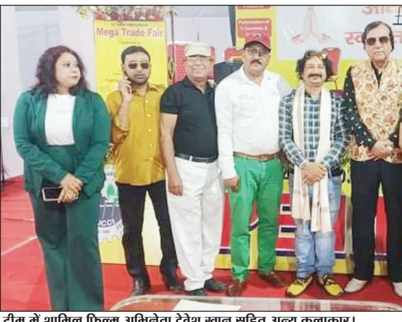
टीम में शामिल फिल्म अभिनेता देवेश खान सहित अन्य कलाकार। मेगा ट्रेड फेयर में बॉलीवुड एक्टर देवेश खान और जनार्दन झा का स्वागत किया गया। सभी ने बॉलीवुड एक्टरों के साथ फोटो खिंचवाई। देवेश खान ने कहा कि लोग मेले में आ रहे हैं। मेरी

PHOTON REPORTER RANCHI : राजधानी रांची के मोरहाबादी मैदान में चल रहे इंडिया इंटरनेशनल ट्रेड में लोगों की भीड़ लगातार बढ़ रही है लोग मेले में आकर लुत्फ उठा रहे हैं। मेरी आवाज मेरी पहचान की ओर से आने वाले मेले में सभी का मनोरंजन करा रही है। मेरी आवाज मेरी पहचान के सभी कलाकार आने वाले मेले में लोगों का भरपूर मनोरंजन करा रही है। मेले में आने वाले लोगों का कलाकारों के द्वारा गाया हुआ गीत खूब पसंद किया जा रहा है। मेले यवने वाले लोग यहां कभी बोर नहीं होते हैं। यहां मनोरंजन का साधन भी उपलब्ध है।