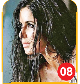
बड़े पर्दे पर जमेगी कार्तिक-कटरीना की...