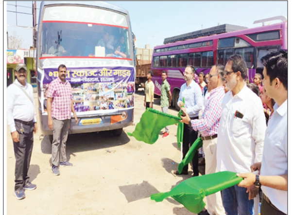
हरी झंडी दिखाकर छात्र दल को रवाना करते डीसी व अन्य।

PHOTON NEWS LOHARDAGA डीसी ने चार दिवसीय ट्रेकिंग में नेचर स्टडी कार्यक्रम के हिस्सा लेने के लिए विद्यार्थियों के दल को हरी झंडी दिखाकर नेतरहाट रवाना किया।