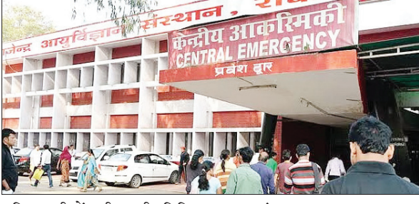
प्रसित मरीजों की सूची विहित प्रपत्र में भेजने का निर्देश दिया है। सभी जिला मुख्यालय से चिकित्सा पदाधिकारी की देखरेख में मरीजों को स्क्रीनिंग के लिए रिम्स लाया जाएगा एवं वापस जिला मुख्यालय तक पहुंचाया जाएगा।