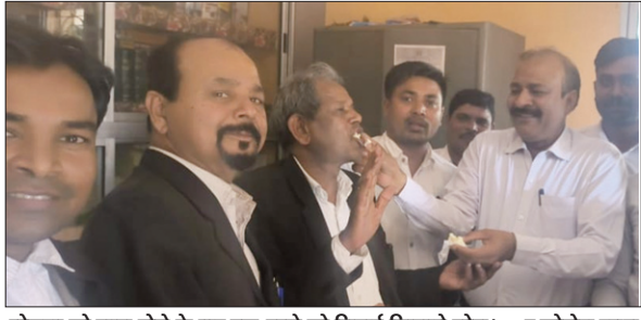
योजना को लागू होने के बाद एक-दूसरे को शिवाई खिलाते लोग।

उन्होंने बताया कि अधिवक्ताओं के बहुप्रतीक्षित मांग बहुत पहले आम सभा से पारित हो गई थी। अधिवक्ता कन्या विवाह योजना एवं अधिवक्ता सांत्वना योजना को सर्वसम्मति से लागू करने का निर्णय लिया गया। इस योजना के तहत सभी अधिवक्ताओं को उनकी पुत्री के शुभ विवाह में जिला अधिवक्ता संघ द्वारा कन्यादान के रूप में 21000 नगद दिया जाएगा। साथ