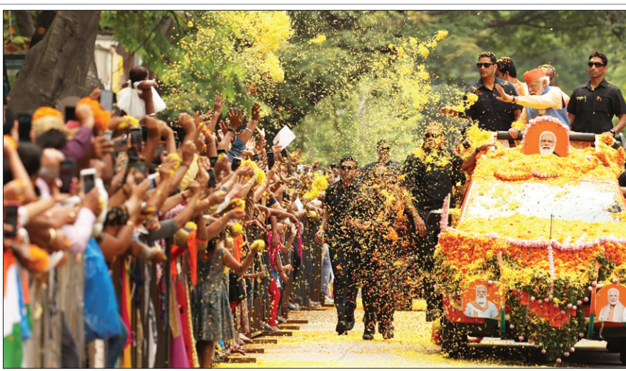
कर्नाटक में रोड शो के दौरान प्रधानमंत्री नरेंद्र मोदी पर पुष्प बरसाते लोग

पीएम नरेंद्र मोदी के कांग्रेस के भ्रष्टाचार के मुद्दे को उठाते हुए कहा कि, इनके पास पता नहीं कौन सा पंजा है जो 1 रुपये में से 85 पैसे खा जाता है? कांग्रेस के इन्हीं कुकर्मों के कारण हमारा देश इतने दरिद्रों तक पिछड़ा बना रहा। यही नहीं जिन बीमारियों को कांग्रेस ने अपने बरसों के शासन में मजबूत किया।