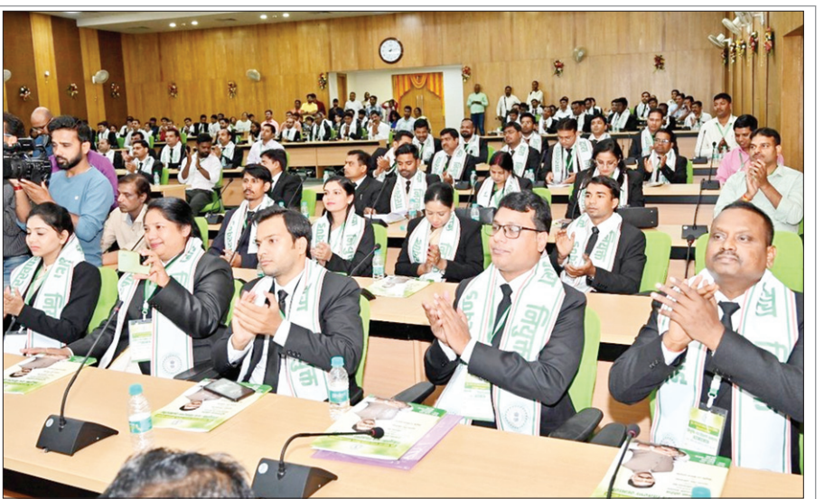
झारखंड मंत्रालय में आयोजित समारोह में नवनिर्वाचित सहायक लोक अभियोजक युवती को नियुक्ति पत्र सौंपते सीएम हेमंत सोरेन व कार्यक्रम में मौजूद सहायक अभियोजन सेवा के लिए चयनित सहायक लोक अभियोजक