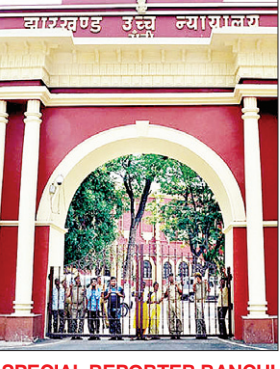
SPECIAL REPORTER RANCHI