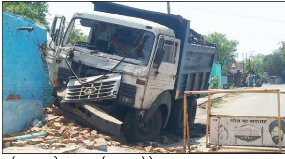
दुर्घटनाग्रस्त कोयला लदा हाईवा।

भदानीनगर ओपी क्षेत्र में महाआटोला में बीती रात्रि कोयला लदा हाईवा असंतुलित होकर घर की चारदिवारी में टक्कर मार दिया। जिसके कारण घर में सो रहे चार लोगो को हल्की-फुल्की चोटें आईं। वहीं घर के पास खड़ा ऑटो भी क्षतिग्रस्त हो गया। बुधवार को हाईवा हटाने पहुंचे पुलिस का ग्रामीण ने जमकर विरोध किया। जिसके बाद स्थानीय लोगो और हाईवा मालिक के साथ त्रिपक्षीय वार्ता हुई। सकारात्मक आशवासन के बाद मामला शांत हो सका। जानकारी के अनुसार मंगलवार की रात्रि करीब 12 बजे भदानीनगर से बरकाकाना की ओर कोयला लेकर जा रहा हाईवा नंबर जेएच 02 एएफ 2133 महाआटोला के पास असंतुलित होकर रांग साईड के मकान के