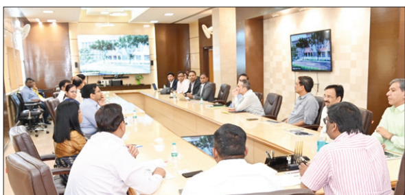
बैठक में उपस्थित सीएम व अन्य अधिकारी। ● द फोटोन न्यूज

मुख्यमंत्री ने कहा कि झारखंड मेडिको सिटी परिसर में कॉमन यूटिलिटी सर्विस- बिजली, पेयजल, सड़क, ड्रेनेज और सीवेज, स्ट्रीट लाइट्स, बायो मेडिकल वेस्ट के डिस्पोजल के लिए आधुनिकतम तकनीकों इस्तेमाल किया जाए, ताकि देश-दुनिया के सामने इसे एक मॉडल मेडिकल हब के रूप में रख सकें। मुख्यमंत्री ने कहा कि झारखंड मेडिको सिटी में पीपीपी मॉडल पर कई सुपर स्पेशलिटी अस्पताल बनाए जाएंगे। ऐसे में सभी अस्पतालों के लिए अलग-अलग एंजुलेंस सेवा होने से यहां की