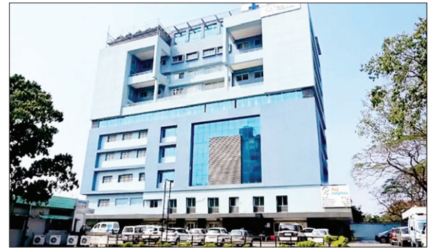
बरियारू स्थित पल्स हॉस्पिटल।