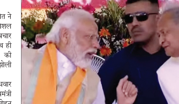
राजस्थान के मुख्यमंत्री अशोक गहलोत से बात करते प्रधानमंत्री नरेंद्र मोदी।

AGENCY RAJASTHAN राजस्थान के मुख्यमंत्री अशोक गहलोत ने प्रधानमंत्री नरेंद्र मोदी से राइट टू सोशल सिव्योरिटी एक्ट लागू करने पर विचार करने का आग्रह किया है। इसके साथ ही उन्होंने प्रधानमंत्री के सामने मांगों की फेहरिस्त रखते हुए राजस्थान की झोली को भरने का आग्रह किया। राजसमंद जिले के नाथद्वारा में बुधवार को प्रधानमंत्री मोदी की सभा में मुख्यमंत्री गहलोत ने तत्कालीन प्रधानमंत्री मनमोहन सिंह के कार्यकाल में देश में लागू किए गए राइट टू इनफोरमेशन, राइट टू एजुकेशन, नरंगा, फूड सिव्योरिटी के साथ राजस्थान में लागू मुख्यमंत्री स्वास्थ्य बीमा योजना चिरंजीवी तथा राइट टू हेल्थ का जिक्र किया। गहलोत ने कहा कि प्रधानमंत्री मोदी राइट टू सिव्योरिटी योजना को पूरे देश में लागू करने पर विचार करें। गहलोत ने उबर-ओला-जोमेटा-स्वीगी जैसी कम्पनियों में डिलीवरी बॉय के रूप में कार्य कर रहे असंगठित क्षेत्र के युवाओं पर भी प्रधानमंत्री से नीति बनाने का आग्रह