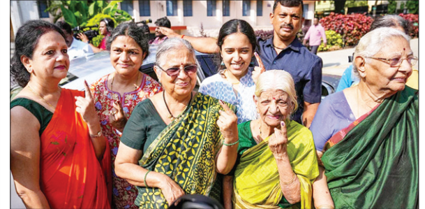
कर्नाटक विधानसभा चुनाव के लिए मतदान करने पहुंची महिलाएं।

AGENCY BENGALURU : कर्नाटक विधानसभा चुनाव के लिए मतदान बुधवार शाम छह बजे समाप्त हो गया। जो आंकड़े सामने आये हैं उसके अनुसार कुल 68.23 प्रतिशत मतदाताओं ने अपने मतदाधिकार का इस्तेमाल किया। रामनगर में सबसे अधिक 78.22 प्रतिशत मतदान दर्ज किया गया है जबकि बृहद बेंगलुरु महानगर पालिका क्षेत्र में सबसे कम 48.63 प्रतिशत दर्ज किया गया। इस बार 9 पोलस में से 3 में कांग्रेस की सरकार बन रही है। 1 पोल भाजपा को बहुमत दे रहा है। जेडीएस को 21 से 28 सीट के साथ 4 सर्वे किंगमेकर बता रहे। यानी 2018 की तरह एक बार फिर जेडीएस के बिना कांग्रेस या भाजपा की सरकार नहीं बनेगी। पोल अंफ पोलस के मुताबिक भाजपा 92, कांग्रेस 107, जेडीएस 20 और अन्य को 5 सीट मिलने का अनुमान है।