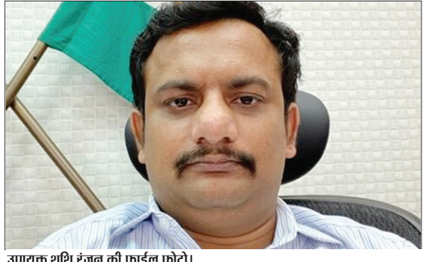
उपायुक्त शशि रंजन की फाईल फोटो।

उपायुक्त शशि रंजन की अध्यक्षता में जिला खनिज फाउंडेशन ट्रस्ट (डीएमएफटी) की बैठक बुधवार को समाहरणालय सभागार में हुई। बैठक में उपायुक्त ने विभिन्न योजनाओं के तहत किये जा रहे कार्यों की अद्यतन स्थिति की जानकारी ली। साथ ही संबंधित विभाग के अधिकारियों को निर्देश दिया कि समय पर सभी योजनाओं को गुणवत्तापूर्ण तरीके से पूर्ण कराएँ, ताकि खनिज प्रभावित उन क्षेत्रों में वहा के परिवेश को अनुसार योजनाओं का चयन किया जाए। डीसी ने कहा कि योजनाओं का चयन पारदर्शी तरीके से ग्रामीणों और जनप्रतिनिधियों के सहयोग से किया जाए। जिला खनन पदाधिकारी ने बताया कि पूर्व में कुल 24 योजनाएँ ली गई थी, जिसमें 18 योजनाएँ पूर्ण हो चुकी हैं, शेष प्रगति पर हैं। खूटी जिले के डीएमएफटी के लिए डिस्ट्रिक्ट एक्शन प्लान का अनावरण किया गया, जिसमें