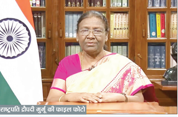
राष्ट्रपति द्रौपदी मुर्मू की फाइल फोटो

PHOTON NEWS RANCHI : राष्ट्रपति द्रौपदी मुर्मू तीन दिवसीय दौरे पर 24 मई को झारखंड आयेंगी। वे 24 से 26 मई तक झारखंड में रहेंगी। उनके कार्यक्रम की सूचना मिलने के बाद सरकार और प्रशासन ने तीन जिलों देवघर, खुंटी और रांची में तैयारियां शुरू कर दी है। इस्टर्न एयर कमांड के सीनियर मेंटेंस स्टाफ देवेन्द्र श्रीवास्तव शनिवार को बाबा मंदिर पहुंचे। उन्होंने मंदिर में अहले सुबह पूजा करने के बाद मंदिर की भौगोलिक स्थिति व अलग-अलग जगहों को देखकर रिपोर्ट तैयार की।