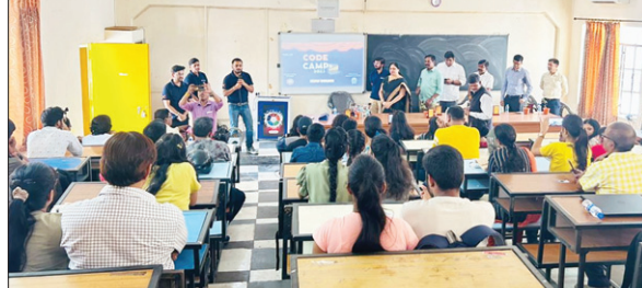
समार कैम्प में भाग लेते बच्चे।

21वीं सदी के कौशल विकास में बच्चों को तकनीकी शिक्षा की भूमिका एवं नई शिक्षा नीति के निहितार्थ प्लॉक्स एजुकेशन प्राइवेट लिमिटेड के द्वारा समार कोड कैम्प का शुभारंभ किया गया। यह कोड कैम्प आज से एक महीने तक चलेगा। इसमें बच्चों को वेब डेवलपमेंट, गेमिंग वीथ पाइथन, ग्राफिक डिजाइनिंग सिखाया जाएगा। इस कोड कैम्प का ध्येय है छात्रों को प्रोग्रामिंग और तकनीकी दक्षता में प्रशिक्षित करना, जिससे वे आगे चलकर समस्याओं का समाधान करने में सक्षम होंगे। इस कैम्प में प्लॉक्स छात्रों को संरचनाओं की बुनियादी समझ, लॉजिकल सोच, और प्रोग्रामिंग भाषाओं की प्रवीणता के साथ परिचित करने के लिए कठिनाईयों के ऊपर उठने का अवसर