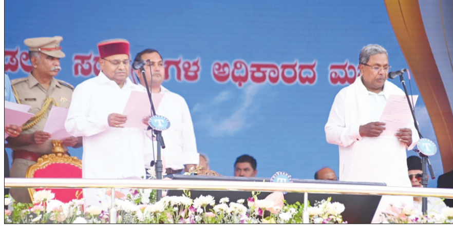
बेंगलूरु के श्री कातीरवा स्टेडियम में नए सीएम सिद्धरमैया को शपथ दिलाते राज्यपाल थावर चंद गहलोत

कर्नाटक में कांग्रेस पार्टी की नई सरकार के गठन के बाद पार्टी अध्यक्ष मल्लिकार्जुन खड़गे ने कहा कि कर्नाटक की जनता से किये गये सभी वादे को पूरा किये जाएंगे। खड़गे ने कहा कि चुनाव के समय जिन पांच वादों को कांग्रेस ने कर्नाटक की जनता से किया था, उसे तय समय में पूरा किया जाएगा।