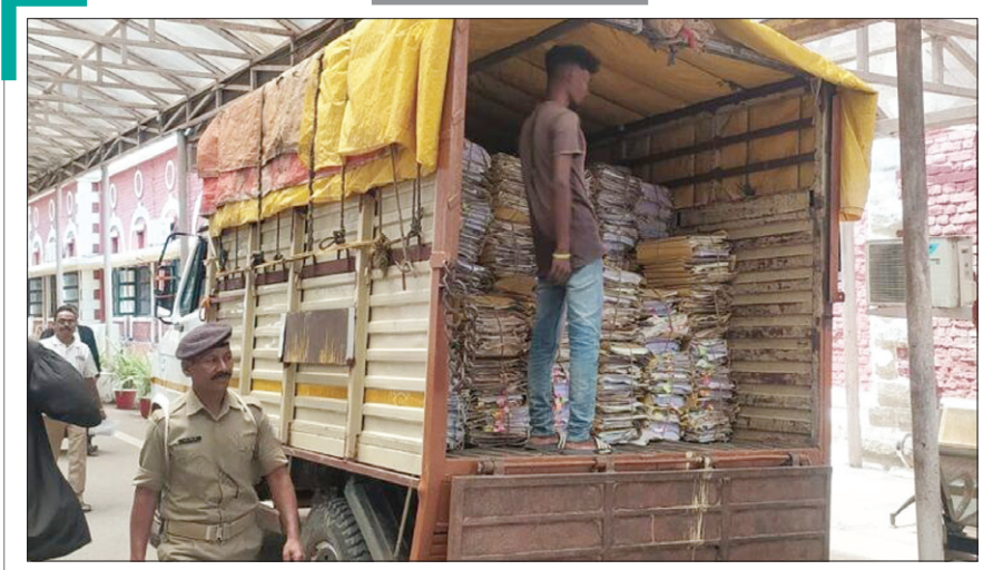
रांची धुर्वा के तिरिल मौजा में 72 एकड़ में बने झारखंड हाईकोर्ट के नए भवन का उद्घाटन 24 मई को राष्ट्रपति द्रौपदी मुर्मू करेंगी। इसके पहले शांतिवार को डोरंडा स्थित झारखंड हाईकोर्ट के पुराने भवन से धुर्वा स्थित हाईकोर्ट के नए भवन में शिफ्टिंग की तैयारी जोर-शोर से शुरू हो गई। पुराने हाईकोर्ट भवन में करीब 37 सेक्टर, जिनमें इस्टैब्लिशमेंट, जुडिशियल सेक्टर, लाइब्रेरी, रिपोर्ट रूम आदि से सामानों, संसाधनों, फाइलों, कंप्यूटर आदि को वाहनों से हाईकोर्ट के नए भवन में ले जाया जा रहा है।

गर्मी छुट्टी मिलती तो विद्यार्थियों को राहत होती। उन्हें इस तपती गर्मी में क्लास करने नहीं आना पड़ता।