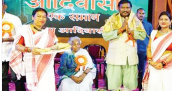
कार्यक्रम में उपस्थित अर्जुन मुंडा।