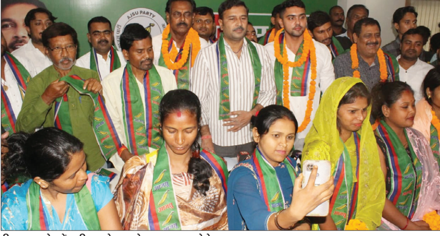
मिलन समारोह में उपस्थित सुदेश महतो व अन्य।

झारखंड के पूर्व उप मुख्यमंत्री एवं आजसू पार्टी के केंद्रीय अध्यक्ष सुदेश कुमार महतो ने कहा कि झारखंड के वर्तमान की जो तस्वीर है, वह भविष्य के लिए खतरनाक संकेत है। राज्य में चौतरफा अराजकता का माहौल है। जनानदेश छल्ला गया है। अब चुप बैठने का समय नहीं है। महतो शनिवार को रांची स्थित केंद्रीय कार्यालय में आयोजित मिलन समारोह में बोल रहे थे। उन्होंने बिजली की चमराई हालत पर कहा कि लचर सिस्टम और कमजोर नेतृत्व के कारण राज्य में यह स्थिति उत्पन्न हुई है। सरकार की अस्पष्ट कार्य योजना और