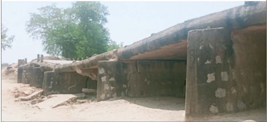
जर्जर हुआ छाता नदी का पुराना पुल। • द फोटोन न्यूज

पिछले वर्ष अगस्त महीने में छाता नदी का पुल ध्वस्त हो गया था। इसके कारण बरसात के दिनों