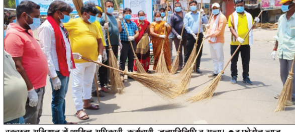
स्वच्छता अभियान में शामिल अधिकारी, कर्मचारी, जनप्रतिनिधि व अन्य। • द फोटोन न्यूज