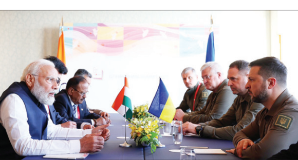
जी-7 शिखर सम्मेलन की बैठक में शामिल प्रधानमंत्री नरेंद्र मोदी व अन्य

प्रधानमंत्री नरेंद्र मोदी ने हिरोशिमा (जापान) में आयोजित जी-7 शिखर सम्मेलन में दुनिया विशेषकर विकासशील देशों के सामने मौजूद खाद्य सुरक्षा, उर्वरक उपलब्धता और महामारी की चुनौतियों का उल्लेख करते हुए अंतरराष्ट्रीय विरादरी का आह्वान किया कि वह इनके समाधान को प्राथमिकता दें। अमेरिका के नेतृत्व वाले विकसित देशों के संगठन जी-7 के शिखर सम्मेलन में प्रधानमंत्री मोदी ने विश्व के सामने मौजूद संकटों पर केंद्रित छठे सत्र को संबोधित किया। उन्होंने ग्लोबल साउथ (विकासशील और गरीब देशों) के सामने मौजूद समस्याओं का मुख्य