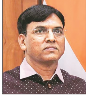
मनसुख मांडविया की फाईल फोटो।

मुताबिक डॉ. मांडविया दुनिया भर के देशों से विभिन्न द्विपक्षीय बैठकों में भाग लेंगे, भाग लेने वाले देशों के बीच स्वास्थ्य देखभाल सहयोग के अवसरों को बढ़ावा देंगे और मीडिया बातचीत में भी भाग लेंगे। द्विपक्षीय बैठकों में सिंगापुर,