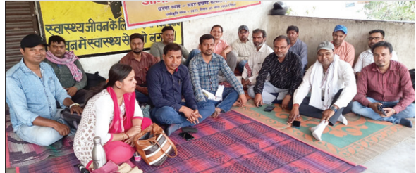
अनिश्चितकालीन हड़ताल पर बैठे जनसेवक । ● द फोटोन न्यूज

जनसेवक अपने 10 वर्ष की निर्मित सेवा के उपरांत इस आस में था कि उन्हे इस एजेंज में उचित सम्मान मिलेगा, परंतु अपने ही कृषि विभाग के द्वारा छल पूर्वक ग्रेड पे कम