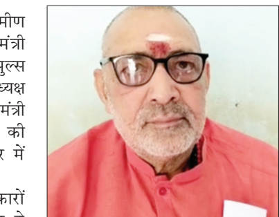
गिरिराज सिंह की फाईल फोटो।

सोमवार को बेगूसराय में पत्रकारों से बात करते हुए गिरिराज सिंह ने कहा है कि आज महबूबा मुफ्ती टीपू सुल्तान के मजार पर फतिहा पढ़ने की बात कर रही है। वह अक्रांता और