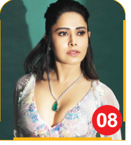
बेकार फिल्में दर्शक रिजेक्ट करें : नुसरत