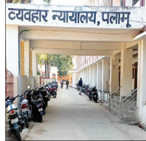
व्यवहार न्यायालय, पलामू