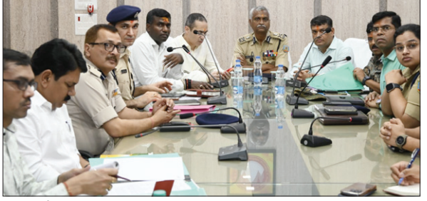
समीक्षा बैठक में एडीजी व अन्य अधिकारी।

बैठक में अब तक किए गए कार्यों की बिन्दुआर समीक्षा के अलावा सुरक्षा-विधि व्यवस्था को लेकर अधिकारियों को निर्देश दिया गया। बैठक के दौरान