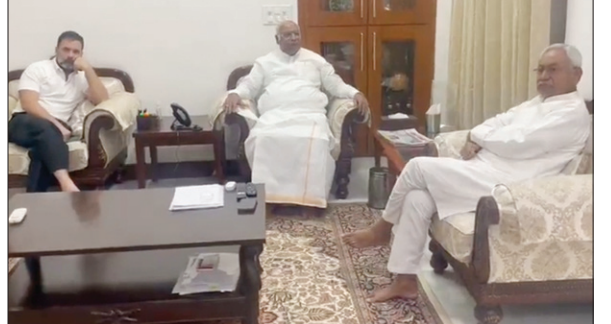
मल्लिकार्जुन खड़गे से मुलाकात करते नीतीश कुमार।

NEW DELHI : केन्द्र की भारतीय जनता पार्टी की सरकार के खिलाफ विपक्षी पार्टियों को लामबंद करने की मुहिम में आज बिहार के मुख्यमंत्री नीतीश कुमार कांग्रेस अध्यक्ष मल्लिकार्जुन खड़गे से मिले। इसके बाद कांग्रेस की ओर से बयान आया कि विपक्षी पार्टियों की जल्द ही एक बैठक आयोजित की जाएगी। बिहार के मुख्यमंत्री नीतीश कुमार आज मलिकार्जुन खड़गे से उनके आवास पर मिले। इस दौरान कांग्रेस नेता राहुल गांधी भी उपस्थित रहे। मुलाकात के बाद कांग्रेस के महासचिव बीके वेणुगोपाल ने कहा कि विपक्षी पार्टियों की बैठक को लेकर हमारे बीच एक विस्तृत चर्चा हुई। बैठक की तारीख और स्थान अगले एक-दो दिन में तय किया जाएगा। उल्लेखनीय है कि पिछले काफी समय से बिहार के मुख्यमंत्री नीतीश कुमार विपक्षी पार्टियों को एकजुट करने के लिए विभिन्न पार्टियों के नेताओं से मुलाकात कर रहे हैं। इससे पहले कल दिल्ली में उन्होंने मुख्यमंत्री अरविंद केजरीवाल से मुलाकात की थी।