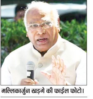
मल्लिकार्जुन खड़गे की फाईल फोटो।

कांग्रेस अध्यक्ष मल्लिकार्जुन खड़गे ने कहा कि नए संसद भवन का उद्घाटन राष्ट्रपति को करना चाहिए। वह संविधान और देश के हर नागरिक का प्रतिनिधित्व करते हैं। खड़गे ने सोमवार को टीवी कर कहा कि मोदी सरकार दलित और जनजातीय समुदायों से राष्ट्रपति केवल चुनावी वजहों से बनाती है। उन्होंने कहा कि जब इस नए संसद भवन का शिलान्यास हुआ तो तत्कालीन राष्ट्रपति रामनाथ कोविंद को नहीं बुलाया गया और अब उद्घाटन समारोह में राष्ट्रपति द्रौपदी मुर्मू को निमंत्रण नहीं दिया गया। उल्लेखनीय है कि प्रधानमंत्री नरेन्द्र मोदी लगभग 1200 करोड़ रुपये की लागत से बनकर तैयार नए संसद भवन का 28 मई को उद्घाटन करेंगे। पीएम मोदी के जरिये किये जाने वाले प्रस्तावित उद्घाटन को लेकर कांग्रेस नेता राहुल गांधी ने भी आपत्ति जताई थी। कल राहुल गांधी ने भी टीवी कर कहा था कि नए संसद भवन का उद्घाटन राष्ट्रपति को ही करना चाहिए, प्रधानमंत्री को नहीं।