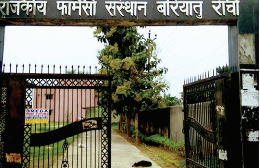
भरा जाना है। जबकि फार्मेसी कॉलेज में वर्तमान में 1 प्राध्यापक और 3 लेक्चरर की कार्यरत हैं। न ही यहां कार्यालय अधीक्षक और

राजकीय फार्मेसी कॉलेज में पढ़ रहे स्टूडेंट्स का भविष्य अंधकारमय है। ऐसा इसलिए क्योंकि यहां स्वीकृत पद की तुलना में आधे भी टीचिंग स्टाफ नहीं हैं। स्वास्थ्य विभाग ने 8 पद सृजित किए हैं। इसमें 1 प्राध्यापक, 4 लेक्चरर, 1 कार्यालय अधीक्षक व 2 लैब टेक्नीशियन हैं। जबकि नौ टीचिंग में कंप्यूटर ऑपरेटर 1, मोटरयान चालक 1, माली और सफाईकर्मी के 1-1 पद हैं। नौन टीचिंग के पद को आउटसोर्स से