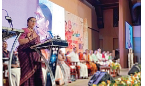
कार्यक्रम में जनता को संबोधित करती स्मृति ईरानी।

NEW DELHI : केंद्रीय महिला एवं बाल विकास मंत्री स्मृति ईरानी ने केरल राज्य सरकार से अधिक महिला कार्यबल वाले स्थानों पर ज्यादा से ज्यादा क्रेच (शिशु देख भाल केन्द्र) शुरू करने का आग्रह किया। केंद्रीय मंत्री भारत की अध्यक्षता में थ्रम-20 बैठक के हिस्से के रूप में तिरुवनंतपुरम में बीएमएस राज्य महिला सम्मेलन के उद्घाटन समारोह में संबोधित कर रही थी। इस मौके पर स्मृति ईरानी ने कहा कि केरल में आंगनवाड़ी केन्द्रों को तकनीकी की मदद से और आधुनिक बनाने की जरूरत है। केंद्रीय मंत्री ने कहा कि केरल में 33,000 आंगनवाड़ी केन्द्र हैं, जिसमें पंचवैश्वक के 13 प्रतिशत पद खाली पड़े हैं। इन पदों को शीघ्र भरा जाना चाहिए। स्मृति ईरानी ने यह भी कहा कि प्रधानमंत्री मातृ वंदना योजना लाभार्थियों की पहचान करने और सीधे लाभ प्रदान करने के लिए प्रौद्योगिकी का उपयोग करती है। उन्होंने यह भी कहा कि राज्य सरकार अधिक लाभार्थियों की पहचान करती है तो भी केंद्र सरकार वित्तीय सहायता प्रदान करने के लिए तैयार है। केंद्रीय संसदीय कार्य राज्य मंत्री वी. मुरलीधरन ने इस मौके पर राज्य सरकार से राज्य में कार्यस्थलों पर महिलाओं को सुरक्षा प्रदान करने का आग्रह किया। उन्होंने यह भी कहा कि भारत की जी 20 अध्यक्षता पूरे समाज की प्रगति को शामिल करने वाला एक बड़ा कार्यक्रम बन रहा है।