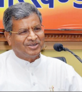
बाबूलाल मरांडी की फाईल फोटो।

ये एक तरह से मेन स्ट्रीम मीडिया के पैरलल ग्राउंड लेवल की रिपोर्टिंग कर रहे हैं पर एक युवराज को यह स्वीकार नहीं हुआ कि कैसे आम आदमी भी उसके