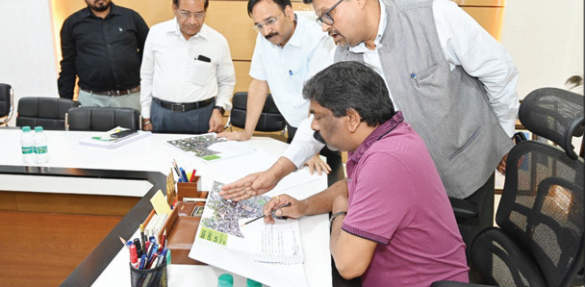
जुडको की योजना की जानकारी लेते सीएम हेमंत सोरेन

सीएम हेमंत सोरेन ने सोमवार को कांके रोड रांची स्थित मुख्यमंत्री आवासीय कार्यालय में झारखंड अर्बन इन्फ्रास्ट्रक्चर डेवलपमेंट कंपनी लिमिटेड (जुडको) के अधिकारियों के साथ बैठक की। इस बैठक में जुडको के अधिकारियों ने मुख्यमंत्री के समक्ष प्रस्तावित जोनल ब्यूटीफिकेशन एंड रोडेवलपमेंट ऑफ एंक्विजिटेड स्ट्रीट एंड रिलेडेड इन्फ्रास्ट्रक्चर प्रॉम अल्बर्ट एक्का चौक कचहरी चौक एंड सराउंडिंग एरियाज इन रांची के मास्टर प्लान का पावर पॉइंट प्रेजेंटेशन रखा। जुडको द्वारा प्रस्तावित इस कार्य योजना के तहत रांची के अल्बर्ट एक्का चौक से