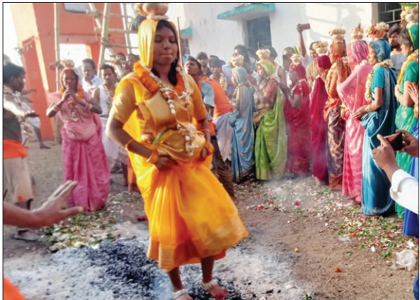
दहकते अंगारों पर चलते शिवभक्त ।