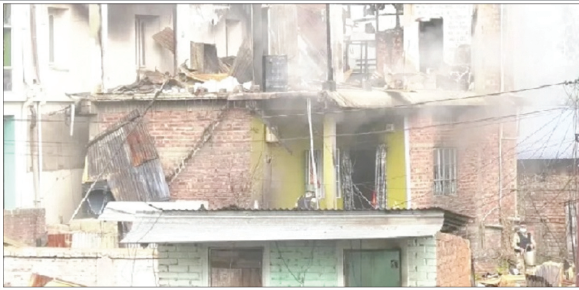
मणिपुर की राजधानी इंपाल में उपद्रवियों द्वारा घर पर लगाई आग से निकलता धुंआ

मणिपुर में 18 दिन बाद एक बार फिर हिंसा हुई। राजधानी इंपाल में सोमवार को उपद्रवियों ने खाली पड़े घरों में आग लगा दी। मीडिया की खबरों में कहा जा रहा है कि पहले ही हिंसा के बाद जो लोग अपने-अपने घर छोड़कर पलायन कर चुके हैं, उपद्रवियों ने उन घरों में आग लगा दी है। उधर, भारतीय सेना ने सोमवार को कहा कि हिंसाग्रस्त मणिपुर के इंपाल के बाहरी इलाके में संभावित आपसी संघर्ष के इनपुट के बाद संवेदनशील इलाकों में सेना और असम राइफल के जवानों को तैनात कर दिया गया। उसने कहा कि फिलहाल इंपाल के बाहरी इलाकों में स्थिति नियंत्रण में है। इस दौरान करीब तीन सौ दिग्धों को हिरासत में लिया गया है। उनके पास से दो हथियार भी बरामद किए गए हैं। उसने कहा कि स्थिति शांतिपूर्ण है। मीडिया की रिपोर्ट के अनुसार, पहाड़ी राज्य मणिपुर में सोमवार को हिंसा एक बार फिर भड़क गई। इस दौरान उपद्रवियों ने उन घरों में आग लगा दी है, जो अपने-अपने घरों को छोड़कर पड़ोसी राज्यों में शरण लिये हुए हैं। समाचार एजेंसी एएनआई के एक ट्वीट की अनुसार, उपद्रवियों ने न्यू लैंडुलिन इलाके में पलायन करने वाले परिवारों के खाली घरों में आग लगा दी। वहीं, समाचार एजेंसी पीटीआई ने बताया कि आगजनी के कारण कोई हताहत