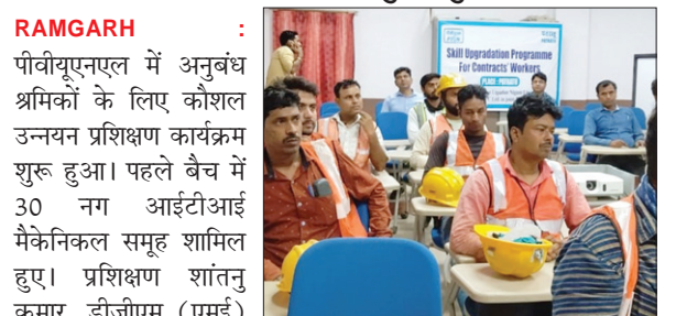
प्रशिक्षण में शामिल श्रमिक । ● द फोटोन न्यूज

पीवीयूएनएल में अनुबंध श्रमिकों के लिए कौशल उन्नयन प्रशिक्षण कार्यक्रम का हुआ शुभारंभ