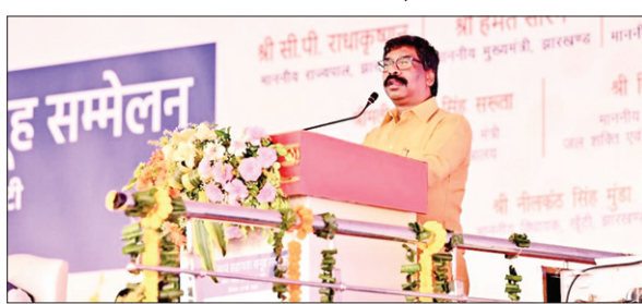
खूटी में कार्यक्रम को संबोधित करते सीएम हेमंत सोरेन

BUREAU CHIEF RANCHI : मुख्यमंत्री हेमंत सोरेन ने खूटी में राष्ट्रपति द्रौपदी मुर्मू से राज्य में सरना धर्म कोड लागू करवाने की मांग की। सीएम राष्ट्रपति से कहा कि आदिवासी समुदाय के जीवन मरण से जुड़ी कुछ मांगें हैं, केंद्र सरकार से इन्हें लागू करने की अनुमति दिलाई जाय। इनमें सरना धर्म कोड को लागू करना। हो, मुंडारी और कुदुख भाषा को 8 वीं अनुसूची में शामिल करने की मांग शामिल है। साथ ही कहा कि आदिवासी समाज की अस्मिता और पहचान को बनाए रखने के लिए यह जरूरी है। क्योंकि, यह उनके मान-सम्मान के साथ जुड़ा हुआ है। राष्ट्रपति द्रौपदी मुर्मू की उपस्थिति में सोरेन ने कहा कि आदिवासियों के लिए बनने वाली सभी योजनाएं सिर्फ कागजों पर