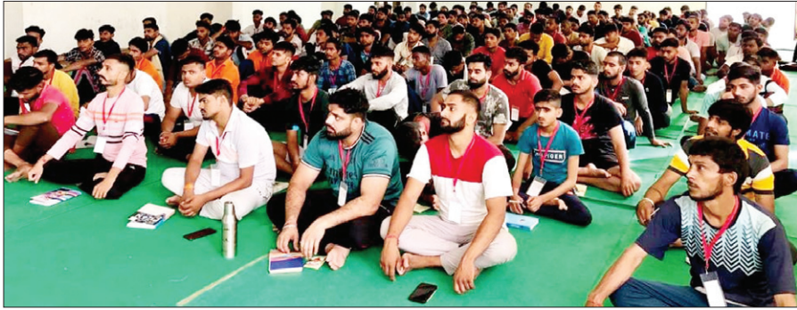
प्रशिक्षण वर्ग में शामिल कार्यकर्ता। ● द फोटोन न्यूज

बिजनूर गोलबाग कृष्णा इंस्टिट्यूट में 23 मई से 30 मई तक विश्व हिन्दू परिषद ने बजरंग