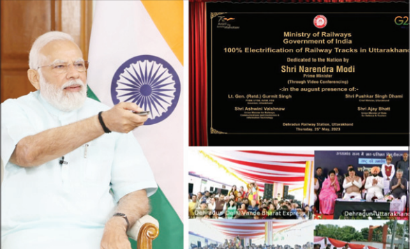
वर्चुअल माध्यम से वंदे भारत ट्रेन का उद्घाटन करते पीएम

AGENCY DEHRADUN प्रधानमंत्री नरेंद्र मोदी ने गुरुवार को देवभूमि उत्तराखंड को देहरादून-दिल्ली (आनंद विहार टर्मिनल) वंदे भारत एक्सप्रेस की नई सौगात दी। प्रधानमंत्री ने वर्चुअल माध्यम से हरी झंडी दिखाकर देहरादून-दिल्ली वंदे भारत एक्सप्रेस का शुभारंभ किया। इस अवसर पर उन्होंने उत्तराखंड के समस्त रेल मार्गों के लिए विद्युतीकरण की सौगात भी दी। प्रधानमंत्री नरेंद्र