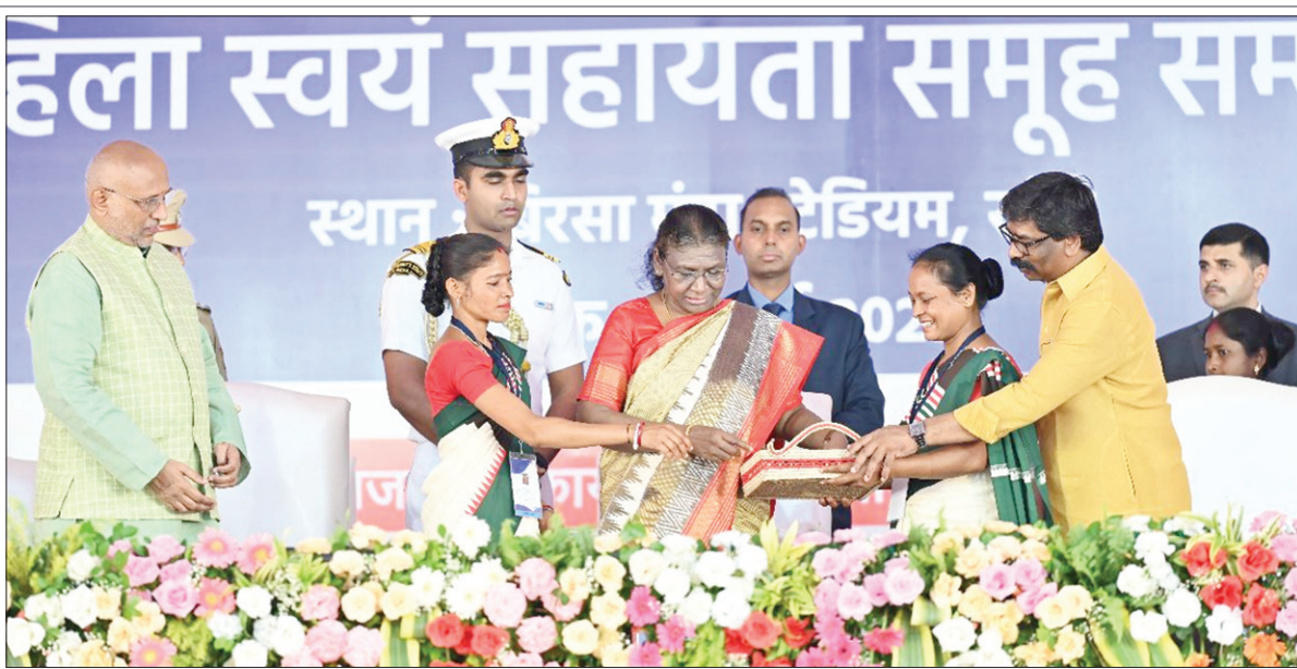
खूटी में आयोजित स्वयं सहायता समूह महिला सम्मेलन में राष्ट्रपति द्रौपदी मुर्मू, सीएम हेमंत सोरेन, राज्यपाल सीपी राधाकृष्णन व अन्य