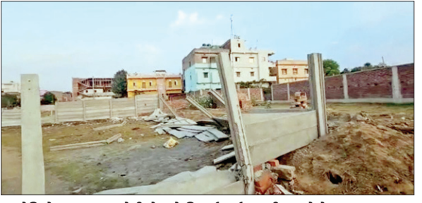
आरोपियों द्वारा पंडरा ओपी क्षेत्र में गिराई गई बाउंड्री