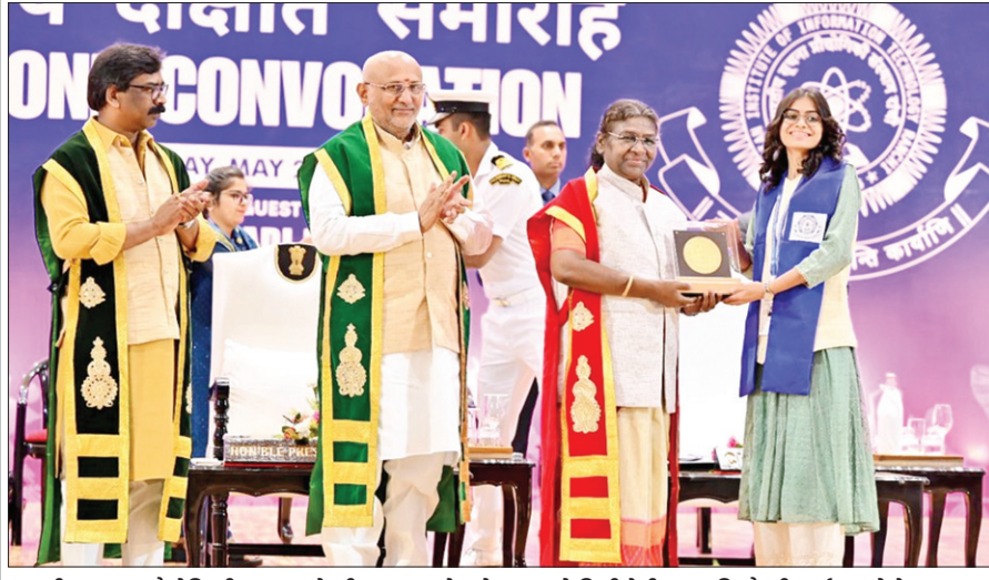
भारतीय सूचना प्रौद्योगिकी संस्थान के दीक्षांत समारोह में छात्रा को डिग्री देती राष्ट्रपति द्रौपदी मुर्मू