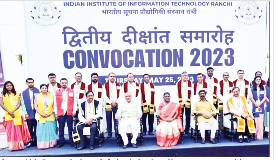
ट्रिपल आईटी के दीक्षांत समारोह में राष्ट्रपति द्रौपदी मुर्मू, सीएम हेमंत सोरेन, राज्यपाल व अन्य