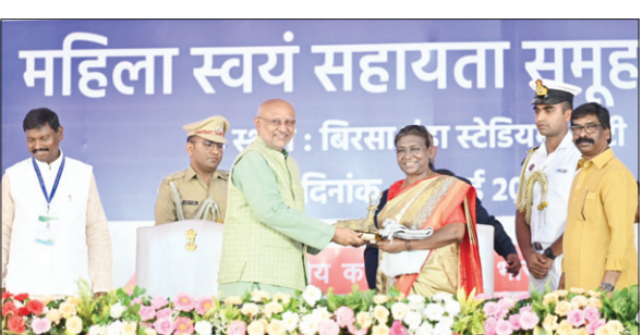
राष्ट्रपति द्रौपदी मुर्मू को मोगेटो देते राज्यपाल सीपी राधाकृष्णन

BUREAU CHIEF RANCHI : राष्ट्रपति द्रौपदी मुर्मू के झारखंड दौरे के दूसरे दिन खूटी के बिरसा मुंडा कॉलेज में गुरुवार को आयोजित महिला स्वयं सहायता सम्मेलन को संबोधित करते हुए राज्यपाल सीपी राधाकृष्णन ने कहा कि भारत की राष्ट्रपति का समस्त झारखंड राज्यवासियों की ओर से बिरसा मुंडा की इस पावन भूमि पर हार्दिक स्वागत व अभिनंदन करता हूँ।