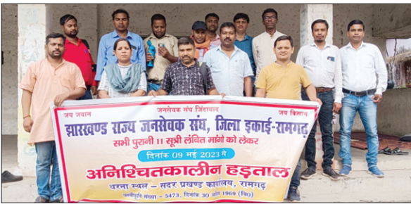
धरने में शामिल जनसेवक संघ के लोग।