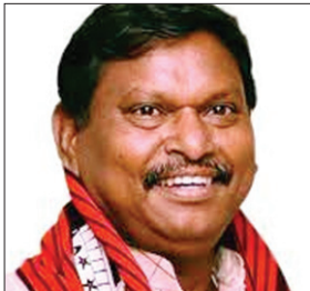
केंद्रीय मंत्री अर्जुन मुंडा की फाईल फोटो।

उन्होंने कहा कि महिलाएं सशक्त हों, यह मोदी सरकार की मंशा है। बेटी पढ़ाओ-बेटी बड़ाओ के मूल मंत्र के साथ काम हो रहा है। मुंडा ने अपील किया