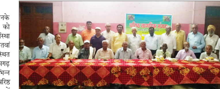
कार्यक्रम में उपस्थित वरिष्ठ नागरिक संगम के सदस्य। ● द फोटोन न्यूज

कार्यक्रम का शुभारंभ विधिवत दीप प्रज्वलन एवं शांति पाठ से हुआ। सभी के स्वगतोपरित विशिष्ट वरिष्ठ जनों को उनकी योग्यता व उपलब्धियों हेतु पुष्प गुच्छ एवं अंग-वस्त्र दे कर सम्मानित किया गया।