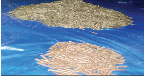
बरामद गोलियाँ।