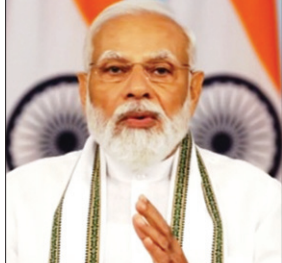
प्रधानमंत्री नरेन्द्र मोदी की फाईल फोटो।

प्रधानमंत्री ने असम सरकार में नौकरियों के लिए भर्ती हुए युवाओं और उनके परिवारों को बधाई दी। उन्होंने पिछले महीने बिहू के अवसर पर राज्य की अपनी यात्रा को याद किया और कहा कि अस्मिया संस्कृति के महिमांडन के प्रतीक