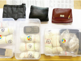
आरोपियों के पास से बरामद सामान

झारखंड एटीएस की टीम ने मादक पदार्थ की तस्करी करने वाले तीन तस्करो को बरकाकाना रेलवे स्टेशन से गिरफ्तार किया है। आरोपी के पास से एम्फैटामिन पाउडर (कोक्रिन का विकल्प) 750 ग्राम, 45 ग्राम ब्राउन सुगर, 350 ग्राम हेरोइन मिक्स क्रिस्टल, 10 हजार नगदी, एम्फैटामिन पाउडर बरामद किया गया है। एटीएस की टीम को गुप्त सूचना मिली थी कि सभी आरोपी भोपाल- कोलकाता एक्सप्रेस से मादक पदार्थ की तस्करी कर रहे हैं। सूचना पर तीनों आरोपियों को बरकाकाना रेलवे स्टेशन से छापेमारी कर गिरफ्तार किया गया। गिरफ्तार आरोपियों की पहचान बिहार के