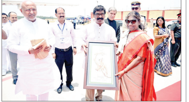
राष्ट्रपति द्रौपदी मुर्मू को मोगेंटी देते सीएन हेमंत सोरेन

राष्ट्रपति द्रौपदी मुर्मू अपने तीन दिवसीय दौरे का शुक्रवार को समापन कर रांची से नई दिल्ली के लिए रवाना हुईं। राज्यपाल सीपी राधाकृष्णन और मुख्यमंत्री हेमंत सोरेन सहित कई गणमान्य लोगों ने उन्हें विदा किया। इस क्रम में राष्ट्रपति ने हाथ हिलाकर जोहार बोलते हुए सभी का अभिवादन स्वीकार किया और दिल्ली रवाना हो गईं। इससे पहले उन्होंने 25 मई को