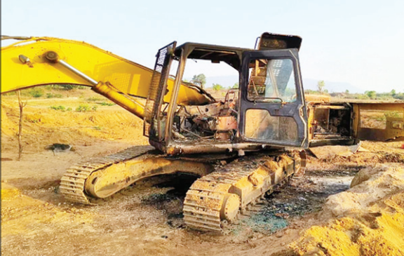
लातेहार में नक्सलियों द्वारा जलाया हुआ पोकलेन

CRIME REPORTER LATEHAR : लातेहार जिले के महुआडांड थाना क्षेत्र अंतर्गत सरनाडीह गांव के पास पुल निर्माण कार्य के साइडिंग पर गुरुवार रात नक्सलियों ने जमकर उत्पात मचाया। इस दौरान नक्सलियों ने पुल निर्माण कार्य में लगे एक पोकलेन तथा चार ट्रैक्टरों को जला दिया। इधर घटना की जानकारी मिलने के बाद पुलिस बल घटनास्थल स्थल पर पहुंच कर मामले की जांच कर रही है।