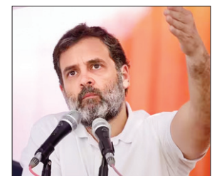
सरकार चीन और राष्ट्रीय सुरक्षा के मामले में विफल है। विपक्षी दलों और नेताओं के खिलाफ बदले की भावना से कार्रवाई की जा रही है। कोरोनाकाल में यह सरकार पूरी तरह असहाय दिखी। करोड़ों लोगों को मिसमैनेजमेंट के कारण पलायन करना पड़ा था। राहुल ने कहा कि मोदी सरकार के पास 09 वर्ष के शासनकाल में कुछ भी दिखाने को नहीं है।

कहा, नया संसद भवन हर भारतीय को गौरवान्वित करेगा। यह वीडियो इस प्रतिष्ठित इमारत को एक झलक पेश करता है। मेरा एक विशेष अनुरोध है- इस वीडियो को अपने वॉयस-ओवर के साथ साझा करें, जो आपके विचारों को व्यक्त करता है। उल्लेखनीय है कि नए संसद भवन का उद्घाटन समारोह 28 मई को सुबह हवन और सर्व-धर्म प्रार्थना के साथ शुरू होगा।