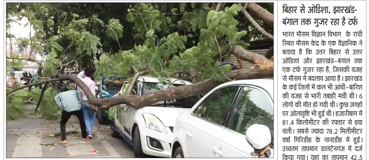
रांची के हिन्नु में आंधी-बारिश के वजह से कार पर गिरा विशाल पेड़, कुछ देर तक ट्रैफिक हुआ जाम • फोटोन न्यूज

राजधानी रांची समेत आस पास के इलाकों में शुक्रवार दोपहर जमकर बारिश हुई। इस दौरान राजधानी समेत आस पास के इलाकों में 40 किलोमीटर प्रति घंटा की रफ्तार से हवाएं चली। जिससे कुछ इलाकों में पेड़ गिरने की घटना हुई। पेड़ गिरने वाले इलाकों में हरमू, हिनू, बिरसा चौक, नामकुम, पुंदाग समेत अन्य इलाके शामिल हैं। इससे इन इलाकों में बिजली परिणाम भुगतना होगा। हालांकि शुक्रवार को हुई बारिश के बाद कुछ इलाकों में तेज धूप भी देखा गया। राजधानी रांची के साथ ही इस दौरान दुमका, गिरिडीह, देवघर, जामताड़ा में भी बारिश हुई। तपती गर्मी के साथ ही बारिश होने से लोगों को गर्मी से राहत मिली। आपको बता दें कि दोपहर में करीब पौने 1 बजे के आसपास आसमान में काले बादल घिर आये। तेज हवाएं चलने लगीं। थोड़ी ही देर में बारिश शुरू हो गयी। लोगों को गर्मी से राहत तो मिली, लेकिन सड़क पर पेड़ गिरने की वजह से आने-जाने वाले लोगों को परेशानियों का सामना करना पड़ा। ट्रैफिक व्यवस्था गड़बड़ा गयी। मौसम विभाग की ओर से पहले ही रांची