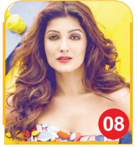
दिवंकल थी करण जौहर का पहला प्यार