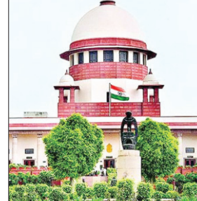
उद्घाटन प्रधानमंत्री नरेंद्र मोदी करेंगे। संसद राष्ट्रपति और संसद के दोनों सदनों से मिलकर बनती है। राष्ट्रपति देश का प्रथम नागरिक होता है। राष्ट्रपति के साथ संसद बुलाने और उसे खत्म करने की शक्ति है।

जया सुकिन से सवाल कि अगर आप हाईकोर्ट जाना चाहते हैं तो हम याचिका रद्द कर देंगे। इस पर सुकिन ने कहा- मैं हाईकोर्ट भी नहीं जाऊंगा। मैं नहीं चाहता याचिका रद्द हो, वरना सरकार को ऐसे इन्ऑग्रेशन का सर्टिफिकेट मिल जाएगा। सुकिन ने गुरुवार को यह याचिका दायर की थी। उन्होंने कहा था कि लोकसभा सचिवालय ने राष्ट्रपति को इन्ऑग्रेशन में न बुलाकर संविधान का उल्लंघन किया है। इन्ऑग्रेशन राष्ट्रपति ही करते। एडवोकेट जया सुकिन ने याचिका में कहा था कि मैं को लोकसभा सचिवालय की ओर से बताया गया था कि नए संसद का