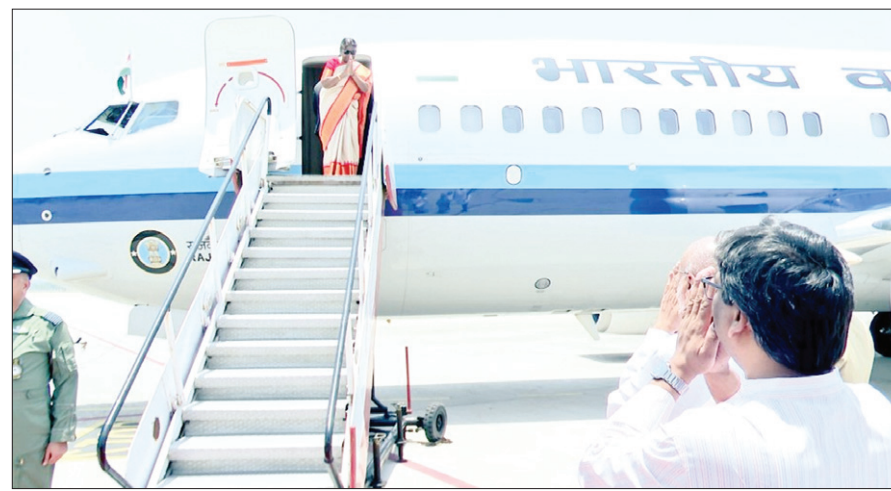
राष्ट्रपति द्रौपदी मुर्मू को विदा करते सीएन हेमंत सोरेन

इसके अलावा राष्ट्रपति ने ट्वीट करके भी कहा कि झारखंड के लोगों के प्यार ने उन्हें भाव विभोर कर दिया। अपनी खुशी जाहिर करते हुए महामहिम लिखती हैं कि झारखंड की इस धरती को मैं प्रणाम करती हूँ। आप सबके स्नेहपूर्ण स्वागत ने मुझे भाव-विभोर कर दिया है। मुझे झारखंड