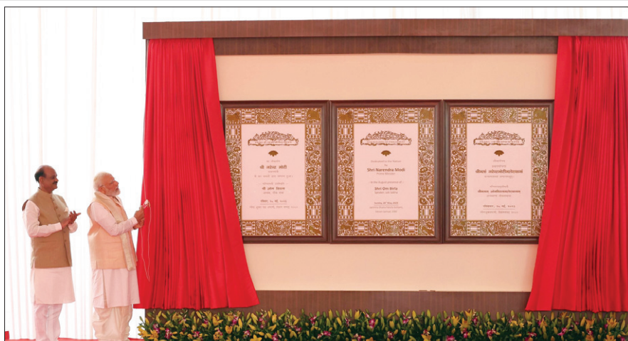
नए संसद भवन का उद्घाटन करते प्रधानमंत्री नरेंद्र मोदी

प्रधानमंत्री नरेंद्र मोदी ने रविवार को नया-भवन संसद भवन को राष्ट्र को समर्पित किया। इससे पूर्व उन्होंने वैदिक मंत्रोच्चार के बीच नए संसद भवन में सेंगोल को स्थापित किया। इसके बाद उन्होंने भवन निर्माण में योगदान देने वाले श्रमजीवियों का सम्मान किया। इस दौरान कार्यक्रम में उपस्थित गणमान्य व्यक्तियों को संबोधित करते हुए प्रधानमंत्री ने कहा कि हमारा लोकतंत्र हमारी प्रेरणा और हमारा संविधान हमारा संकल्प है। संसद इस प्रेरणा और संकल्प की श्रेष्ठ प्रतिनिधि है। नई संसद में लिया गया हर निर्णय समाज के सभी वर्गों के भाग्य का फैसला करेगा और यहां बने कानूनों से गरीबी दूर करने में मदद मिलेगी। प्रधानमंत्री सुबह-सुबह रायसीना हिल्स स्थित संसद भवन पहुंचे और सर्वप्रथम महात्मा गांधी की प्रतिमा पर पुष्पांजलि अर्पित की। नए संसद भवन में पूजा कार्यक्रम आयोजित किया गया। सेंगोल की स्थापना के पश्चात विधिवत पढ़िका अनावरण करते हुए लोकसभा अध्यक्ष ओम बिरला के साथ प्रधानमंत्री ने नए संसद भवन को राष्ट्र को समर्पित किया। दोपहर में नए भवन के लोकसभा कक्ष में कार्यक्रम आयोजित किया गया। इस दौरान प्रधानमंत्री ने कोलकाता टकसाल में तैयार 75 रुपये का सिक्का और डाक विभाग की ओर से जारी विशेष डाक टिकट भी जारी किया।