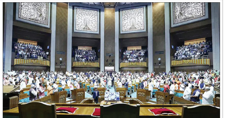
नए भवन के उद्घाटन के बाद लोकसभा कक्ष में आयोजित कार्यक्रम में शामिल लोग