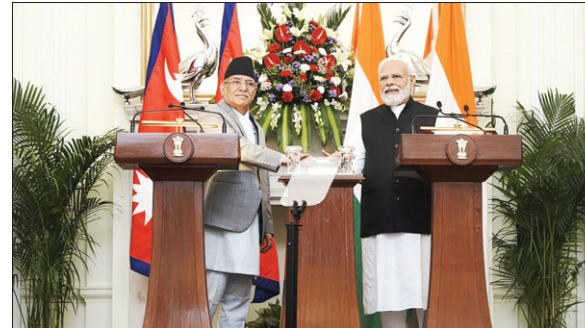
नेपाल के प्रधानमंत्री प्रचंड के साथ पीएम नरेंद्र मोदी

भारत और नेपाल ने व्यापार और ऊर्जा सहित कई क्षेत्रों में सहयोग को बढ़ावा देने के लिए गुरुवार को सात समझौतों पर हस्ताक्षर किए। इस दौरान प्रधानमंत्री मोदी ने दोनों देशों के संबंधों को हिट बताया और कहा कि हम अपने रिश्तों को हिमालय जितना ऊंचाई देने के लिए काम करते रहेंगे। प्रधानमंत्री मोदी ने नई दिल्ली के हैदराबाद हाउस में नेपाल के प्रधानमंत्री पुष्प कमल दहल प्रचंड से गुरुवार को मुलाकात की। इसके बाद दोनों प्रधानमंत्रियों के बीच द्विपक्षीय और प्रतिनिधिमंडल स्तर की वार्ता हुई। वार्ता के बाद दोनों नेताओं ने साझा प्रेसवार्ता को संबोधित किया। दोनों नेताओं की उपस्थिति में भारत और नेपाल के बीच समझौतों का आदान-प्रदान हुआ। दोनों नेताओं