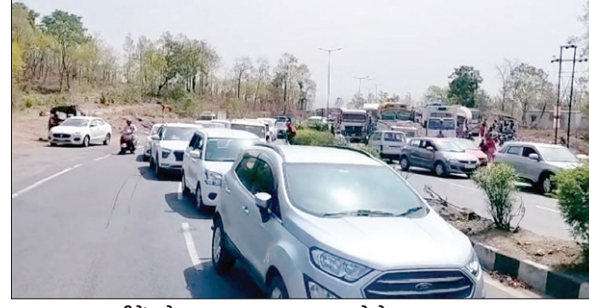
सड़क पर एक्सीडेंट के बाद लगा जाम। ● द फोटोन न्यूज

PHOTON NEWS RAMGARH : रांची पटना राष्ट्रीय राजमार्ग-33 पर रामगढ़ के चुटूपाळु घाटी में एक ट्रेलर ने गुरुवार को कोहराम मचा दिया। अनियंत्रित ट्रेलर ने कई गाड़ियों को टक्कर मारी और घाटी में डिवाइडर से टकराकर दुर्घटनाग्रस्त हो गई। इस हादसे में बुलेट बाइक पर