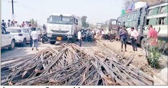
रोड पर रखा गया सरिया।

सरिया लदा ट्रेलर रांची की ओर से रामगढ़ की तरफ आ रहा था