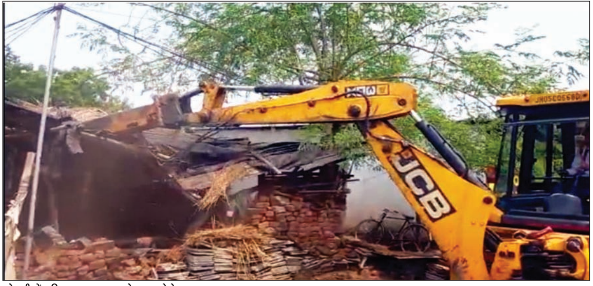
सोनारी में अतिक्रमण हटाया बुलडोजर • फोटोन न्यूज

जिला प्रशासन द्वारा इस समय अतिक्रमण को लेकर विशेष अभियान चलाया जा रहा है। इसके तहत जमशेदपुर अधिसूचित क्षेत्र समिति एवं जिला प्रशासन एक्शन मोड में है हर दिन अलग-अलग क्षेत्रों में अधिसूचित क्षेत्र समिति की ओर से अतिक्रमण हटाया जा रहे हैं। खासकर ऐसे अतिक्रमण जो मुख्य सड़कों के आसपास किए गए हैं फोन पर बुलडोजर चल रहा है ताकि शहर को साफ सुथरा एवं जाम मुक्त बनाया जा सके। इसी क्रम में बुधवार को सोनारी थाना अंतर्गत ग्वाला बस्ती नॉर्थ में बने अवैध दुकान एवं खटालों को जेसीबी से ध्वस्त किया गया। यहां 2 दर्जन से अधिक दुकान,