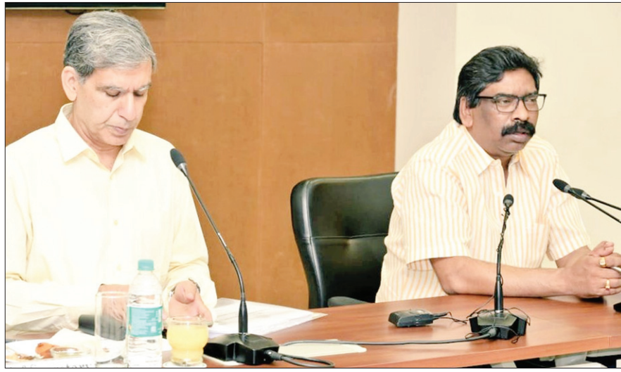
जोहार परियोजना पोर्टल पर अपलोड योजनाओं की समीक्षा बैठक में सीएम हेमंत सोरेन

मुख्यमंत्री हेमंत सोरेन ने गुरुवार को जोहार परियोजना पोर्टल पर अपलोड योजनाओं की समीक्षा की। इस मौके पर उन्होंने का कहा कि गुड गवर्नेंस के लिए जरूरी है कि योजनाएं तय समय पर पूरी हों। योजनाओं में गुणवत्ता का पूरा ख्याल रखा जाए। विशेषकर बजट में विभिन्न विभागों के लिए जो बजटीय प्रावधान किए जाते हैं, उसके अनुरूप कार्यों में गति होनी चाहिए। इसके लिए अधिकारियों को पूरी जवाबदेही और गंभीरता से कार्य करना हो। जोहार परियोजना पोर्टल पर अपलोड योजनाओं की पहली समीक्षा करते हुए मुख्यमंत्री ने कहा कि इसमें कई बदलाव करने की जरूरत है। इस सिलसिले में आगे जो भी बैठक होगी, उसने मंत्रीगण भी मौजूद रहेंगे, ताकि इसकी हर स्तर पर विस्तृत समीक्षा की जा सके। मुख्यमंत्री ने विभागों के प्रधान सचिव/ सचिव को कहा कि वे हर महौने अपना शेड्यूल तय करें। इसमें कम से कम तीन से चार दिन फोल्ड विजिट को शामिल करें, ताकि साइट पर उन्हें तमाम योजनाओं का जमीनी हकीकत मालूम हो और उसी हिसाब से आगे की रणनीति तय की जा सके। उन्होंने कहा कि जलापूर्ति योजनाओं के लिए जो पाइप लाइन बिछाई जा रही है उसको लेकर कई शिकायतें मिल रही हैं। जहां पाइपों की क्वालिटी को लेकर सवाल उठ रहे हैं। वहीं, उसे