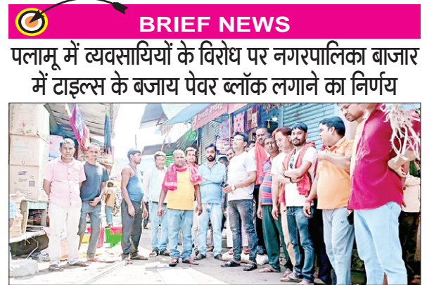
BRIEF NEWS पलामू में व्यवसायियों के विरोध पर नगरपालिका बाजार में टाइल्स के बजाय पेवर ब्लॉक लगाने का निर्णय

महिला समूहों ने कपड़े के थैले बनाने का काम शुरू भी कर दिया है। लेकिन उनको औपचारिक मार्केटिंग प्लेटफार्म उपलब्ध नहीं है। इसे सहज सुगम बनाने के लिए नगर परिषद ने अपने निगरानी में झोला बैंक की स्थापना करेगा। झोला रैली में नगर मिशन प्रबंधक, नगर प्रबंधक, सीआरपीएन, कार्यालय के कुछ कर्मियों के अलावा अन्य लोगों ने हिस्सा लिया।