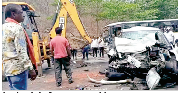
ट्रेलर के धक्के से क्षतिग्रस्त वाहन।