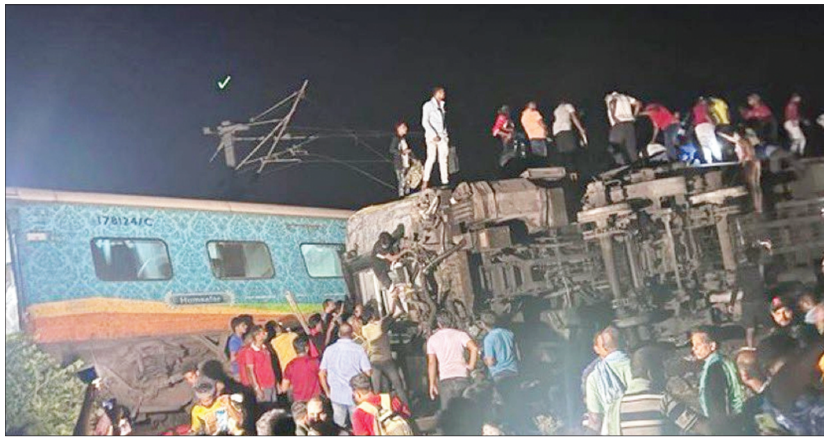
बालासोर जिले में बहनागा रेलवे स्टेशन के पास दुर्घटनाग्रस्त कोरोमंडल एक्सप्रेस ट्रेन व राहत-बचाव कार्य में जुटे लोग