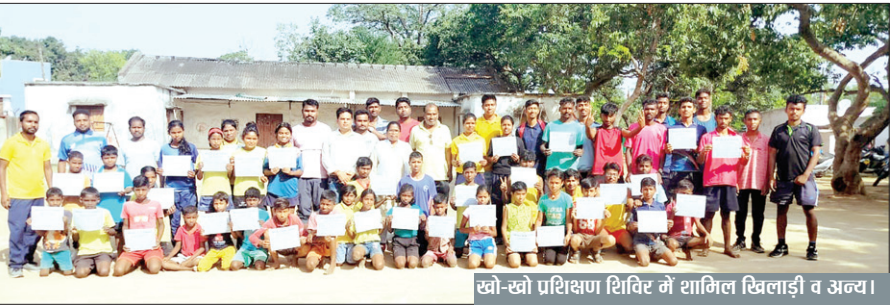
खो-खो प्रशिक्षण शिविर में शामिल खिलाड़ी व अन्य।

PHOTON NEWS RANCHI : जिला खो-खो एसोसिएशन के तत्वावधान में आयोजित 15 दिवसीय निःशुल्क ग्रीष्मकालीन बालक-बालिका खो-खो प्रशिक्षण शिविर शुक्रवार को संपन्न हो गया। प्रशिक्षण शिविर धुवाँ के सेक्टर दो स्थित लीची बागान में आयोजित किया गया था, जिसमें पूरे रांची जिले से लगभग 80 बालक - बालिकाओं को खो-खो खेल का बावकी से अभ्यास कराया गया। सर्वप्रथम सभी खिलाड़ियों को जनरल वार्मअप के बाद खेल से संबंधित स्पेसिफिक व्यायाम,