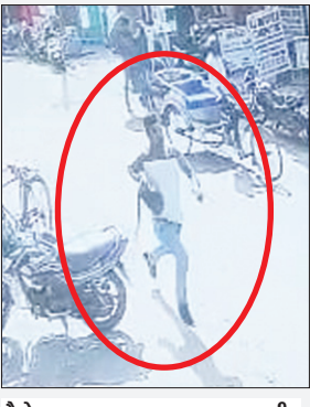
पैसे लूटकर भागता पहला अपराधी।