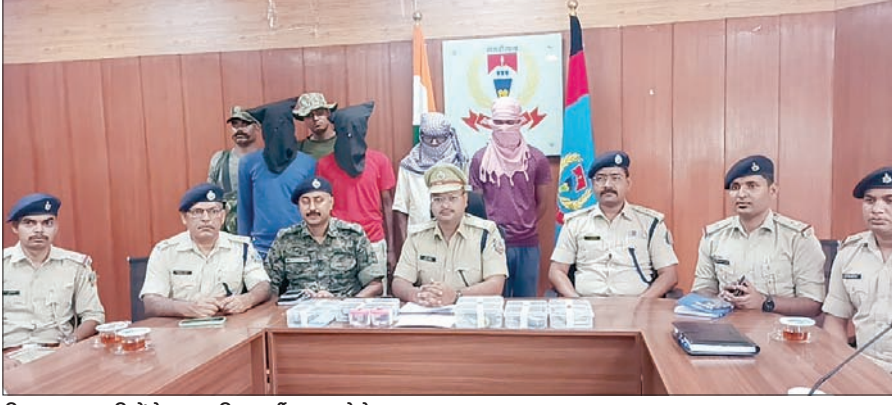
गिरफ्तार उग्रवादियों के साथ पुलिसकर्मी।