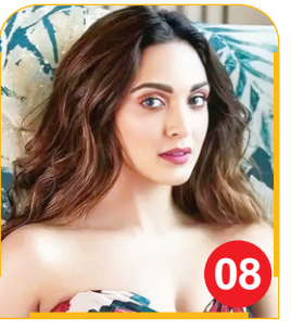
सत्यप्रेम से कार्तिक और कियारा की...