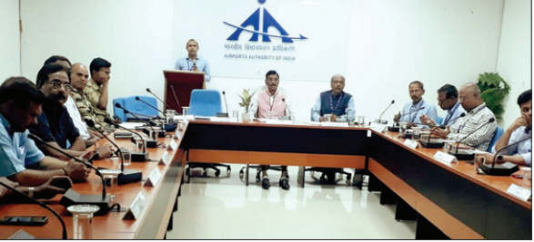
एयरपोर्ट सलाहकार समिति की बैठक में शामिल संजय सेठ व अन्य।