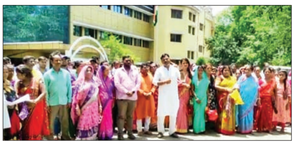
उपायुक्त कार्यालय परिसर में ककरीपाड़ा के लोग

PHOTON NEWS JAMSHEDPUR: गोविंदपुर थाना अंतर्गत ककरीपाड़ा से कल जिला प्रशासन के द्वारा अवैध रूप से बनाए गए 8 मकानों का बुलडोजर लगाकर तोड़ दिया गया था। जबकि गांव वालों का कहना है कि हम लोग अनुसूचित जाति में आते हैं और कुछ लोगों को पास बंदोबस्ती का पट्टा दिया गया है जबकि कुछ लोगों को बंदोबस्ती पट्टा नहीं दिया गया है और प्रशासन उन्हें निर्गत भी नहीं किया है। आज ककरीपाड़ा के