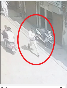
पैसे लूटकर भागता दूसरा अपराधी।

कैमरे के आधार पर अपराधियों की पहचान में जुटी है।