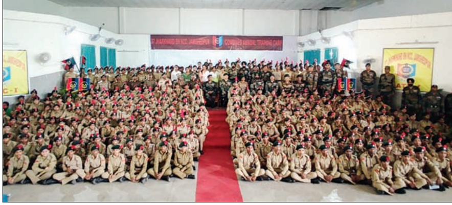
को-ऑपरेटिव कॉलेज में प्रशिक्षण शिविर के दौरान उपस्थित एनसीसी कैडेट