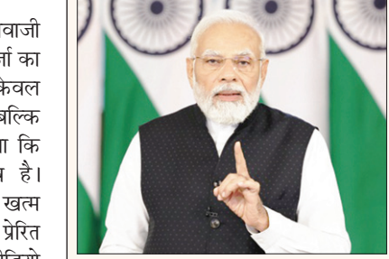
वीडियो संदेश के माध्यम से कार्यक्रम को संबोधित करते प्रधानमंत्री मोदी

प्रधानमंत्री नरेंद्र मोदी ने छत्रपति शिवाजी महाराज के जीवन को प्रेरणा और ऊर्जा का स्रोत बताया और कहा कि उन्होंने न केवल आक्रमणकारियों का मुकाबला किया बल्कि जनता में भी यह विश्वास पैदा किया कि स्वयं का राज (स्वशासन) संभव है। उन्होंने गुलामी की मानसिकता को खत्म कर लोगों को राष्ट्र निर्माण के लिए प्रेरित किया। प्रधानमंत्री शुक्रवार को वीडियो संदेश के माध्यम से छत्रपति शिवाजी महाराज के राज्याभिषेक दिवस की 350वीं वर्षगांठ को संबोधित करते हुए अपने विचार रख रहे थे। नागरिकों को प्रेरित और आत्मविश्वासी बनाए रखने की नेताओं की जिम्मेदारी को रेखांकित करते हुए,