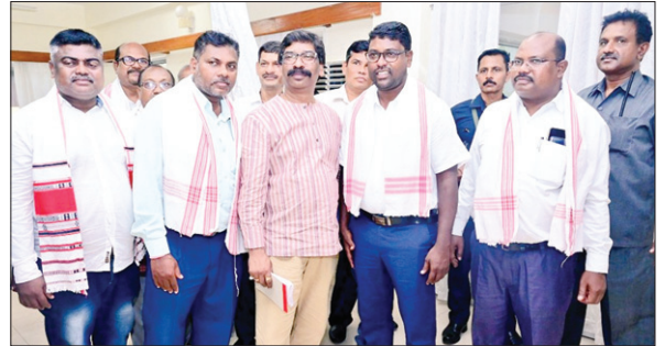
सीएम हेमंत सोरेन के साथ बातचीत करता प्रतिनिधिमंडल