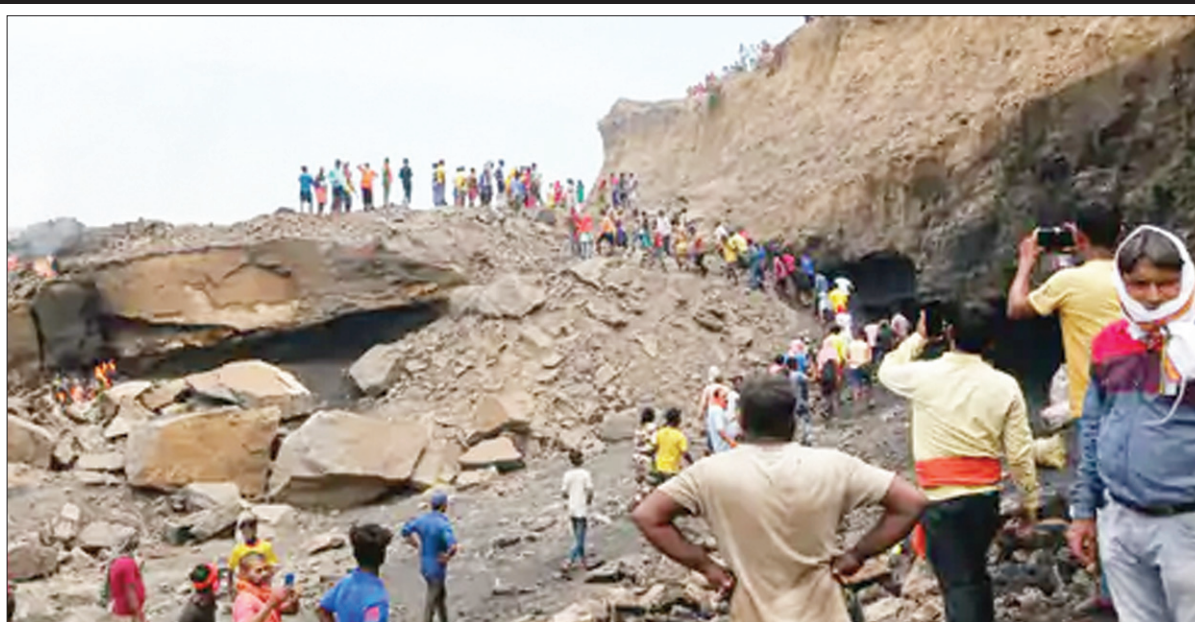
धनबाद के झरिया में अवैध खनन के दौरान चाल धंसने से तीन लोगों की मौत के बाद घटनास्थल पर जुटी भीड़

कई महीनों से हो रहा है अवैध खनन : बताया जा रहा है कि यहां कई महीनों से अवैध खनन जारी है। इस पर ना आउटसोर्सिंग कंपनी का ध्यान है, ना ही