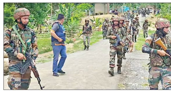
हिंसा के बाद खोकेन गांव में तैनात सुरक्षाबल

मणिपुर में कुकी और मैतेई समुदाय के बीच 3 मई से चली आ रही हिंसा थम नहीं रही है। शुक्रवार को राजधानी इम्फाल से लगे कुकी बहुल खोकेन गांव में अलग-अलग वारदात में तीन लोगों की मौत हो गई। सीबीआई ने मणिपुर हिंसा के संबंध में 6 केस दर्ज किए। जांच के लिए एसआईटी बनाई है, इसमें 10 सदस्य हैं। बोते 24 घंटों में मणिपुर के इम्फाल ईस्ट, कार्काचिंग, टैम्पोपाल और बिष्णुपुर जिलों में 57 हथियार, 1,588 गोला-बारूद और 23 बम बरामद किए हुए हैं। हिंसा के बाद से अब तक राज्य में कुल 953 हथियार,