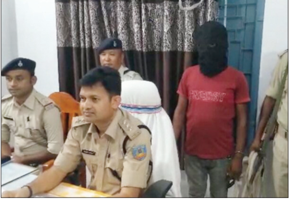
गिरफ्तार आरोपी व जानकारी देती पुलिस।