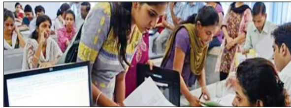
पहले राउंड की काउंसिलिंग

PHOTON NEWS JAMSHEDPUR: झारखंड संयुक्त प्रवेश प्रतियोगिता परीक्षा पर्यट (जेसीईसीईबी) ने जेईई मेन की स्टेट मेरिट लिस्ट के आधार पर राज्य के इंजीनियरिंग संस्थानों में सत्र 2023-24 में प्रवेश के लिए सेकेंड काउंसिलिंग की तिथि जारी कर दी है। इंजीनियरिंग संस्थानों में बीई एवं बीटेक कोर्स के लिए आनलाइन काउंसिलिंग होगी। आवेदन के लिए जेसीईसीईबी की वेबसाइट https://jceceb.jharkhand.gov.in पर जाना होगा। आवेदन की प्रक्रिया पूरी होने के बाद इसमें करेक्शन का भी मौका मिलेगा। विदित हो कि राज्य इंजीनियरिंग कॉलेज में एआईसीटीई से मान्यता प्राप्त कुल 4898 सीट है। बीआइटी सिंदरी में 680 सीट पर इस काउंसिलिंग के जरिए नामांकन होगा।