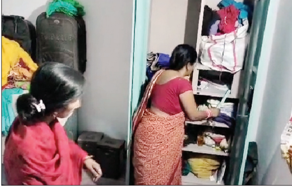
अलमारी देखती महिला