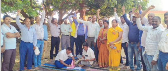
बैठक के बाद विरोध प्रदर्शन करते पारा शिक्षक।