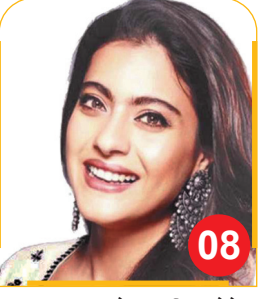
द ट्रायल में दर्शक मेरे किरदार से नफरत करेंगे