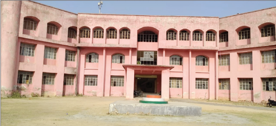
चौक, मंदिर आदि के आसपास की भूमि की भी बंदोबस्ती कर

झारखंड का सबसे बड़ा भूमि घोटाला हुसैनबाद अनुमंडल क्षेत्र में उभरकर सामने आया है। यहां एक ही दिन में 56 साल पूर्व का मोटेशन कर 56 साल की लगान रसीद काटने का मामला भी सामने आया है। जिले के हुसैनबाद अनुमंडल क्षेत्र की हजारों एकड़ गैर मजरूआ भूमि जमींदारों, कर्मचारियों, अधिकारियों के अलावा सफेदपोश लोगों के नाम बंदोबस्त कर दी गई है। सरकारी कार्यालयों, चारागाहों, निकसा,