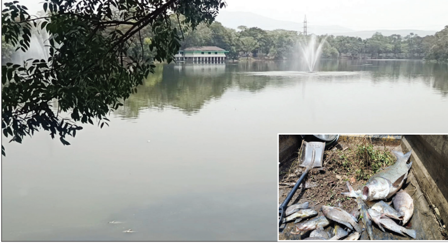
जुबिली पार्क का जयंती सरोवर व इनसेट में मृत मछलियां

PHOTON NEWS JAMSHEDPUR: जुबिली पार्क के जयंती सरोवर में शुक्रवार की सुबह हजारों मछलियां मरी हुई पाई गईं। जिससे पूरे शहर में हड़कंप मचा हुआ है। हालांकि, मरने का अभी तक स्पष्ट कारण सामने नहीं आ सका है। दरअसल, रोजाना की तरह सुबह में लोग टहलने के लिए पहुंचे थे। तभी जयंती सरोवर से तेज दुर्गंध आने लगी। इस दौरान लोगों ने जाकर देखा तो भारी मात्रा में मछलियां मरी हुई थी, जिसे लेकर लोग काफी चिंतित दिखे। वहीं, ड्यूटी पर तैनात सुरक्षाकर्मियों ने इसकी जानकारी संबंधित पदाधिकारियों को दी। इसके बाद मरी हुई मछलियों को बाहर निकालने का कार्य शुरू हुआ। इसमें लगभग 30 कर्मचारियों को लगाया गया है। सुबह आठ बजे से ही सरोवर की सफाई चल रही है। कर्मचारियों का कहना है कि