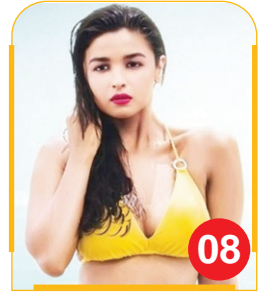
विलेन के रूप में नजर आएगी आलिया