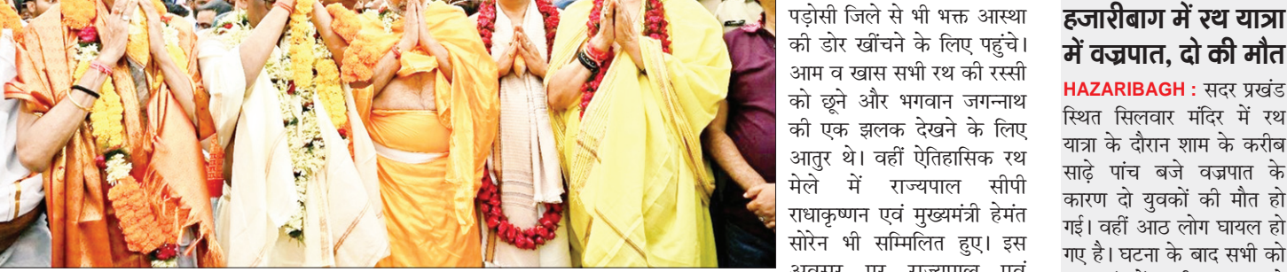
रांची में निकली भगवान जगन्नाथ की रथ यात्रा में शामिल राज्यपाल, सीएम हेमंत सोरेन न अन्य

रांची में राज्यपाल व सीएम समेत हजारों भक्तों ने खीचीं भक्ति की डोर