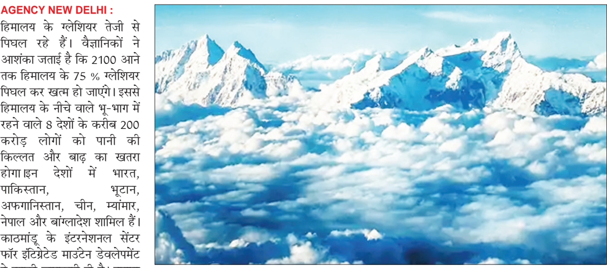
3500 किलोमीटर में फैला हिमालय 8 देशों को कवर करता है। (फाइल फोटो)

AGENCY NEW DELHI : हिमालय के ग्लेशियर तेजी से पिघल रहे हैं। वैज्ञानिकों ने आशंका जताई है कि 2100 आने तक हिमालय के 75% ग्लेशियर पिघल कर खत्म हो जाएंगे। इससे हिमालय के नीचे वाले भू-भाग में रहने वाले 8 देशों के करीब 200 करोड़ लोगों को पानी की किल्लत और बाढ़ का खतरा होगा इन देशों में भारत, पाकिस्तान, भूटान, अफगानिस्तान, चीन, म्यांमार, नेपाल और बांग्लादेश शामिल हैं। काठमांडू के इंटरनेशनल सेंटर फॉर इंटीग्रेटेड माउंटेन डेवलपमेंट ने इसकी जानकारी दी है। बताया है कि आने वाले दिनों में एचलांच की घटनाएं भी तेजी से बढ़ेंगी। अलजजीरा के मुताबिक ग्लेशियर पिघलने का असर उन लोगों पर होगा जिन्होंने ग्लोबल वॉर्मिंग की ही नहीं। रिपोर्ट में बताया गया है कि हिमालय 2010 के बाद से 65% तेजी से पिघल रहा है। अगर दुनिया का तापमान 1.5 डिग्री सेल्सियस से 2 डिग्री सेल्सियस तक बढ़ेगा तो ग्लेशियर 2100 तक 30% से 50% की तेजी से पिघलेंगे। हालांकि अभी के अनुमान के मुताबिक तापमान 3 डिग्री तक बढ़ने की आशंका है ऐसे में ग्लेशियर 75% तेजी से पिघलेंगे। रिपोर्ट में बताया गया है कि इससे भारत की गंगा और घाघर नदी समेत 12 नदियां खतरे में आ सकती हैं। जो हिमालय के ग्लेशियर से निकलती हैं।