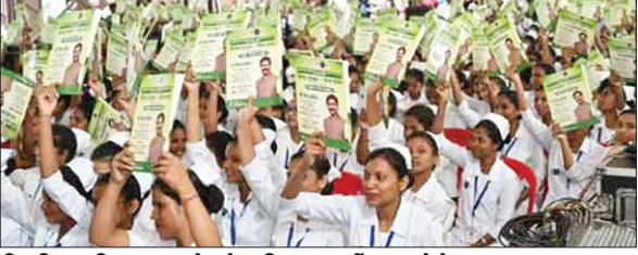
नियुक्ति पत्र वितरण समारोह में छात्रिला अग्रणी।

मुख्यमंत्री हेमंत सोरेन ने बुधवार को प्रेसा फाउंडेशन द्वारा संचालित आईटीआई कौशल विकास कॉलेज व नर्सिंग एवं कल्याण गुरुकुल के लगभग 500 विद्यार्थियों को विभिन्न संस्थाओं और संस्थानों के लिए नियुक्ति पत्र प्रदान किए। नगर टोली स्थित आईटीआई कौशल कॉलेज परिसर में आयोजित कार्यक्रम में मुख्यमंत्री ने कहा कि अब पढ़े-लिखे युवा आसानी से दवा दुकान खोल सकेंगे। इसके लिए उनका फार्मासिस्ट होना जरूरी नहीं है। यह उस समय की नीति और कानून है, जब हमारे पूर्वज जड़ी-बुटी से दवा बनाते थे। आज जरूरत है कि राज्य में दवा की कमी दूर हो और सस्ती दरों पर दवा मिल सके।