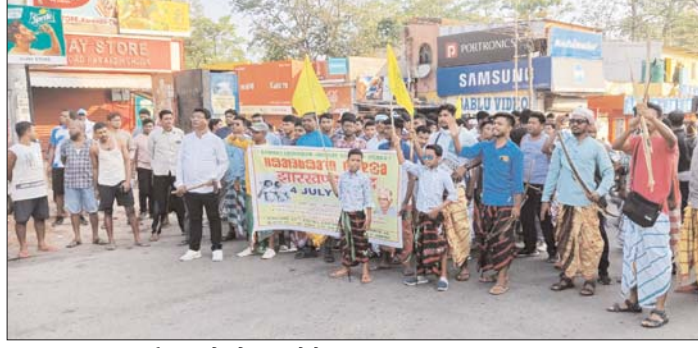
एनएच 33 पर प्रदर्शन करते लोग

ओलाचिकी हुल बैसी की ओर से अपने 4 सूत्री मांगों के आलोक में मंगलवार को बुलाए गए बंद का जमशेदपुर के आस पास के क्षेत्रों में व्यापक असर देखने को मिल रहा है। सुबह से ही बंद समर्थक एनएच 33 श्री, करनीडीह, गम्हरिया मानगो आदि क्षेत्रों में निकले और दुकानों से लेकर यातायात व्यवस्था तक को रोक दिया। मानगो चौक पर महिला प्रदर्शनी कारियों ने डिमने से साकची की ओर से जाने वाले मुख्य सड़क को जाम कर दिया। जिसकी वजह से यहां जाम लग गया और गाड़ियों का लंबा काफिला सड़क के दोनों ओर पर देखने को मिला। वाहन रुक जाने की वजह से लोगों को खासा परेशानी हुई उन्हें पैदल ही शहर की ओर रुख करना पड़ा। यही हाल करनडीह, परसुडीह, गम्हरिया, पारडीह आदि क्षेत्रों में देखने को मिला। हालांकि शहर में बंद का आंशिक असर देखने को मिला और