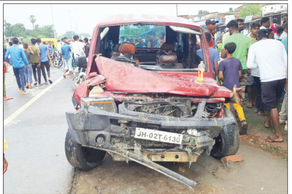
हादसे के बाद कुएं से निकाली गयी गाड़ी

इस हादसे में एक साल छह महीने की बच्ची की भी मौत हो गयी है। घटना के तुरंत बाद आसपास के लोग जमा हुए और तुरंत कार से लोगों को निकालने