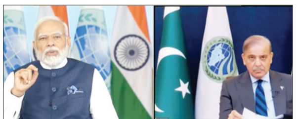
एससीओ के वर्चुअल शिखर सम्मेलन में प्रधानमंत्री मोदी