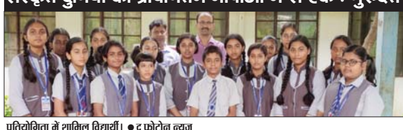
प्रतियोगिता में शामिल विद्यार्थी। • द फोटोन न्यूज