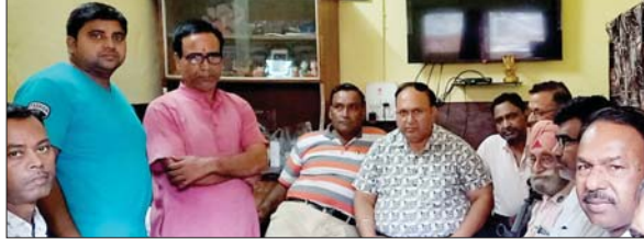
बैठक में उपस्थित समिति के लोग।

यज्ञ के बाद सोमेट से हनुमान जी की मूर्ति बनाकर पुजा शुरू की गई। जीविका के लिए मंदिर परिसर के दक्षिण और उत्तर दिशा की ओर चार-चार दुकान बनाकर किराये पर दिया गया। करीब 30 वर्ष पूर्व खोपड़िया बाबा का देहांत होने पर तथ्यांकित कुछ लोग परिसर में ही उनकी समाधि बनाने का प्रयास किए। लेकिन तत्कालिन थाना प्रभारी और बाजार के