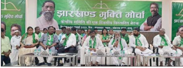
बैठक में शामिल शिवू सोरेन, मुख्यमंत्री व अन्य कार्यकर्ता।