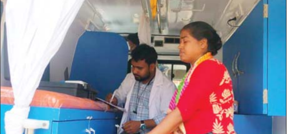
शिविर में स्वास्थ्य जांच कराती महिला।

स्वास्थ्य समृद्धि वाहन परियोजना को और भी प्रभावी बनाने एवं ज्यादा से ज्यादा लोगों तक इसकी जानकारी पहुंचाने के मद्देनजर टीम के द्वारा आसपास के घरों का भ्रमण कर लोगों को टेलीमैडिसिन सहित सरकारी