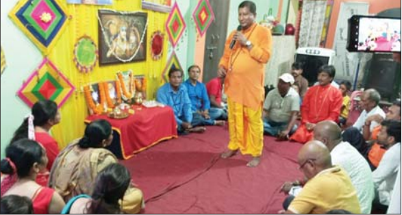
भजन कीर्तन में शामिल श्रोता।