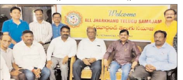
जयंती मनाते लोग