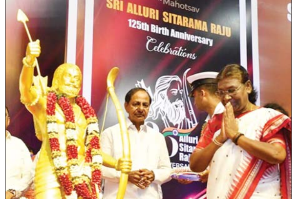
अल्लूरि सीताराम राजू के 125वें जन्मोत्सव पर उपस्थित राष्ट्रपति।

राष्ट्रपति ने हैदराबाद में अल्लूरि सीताराम राजू के 125वें जन्मोत्सव वर्ष के समापन समारोह को संबोधित करते हुए कहा कि अल्लूरि सीताराम राजू का जीवन चरित्र, जाति और वर्ग पर आधारित भेदभाव से मुक्त रहकर पूरे समाज और देश को एकजुट करने की मिसाल है। उन्होंने कहा कि अल्लूरि सीताराम राजू को जनजातीय समाज ने पूरी तरह से अपना लिया था और उन्होंने जनजातीय समाज के सुख-दुख को अपना सुख-दुख बना लिया था। उन्हें एक आदिवासी योद्धा के रूप में याद किया जा रहा है और