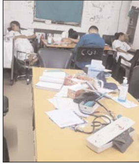
अस्पताल में सोते कर्मों

स्वास्थ्य मंत्री से मामले हस्तक्षेप करने की मांग