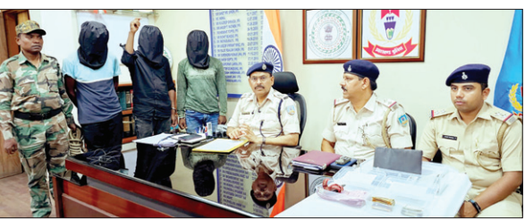
प्रेस कॉन्फ्रेंस कर गिरफ्तार आरोपियों की जानकारी देते बागीणी एसपी।