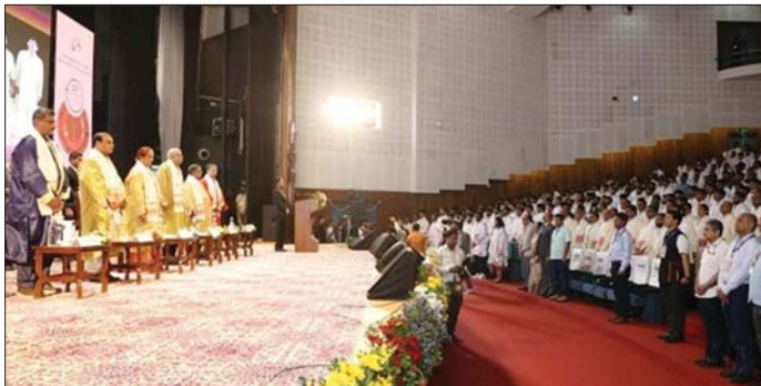
25वें दीक्षांत समारोह में शामिल हुए उपराष्ट्रपति जगदीप धनखड़ व अन्य।

उपराष्ट्रपति धनखड़ मंगलवार को आईआईटी गुवाहाटी के 25वें दीक्षांत समारोह को संबोधित कर रहे थे। उपराष्ट्रपति ने इस बात पर जोर दिया कि राज्य के नीति निर्देशक तत्व (डीपीएसपी) देश के शासन का मौलिक दायरा है। उन्हें नियमों में बांधना देश का कर्तव्य है। उन्होंने कहा कि