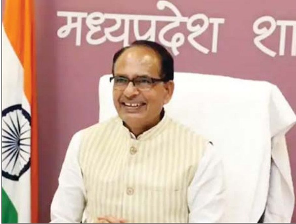
मुख्यमंत्री शिवराज सिंह चौहान की फाईल फोटो।

मामला मप्र के सीधी जिले का बताया जा रहा है। घटना को लेकर मुख्यमंत्री शिवराज सिंह चौहान ने जांच कर कार्रवाई के निर्देश दे दिए हैं। उन्होंने मंगलवार को ट्वीट कर कहा कि 'मेरे संज्ञान में सीधी जिले का एक वायरल वीडियो आया है। मैंने प्रशासन को निर्देश दिए हैं कि अपराधी को गिरफ्तार कर