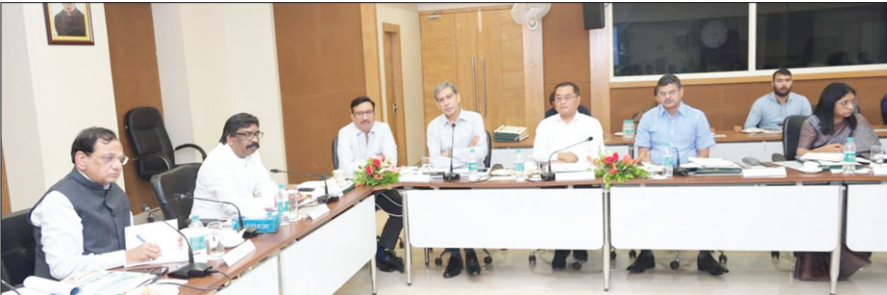
नीति आयोग की टीम के साथ बैठक करते सीएम हेमंत सोरेन व अन्य • फोटो न्यूज

झारखंड सरकार के साथ नीति आयोग की टीम ने बैठक कर केंद्रीय योजनाओं का हाल जाना। साथ ही योजनाओं के क्रियान्वयन में आने वाली समस्याओं पर भी चर्चा की। इस दौरान सीएम हेमंत सोरेन ने कहा कि समय पर योजना मद की राशि नहीं मिलने से राज्य का विकास कार्य प्रभावित होता है। जिसका नतीजा यह होता है कि योजना का लक्ष्य ग्राउंड लेवल तक नहीं पहुंच पाता है। इसलिए विकास कार्यों को गति देने के लिए योजना मद में मिलने