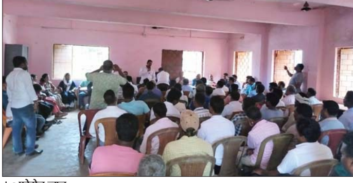
। • फोटोन न्यूज

बैठक में मुख्यतः विगत दिनों सम्पन्न जगन्नाथपुर विधानसभा स्तरीय कार्यकर्ता सम्मेलन कार्यक्रम की समीक्षा करने के अलावा जिला में चल रहे सदस्यता अभियान तथा प्रखंड व पंचायत स्तर पर पार्टी के सांगठनिक स्थिति की समीक्षा के साथ ही पंचायत स्तर पर संगठन विस्तार पर