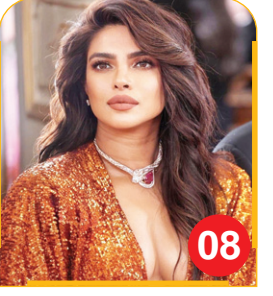
पुराना विडियो देख प्रियंका को कर...