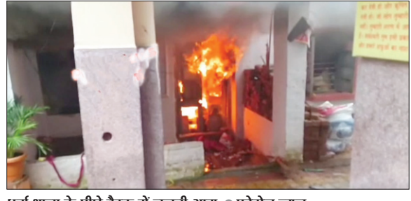
धुर्वा थाना के पीछे बैरक में जलती आग

रांची के धुर्वा थाना के पीछे बैरक में बुधवार की सुबह भयंकर आग लगी। जिससे बैरक में रहने वाले पुलिसकर्मी जलने से बचे। बैरक में मौजूद पुलिसकर्मियों ने किसी तरफ से भाग कर अपनी जान बचायी। जबकि बैरक में पुलिसकर्मियों के वर्दी जूते सहित अन्य कागजात जलकर खाक हो गए। बैरक में रहने वाले पुलिसकर्मियों ने बताया कि बुधवार की सुबह 7:00 बजे के लगभग बैरक में बिजली के तार से स्पार्क होने के बाद आग पकड़ ली। जो धीरे-धीरे भयंकर रूप से पूरे बैरक में फैल गया। बैरक में थाने के वाहनों के लिए