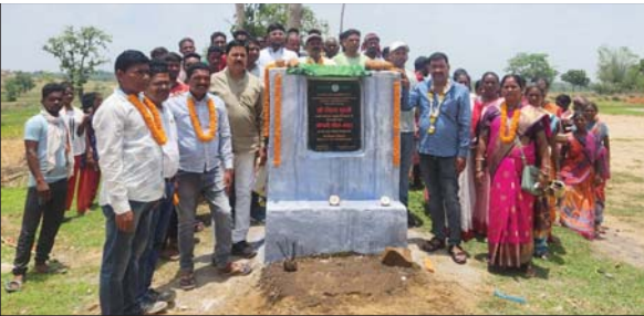
शिलान्यास के अवसर पर शुरु विधायक व ग्रामीण ।

उन्होंने कहा कि विधानसभा भ्रमण के दौरान स्थानीय जनता और जामुमो कार्यकर्ताओं ने मझगांव विधानसभा क्षेत्र के जरूरी सड़कों का निर्माण करने की मांग की थी। ताकि बरसात के दिनों में आम जनता को आने जाने में परेशानी का सामना न करना पड़े।