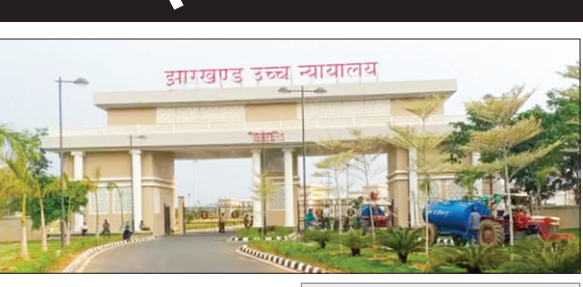
झारखण्ड उच्च न्यायालय