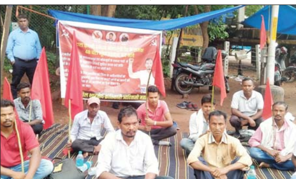
भूख हड़ताल पर बैठे यूनियन के सदस्य ।

नोवामुंडी में वर्षों से लौह अयस्क खनन कार्य कर रही है। लेकिन आसपास के गांवों का आज वर्षों बाद भी पूर्ण विकास नहीं किया गया है। इसी तरह जगन्नाथपुर प्रखंड के रामतीर्थ स्थित नदी बैतरणी नदी से लौह अयस्क धोने के लिए पानी ले जाकर अपना बिजनेस चलाते रहे। लेकिन जगन्नाथपुर प्रखंड में किसी तरह का विकास कार्य