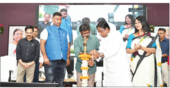
मुख्यमंत्री सार्थी योजना का शुभारंभ करते सीएम हेमंत सोरेन व अन्वय।

सीएम हेमंत सोरेन मुख्यमंत्री सार्थी योजना के तहत बिरसा केंद्र की शुरुआत की। मौके पर उन्होंने पांच सेंटर में प्रशिक्षण ले रहे युवाओं से बातचीत की। इस योजना के तहत विभिन्न सेंटर्स में प्रशिक्षण ले रहे ट्रेनर्स को रोजगार प्रोत्साहन और परिवहन भत्ता दिया गया। सीएम ने ऑनलाइन माध्यम से सभी के खाते में पैसे हस्तांतरित किए। प्रशिक्षणार्थियों को आगे भी डीबीटी के माध्यम से पैसे दिए जाएंगे। आज सीएम हेमंत सोरेन ने 1039 लाभुकों के खाते में 13, 03, 500 रुपये बतौर प्रोत्साहन