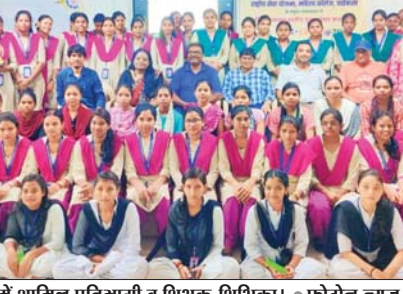
संवाद कार्यक्रम में शामिल प्रतिभागी व शिक्षक-शिक्षिका। • फोटोन न्यूज

इस दौरान विद्यार्थियों ने देश को विकसित भारत के रूप में आगे बढ़ाने का संकल्प, गुलामी की मानसिकता को कम करना, भारत की विरासत और परंपरा पर गर्व करना, एकता और एकजुटता की ताकत, राष्ट्र के प्रति नागरिकों