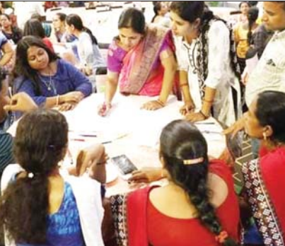
कार्यशाला में उपस्थित लोग।

राउरकेला महानगर निगम, झारसुगुड़ा, बीरमिपुर, राजगांगपुर, सुंदरगढ़ नगर निकायों और राउरकेला महानगर निगम कर्मचारियों द्वारा आयोजित कार्यशाला में सीवेज उपचार केंद्रों के प्रबंधन के प्रभारी मिशन शक्ति