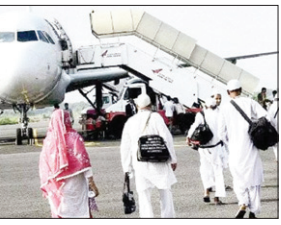
और हज कमेटी ऑफ इंडिया आदि से भी कोई गिला-शिकवा नहीं रहा। हज यात्रा-2023 के दौरान भारत से जाने वाले 155 हज यात्रियों की बीमारी आदि के कारणों से मौत होने की खबरें हैं। मरणे वालों में दिल्ली से जाने वाली 2 महिलाएं भी शामिल हैं। हज यात्रा के दौरान मरणे वालों में 130 हज कमेटी ऑफ इंडिया के जरिए जाने वाले यात्री हैं, जबकि दीगर 25 प्राइवेट टूर ऑपरेटर्स के माध्यम से जाने वाले यात्री शामिल हैं। 39 यात्री हज की अदायगी से पहले ही इंतकाल कर गए, जबकि

दिल्ली के इंदिरा गांधी अंतरराष्ट्रीय हवाई अड्डे से जाने वाले भारतीय हज यात्रियों की बीमारी आदि के कारणों से मौत होने की खबरें हैं। मरणे वालों में दिल्ली से जाने वाली 2 महिलाएं भी शामिल हैं। हज यात्रा के दौरान मरणे वालों में 130 हज कमेटी ऑफ इंडिया के जरिए जाने वाले यात्री हैं, जबकि दीगर 25 प्राइवेट टूर ऑपरेटर्स के माध्यम से जाने वाले यात्री शामिल हैं। 39 यात्री हज की अदायगी से पहले ही इंतकाल कर गए, जबकि