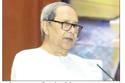
नवीन पटनायक की फाईल फोटो।

मुख्यमंत्री नवीन पटनायक देश के दूसरे सबसे लंबे समय तक सेवा करने वाले मुख्यमंत्री का दर्जा हासिल करने जा रहे हैं। ओडिशा के मुख्यमंत्री नवीन पटनायक ने पश्चिम बंगाल के पूर्व मुख्यमंत्री ज्योति बसु का रिकॉर्ड तोड़कर देश के दूसरे सबसे लंबे समय तक मुख्यमंत्री के तौर पर सेवा करने वाले राजनेता बन गए हैं। 5 मार्च 2000 को नवीन पटनायक ने पहली बार ओडिशा के मुख्यमंत्री का पद संभाला। लगातार 5 बार मुख्यमंत्री रह चुके नवीन 23 साल 138 दिन से मुख्यमंत्री पद पर कार्यरत हैं। वहीं पश्चिम बंगाल में सीपीएम की 34 साल की सरकार में ज्योति बसु 23 साल और 138 दिनों तक पश्चिम बंगाल के मुख्यमंत्री रहे। 22 जुलाई को नवीन