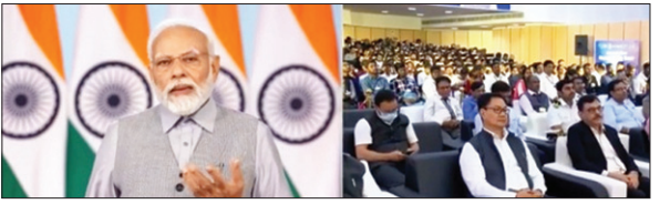
युवाओं को वीडियो कांफ्रेंसिंग के माध्यम से संबोधित करते पीएम।

प्रधानमंत्री नरेंद्र मोदी ने भ्रष्टाचार को लेकर पिछली यूपीए सरकार पर निशाना साधते हुए कहा कि आज भारत उन देशों में से एक है जहां का बैंकिंग सेक्टर सबसे मजबूत माना जाता है, हालांकि नौ साल पहले ऐसी स्थिति नहीं थी। उन्होंने कहा कि पिछले नौ साल में उनकी सरकार द्वारा इस दिशा में सुधारवाचक उपाय करने से यह स्थिति बनी है। प्रधानमंत्री शनिवार को रोजगार मेले में विभिन्न सरकारी विभागों में नवनि्युक्त 70,000 से अधिक युवाओं को वीडियो कांफ्रेंसिंग के माध्यम से नियुक्ति पत्र सौंपने के बाद संबोधित कर रहे थे। प्रधानमंत्री ने