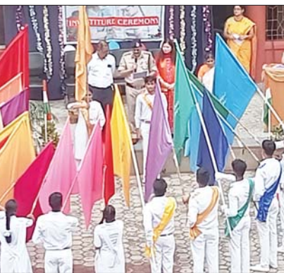
समारोह में शपथ दिलाते कमांडेंट व उपस्थित छात्र-छात्राएं।