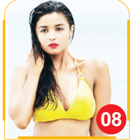
मैं आलिया के साथ फुटबॉल खेलने...