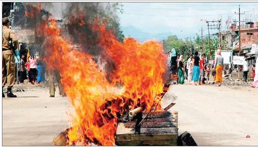
इफाल के घाटी इलाके में सैकड़ों महिलाओं ने टायर जलाकर और सड़क अवरोध कर विरोध प्रदर्शन किया।