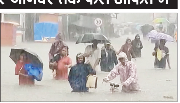
महाराष्ट्र में भारी बारिश के बीच पानी में आधे डूबकर जाते लोग।

कई घंटों की बारिश से गुजरात और महाराष्ट्र में बाढ़ जैसे हालात पैदा हो गए हैं। नदियां-नाले ऊफान पर हैं और सड़कों पर सैलाब है। कहीं भैंस पानी में बह गईं तो कहीं इंसान। वहीं गाड़ियां बाढ़ के पानी में खिलौनों की तरह बह रही हैं। जूनागढ़ शहर में भारी बारिश के चलते हालत बिगड़ते जा रहे हैं। तीन घंटे की बारिश से दोलतपारा, सबलपुर, राज लक्ष्मी पार्क और कालवा नदी में जलस्तर बढ़ गया है। यवतमाल में लोगों को बचाने को मांगी गई वायु सेना की मदद