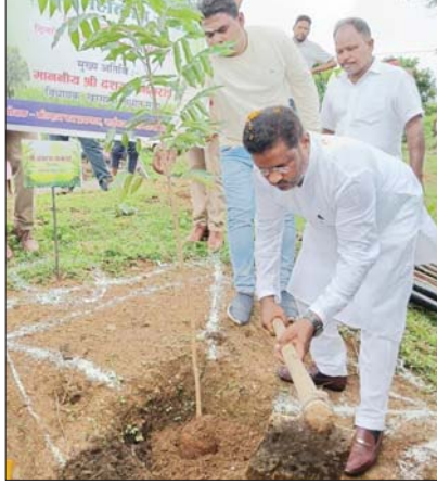
पौधा रोपण करते अतिथि।