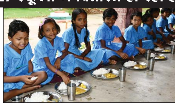
पौष्टिक भोजन करते बच्चे। • फोटोन न्यूज

राउरकेला स्टील प्लांट के सीएएसआर के तहत शुरू हुई इस योजना का उद्देश्य भूख को खत्म करना, भूख और गरीबी के कारण