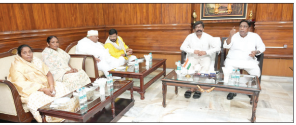
यूपीए विधायक दल की बैठक में शामिल सीएम हेमंत सोरेन व अन्य।

PHOTON NEWS RANCHI : झारखंड विधानसभा के मानसून सत्र को लेकर यूपीए विधायक दल की बैठक मुख्यमंत्री सह विधायक दल के नेता हेमंत सोरेन के नेतृत्व में गुरुवार को मुख्यमंत्री हाउस में हुई। बैठक में सत्र ठीक से चले, इसको लेकर चर्चा हुई। साथ ही विपक्ष से सहयोग की अपेक्षा की गयी। कहा गया कि विपक्ष के हर सवाल का जवाब सत्ता पक्ष पूरी मजबूती से देगा। बैठक के बाद पत्रकारों से बातचीत करते हुए