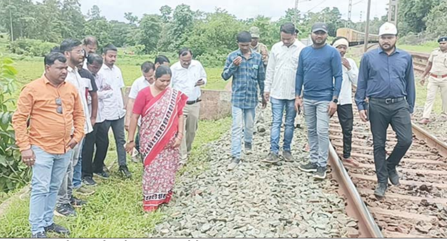
जांच पड़ताल करती सांसद गीता कोड़ा व अन्य।

बता दें आज से करीब 12 वर्षों पूर्व रेलवे लाइन के विस्तारिकरण के दौरान रेलवे विभाग द्वारा पदापहाड़ एवं सरखिल गांवों के दर्जनों ग्रामीणों की जमीन रेलवे द्वारा अधिग्रहण किया गया था। जिसमें से करीब 14 ग्रामीणों को रेलवे विभाग में नौकरी और भूमि