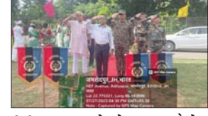
विभिन्न इकायों के 178 कैडेट शामिल थे। शिविर का मुख्य मकसद सभी कैडेट्स को बुनियादी सैन्य प्रशिक्षण देना, एक जिम्मेदार नागरिक के रूप में तैयार करना और आईजीवीबीसी के बेहतर कैडेटों का चुनाव करना था। इस शिविर में विभिन्न सांस्कृतिक प्रतियोगिताओं के साथ साथ राइफल शूटिंग, परेड, मैप रीडिंग, जैसे विभिन्न सैन्य प्रशिक्षण किया गया जिससे कैडेट्स