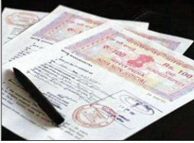
की रजिस्ट्री हुई। इसमें करीब 20 प्लैट शामिल हैं।

PHOTON NEWS RANCHI : आज से रात्र्यभर में शहरी क्षेत्र की जमीन व प्लैट 10 प्रतिशत तक महंगे हो जाएंगे। बढ़े हुए मूल्य पर ही रजिस्ट्री होगी। इससे पूर्व 31 जुलाई सोमवार को जिले के रजिस्ट्री आफिसों में बंपर रजिस्ट्री हुई। कार्यालय खुलने के साथ ही जमीन-प्लैट के खरीददार व बेचने वालों की भीड़ हो गई। रात आठ बजे तक आफिस में कामकाज चलता रहा। लालगंभीर सभी रजिस्ट्री आफिसों का अक्वाइटेमेंट स्लाट फुल रहा। जिले के कचहरी चौक स्थित मुख्य रजिस्ट्री आफिस का 130 का स्लाट था। पूरा स्लाट फुल हो