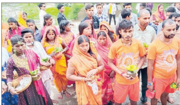
मा कौलेश्वरी जल यात्रा में जल चढ़ते श्रद्धालु

हंटरगंज (चतरा) प्रखंड में सावन महीने को लेकर श्रद्धालुओं ने सावन के चौथे सोमवार को मां कौलेश्वरी जल यात्रा में श्रद्धालुओं को काफी भीड़ देखने को मिला। आपको बताते चले कि हर वर्ष हंटरगंज के केदली के समीप फल्गु नदी से जल भरकर श्रद्धालु गन माता कौलेश्वरी के दरबार में शिवलिंग पर जलाभिषेक कर पुण्य के भागी बन रहे है। चौथी सोमवारी को लगभग 500 से ज्यादा सद्गालु