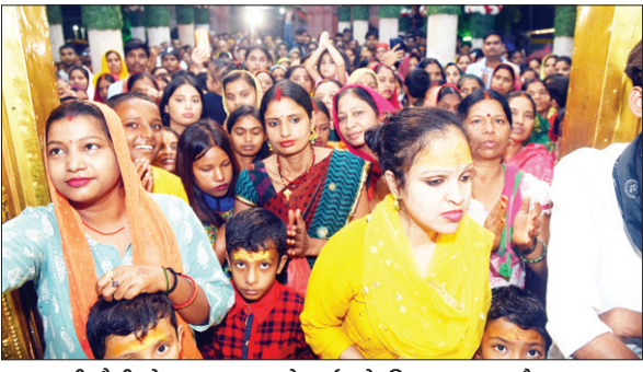
सावन की चौथी सोमवार पर बाबा के दर्शन के लिए उमड़ा जनसैलाब।

बाबा का जलामिषेक किया। संख्या में सात बजे जलामिषेक रोक कर श्रृंगार व पूजा किया गया। बेलपत्र, भांग, धतूरा, सुगंधित पुष्प आदि से दिव्य रूप से श्रृंगार किया गया। वहीं, 07.30 बजे भव्य महाआरती उतारी गई। इसके बाद पुनः दर्शन आरंभ हुआ। इसके अलावा पिस्का मोड़ विश्वनाथ