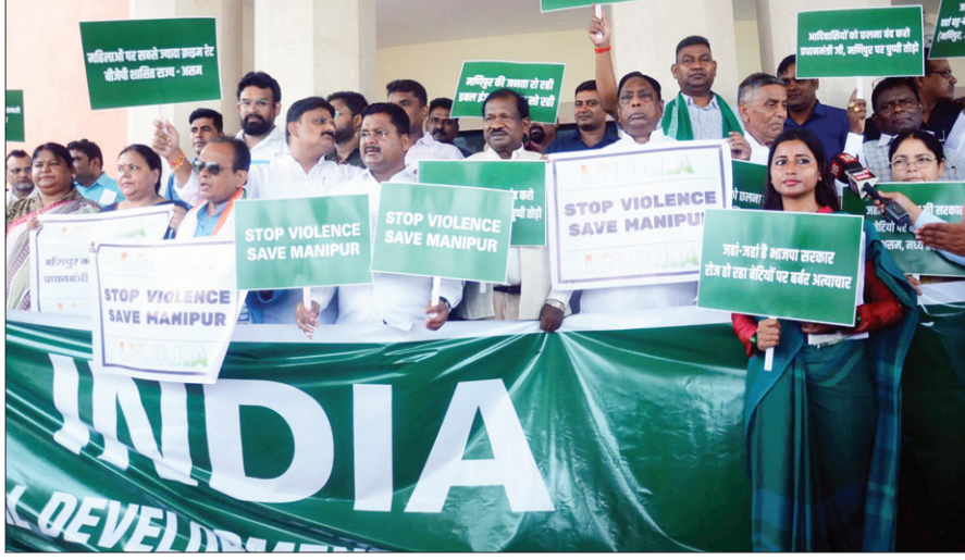
झारखंड विधानसभा के मॉनसून सत्र के दूसरे दिन सदन के बाहर हंगामा करते सत्ता पक्ष के नेता-मंत्री