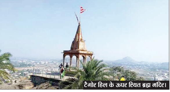
टैगोर हिल के ऊपर स्थित ब्रह्म मंदिर।

टैगोर हिल की मरम्मत व मेंटेनेंस के लिए सरकार ने स्वीकृत किए 69 लाख 30 हजार रुपये