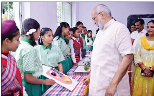
कस्तूरबा गांधी बालिका विद्यालय में छात्राओं से संवाद करते राज्यपाल।

राज्यपाल सीपी राधाकृष्णन ने सोमवार को ओरमांडी स्थित कस्तूरबा गांधी बालिका विद्यालय का भ्रमण किया। कस्तूरबा गांधी बालिका विद्यालय, ओरमांडी के परिसर में नेताजी सुभाष चंद्र बोस विद्यालय भी अवस्थित है, वर्तमान में वहां अध्ययनरत छात्राएं साथ में ही शिक्षा ग्रहण कर रही हैं। राज्यपाल ने वहां एक से कक्षा 12 तक जाकर सभी छात्राओं से संवाद किया तथा उन्हें कड़ी मेहनत एवं समर्पण के साथ पढ़ने के लिए प्रेरित किया। उन्होंने छात्राओं के रीडिंग स्किल पर भी जोर दिया। उन्होंने कहा कि कभी-कभी बच्चों में नेत्रदोष की भी समस्या होती है और वे ठीक से देख नहीं पाते हैं, जिससे उन्हें पढ़ने में असुविधा होती है। उन्होंने कहा कि समय-समय पर आई