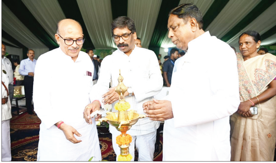
74वें राज्यव्यापी वन महोत्सव 2023 कार्यक्रम का दीप जलाकर शुभारंभ करते सीएम हेमंत सोरेन व अन्य।

झारखंड विधानसभा परिसर में आयोजित 74वें राज्यव्यापी वन महोत्सव 2023 कार्यक्रम में मुख्यमंत्री हेमंत सोरेन सम्मिलित हुए। उन्होंने कहा कि प्राकृतिक व्यवस्थाओं के साथ छेड़छाड़ जलवायु परिवर्तन का मूल कारण है। इसलिए स्वयं भी पौधे लगाएं और दूसरों को भी प्रेरित करें। मुख्यमंत्री हेमंत सोरेन ने कहा कि प्रदेश में वन महोत्सव का राज्यव्यापी कार्यक्रम चल रहा है। यह कार्यक्रम राज्य की अलग-अलग जगहों पर निरंतर आयोजित किया जा रहा है। इसी क्रम में आज हम सभी लोग झारखंड विधानसभा परिसर में पूर्व की भांति इस वर्ष भी वृक्षारोपण कार्यक्रम में उपस्थित हुए हैं। मुख्यमंत्री हेमंत सोरेन ने कहा कि वर्तमान समय में जलवायु परिवर्तन को लेकर देश और दुनिया में तेजी से चिंतन और मंथन किया जा रहा है। मुख्यमंत्री ने कहा कि कहीं न कहीं प्राकृतिक व्यवस्थाओं के साथ बड़े पैमाने पर छेड़छाड़ किया