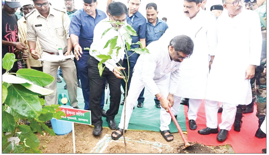
विधानसभा में आयोजित 74वें राज्यव्यापी वन महोत्सव 2023 कार्यक्रम में पौधरोपण करते सीएम हेमंत सोरेन।

हम सभी लोग एकत्रित हुए हैं। मुख्यमंत्री हेमंत सोरेन ने इस महोत्सव में उपस्थित सभी लोगों से अपील की है कि वे एक-एक पौधे अपनी ओर से जरूर लगाएं तथा उस वृक्ष को संरक्षित भी करें। मुख्यमंत्री ने कहा कि जब हम सभी लोग वृक्ष लगाएंगे, दूसरों को भी वृक्ष लगाने को