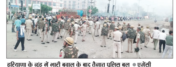
हरियाणा के नूंह में गरी बवाल के बाद तैनात पुलिस बल