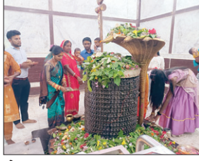
लेकर मंदिर का पट बंद कर दिया गया। फिर 1 बजे दिन श्रद्धालुओं के लिए मंदिर का पट खोल दिया गया। मंदिर खुलते ही एक बार पुनः श्रद्धालुओं की भीड़ जलाभिषेक और पूजा-पाठ के लिए जुट गई।

श्रावण मास के चौथे सोमवारी पर मां भद्रकाली मंदिर प्रांगण स्थित सहस्र शिवलिंगम मंदिर में जलाभिषेक और पूजा-पाठ के लिए शिव भक्तों की जनसैलाब उमड़ी। मंदिर में भोलेनाथ की श्रृंगार पूजन के वक्त अहले सुबह से ही श्रद्धालुओं की भीड़ जलाभिषेक और पूजा-पाठ के लिए जुटने लगी थी। यह भीड़ यहाँ लगातार 12 बजे दिन तक जुटी रही। इसी बीच भोग को