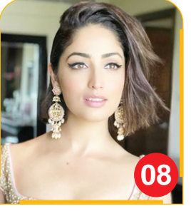
यामी गौतम की धूम धाम को ओटीटी...