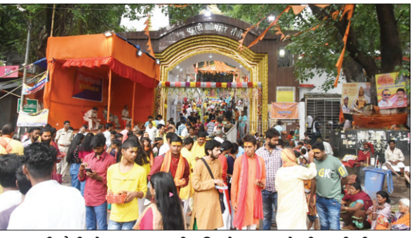
सावन की चौथी सोमवार पर पहाड़ी मंदिर में श्रद्धालुओं की उमड़ी भीड़।

PHOTON NEWS RANCHI : सावन में राजधानी शिवमय बनी हुई है। हूं और बोलबम के जयकारे गुंज रहे हैं। चौथी सोमवारी को भी जलामिषेक के लिए शिवालयों में भीड़ उमड़ी। हजारों श्रद्धालुओं ने भोलेनाथ का दर्शन-पूजन किया। ब्रह्म मुहूर्त ी मंदिरपरिंर मंकांवरिये व श्र्वालु पूजा-अर्चना के लिए जुटने लगे। दोपहर तक भीड़ देखने को मिली। पुनः संख्या आरती व श्रृंगार पूजा में श्रद्धालुओं की भीड़ हुई। सबसे ज्यादा भीड़ पहाड़ी मंदिर में देखने को मिली। यहां देर रात 2.45 बजे सरकारी पूजा आरंभ हुआ। भोर में 3.30 बजे मंदिर का पट आम श्रद्धालुओं के लिए खोल दिया गया। पट खुलते ही पहाड़ी बाबा के जयकारे से मंदिर परिसर गुंज उठा। सबसे पहले कांवरियों ने