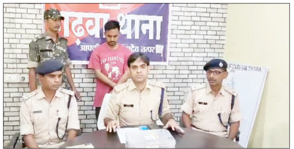
गिरफ्तार आरोपी के बारे में जानकारी देते पुलिस अधिकारी