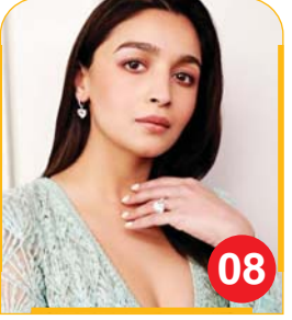
आलिया भट्ट ने दीपिका पादुकोण ...