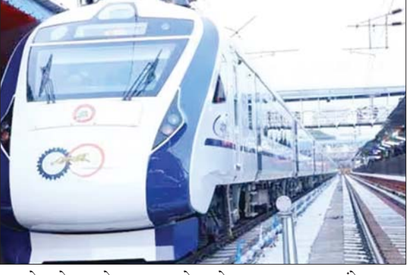
एक्सप्रेस के बदले हुए रूट से चलने की यह व्यवस्था अगले आदेश तक बनी रहेगी। उद्घाटन से