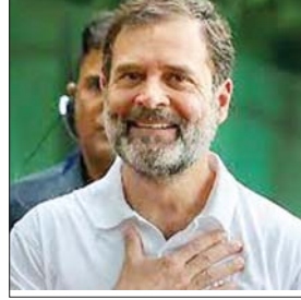
राहुल गांधी की फाईल फोटो।

के साथ ही सुनाई गयी सजा पर भी रोक लगा दी है। सुनवाई पूरी होने तक दोषसिद्धि पर रोक : सुप्रीम कोर्ट ने कहा है कि जब तक राहुल गांधी की याचिका पर सुनवाई पूरी नहीं हो जाती, तब तक दोषसिद्धि पर रोक रहेगी। सुप्रीम कोर्ट ने राहुल गांधी को अधिकतम सजा सुनाये जाने पर भी सवाल उठाये हैं। सुप्रीम कोर्ट का ये फैसला राहुल