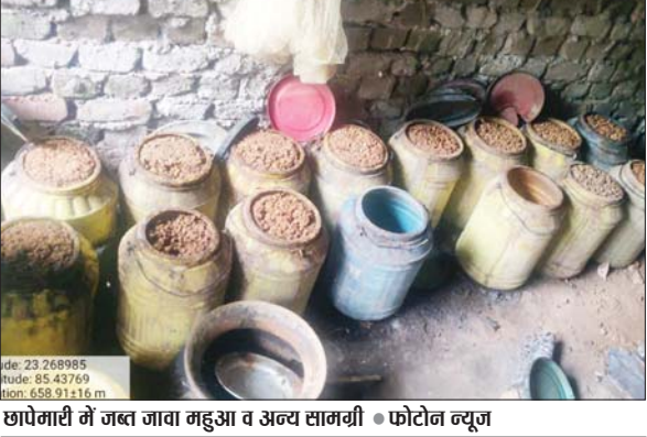
छापेमारी में जप्त जावा महुआ व अन्य सामग्री। • फोटोन न्यूज

रांची एयरपोर्ट के पीछे चंदाघासी ग्राम में अवैध तरीके से चल रहे अड्डे को ध्वस्त करते हुए जिला आबकारी टीम