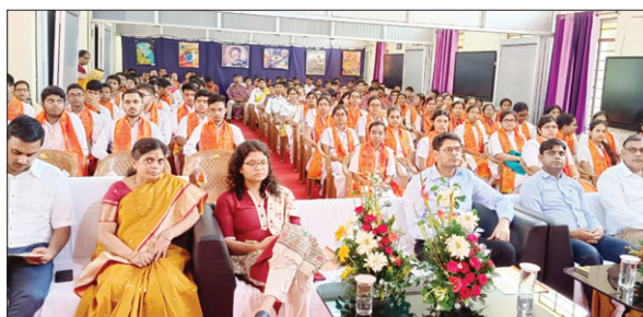
कार्यक्रम में उपस्थित उपायुक्त व अन्य।