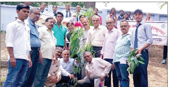
कॉलेज परिसर में पौधारोपण करते शिक्षक व छात्र-छात्राएं