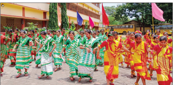
नृत्य प्रस्तुत करते स्कूल के बच्चे।