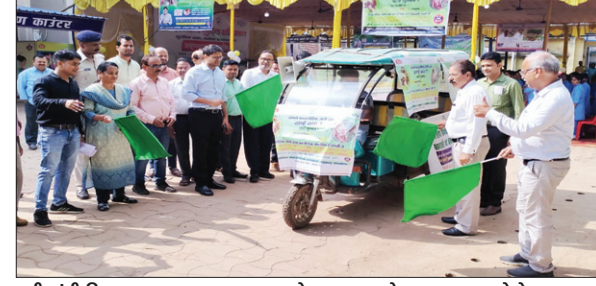
हरी झंडी दिखाकर जागरूकता वाहन को रवाना करते उपायुक्त।

एल्बेंडाजोल की 1 गोली तथा 15 वर्ष की उम्र से अधिक जनों को डीईसी की 3 गोली व एल्बेंडाजोल की 1 गोली दी जाएगी तथा यह दवा खाली पेट नहीं लेना है तथा