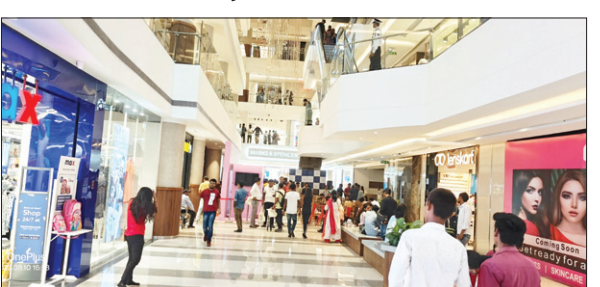
मॉल ऑफ रांची के प्रथम तल में शांतिग करते लोग