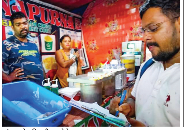
जांच करते अधिकारी।

PHOTON NEWS ROURKELA : राउरकेला नगर निगम खाद्य सुरक्षा विभाग द्वारा जगद और कोयलनगर मेला में 31 खाद्य स्टॉल का निरीक्षण किया गया। इस दौरान विभाग के अधिकारियों को पच्चीस किलोग्राम बासी भोजन, जिसमें एक्सपायरी समाप्ति तिथियां नहीं