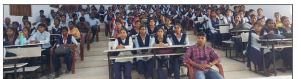
मौके पर मौजूद कोल्हान विश्वविद्यालय के विद्यार्थी।