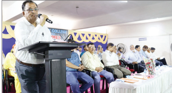
विद्यार्थियों को नैतिकता का पाठ पढ़ाते प्राचार्य।

उन्होंने कहा कि एक विद्यार्थी के लिए सबसे आवश्यक जो बात है वह है अनुशासन जिसकी