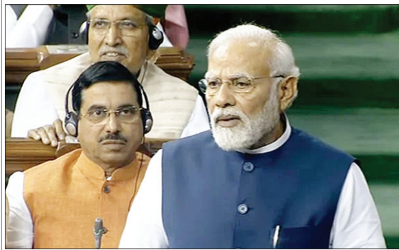
लोकसभा में बोलते प्रधानमंत्री नरेंद्र मोदी

केंद्र सरकार ने गुरुवार को राज्यसभा में मुख्य चुनाव आयुक्त (सीईसी) और अन्य चुनाव आयुक्तों (ईसीएस) की नियुक्ति को रोकने के लिए बिल पेश किया। बिल के मुताबिक आयुक्तों की नियुक्ति तीन सदस्यों का फैसला करेगा। जिसमें प्रधानमंत्री, राज्यसभा में विपक्ष का नेता और कैबिनेट का मंत्री शामिल होंगे। राज्यसभा में कांग्रेस, आम आदमी पार्टी सहित अन्य विपक्षी दलों ने इस विधेयक का विरोध किया। विपक्षी दलों ने कहा- सरकार सुप्रीम कोर्ट की संविधान पीठ के आदेश के खिलाफ बिल लाकर उसे कमजोर कर रही है। सुप्रीम कोर्ट ने मार्च 2023 में एक आदेश