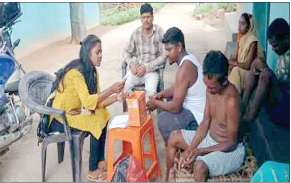
घर-घर जाकर जांच करती सहिया