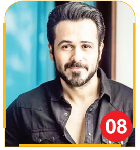
ओजी से टाइगर 3 तक इमरान हाशमी ने की...