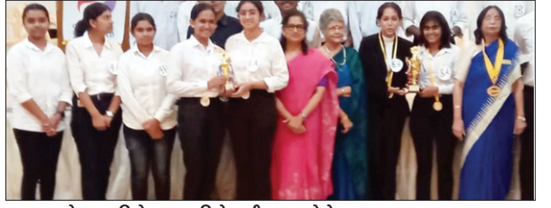
पुरस्कार के साथ विजेता व उपविजेता टीम। • फोटोन न्यूज