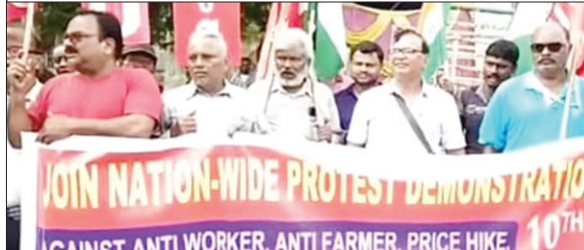
प्रदर्शन करते मजदूर संगठन के लोग।

ROURKELA : शहर के बिसरा चौक में गुरुवार को 15 सूत्री मांगों को लेकर केंद्र सरकार की मजदूर विरोधी नीतियों के खिलाफ हजारों की संख्या में मजदूरों ने धरना दिया। इस दौरान श्रमिकों ने हाथों में तख्तियां लेकर विरोध जताया। इस दौरान श्रमिक नेताओं ने कहा कि केन्द्र सरकार कारपोरेट घरानों के मुफ़ीद नियम