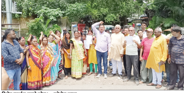
विरोध प्रदर्शन करते लोग।