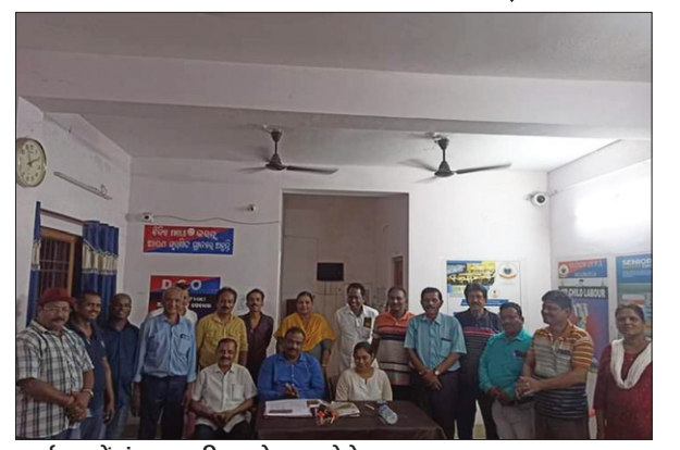
कार्यक्रम में मंच पर उपस्थित लोग।