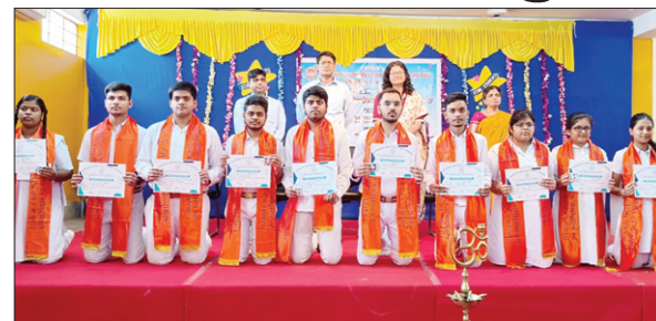
प्रशस्ति पत्र के साथ पुरस्कृत छात्र-छात्राएं।

के अनुभव को साझा करते हुए कहा कि बेहतर करने के बाद जब हम सभी को मेडल प्राप्त होते थे तो उसे विद्यालय के ड्रेस पर लगाकर बेहद गौरव अनुभूति करते थे। आज वही अनुभूति आप सभी के चेहरे पर देखना सुखद लग रहा है। उन्होंने कहा कि जिंदगी में लगातार बेहतर करने के लिए सीखने की ललक को सदैव जीवित रखिए। चाहे वह पढ़ाई के लिए हो, खेल के लिए हो या जीवन में उत्कृष्ट करने के लिए