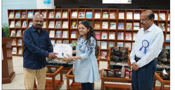
विजय प्रतियोगिता की विजेता को प्रशस्ति पत्र देते पादर।