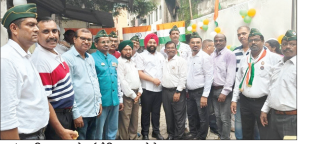
स्वतंत्रता दिवस पर जुटे पूर्व सैनिक। • फोटोन न्यूज