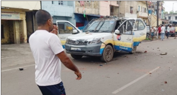
पथराव के बाद क्षतिग्रस्त पुलिस वाहन।