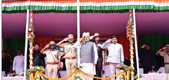
दुमका में झंडे को लतामी देते राज्यपाल।

राज्यपाल ने कहा कि विकास का लाभ राज्य के सभी वर्गों को विशेषकर वंचित वर्गों तक पहुंचे। सरकार इस दिशा में प्रयास कर रही है। उन्होंने कहा कि जनता के सहयोग से सरकार सभी चुनौतियों का सामना करने में सक्षम होगी। उन्होंने कहा कि विकास के साथ-