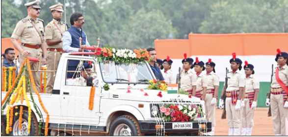
मोराबादी मैदान में परेड का निरीक्षण करते मुख्यमंत्री।

मुख्यमंत्री ने कहा कि आज हम भारत की आजादी के 76वें वर्षगांठ के तौर पर मना रहे हैं लेकिन हमें यह नहीं भूलना चाहिए कि लाखों वीर सेनानियों की शहादत के बाद हमें ये दिन देखने को मिला है। मैं उन तमाम स्वतंत्रता सेनानियों को श्रद्धांजलि अर्पित करता हूँ, जिनकी बदीलत हमें ये आजादी मिली। मैं