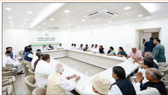
दिल्ली में बैठक करते घटक दल इंडिया के नेता एजेण्टी