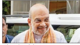
की फाईल फोटो।

विधानसभा चुनाव को देखते हुए विभिन्न राजनीतिक दलों के राष्ट्रीय नेताओं के दौर शुरू हो चुके हैं। 20 अगस्त को केन्द्रीय गृहमंत्री अमित शाह रायपुर दौर पर रहेंगे। वे रायपुर के साईस कॉलेज ग्राउंड में जनजातीय मंत्रालय की ओर से आयोजित कार्यक्रम में शामिल होंगे। पार्टी सूत्रों के अनुसार वे चुनावी तैयारियों की समीक्षा भी कर सकते हैं। वहीं 26 अगस्त को कांग्रेस के राष्ट्रीय अध्यक्ष मल्लिकार्जुन खड़गे महासमुंद्र आएंगे। इसी तरह 02 सितंबर को राहुल गांधी और 19 सितंबर को केशी वेणुगोपाल का छत्तीसगढ़ दौर होने वाला है। दिल्ली के मुख्यमंत्री अरविंद केजरीवाल 19 अगस्त को छत्तीसगढ़ दौर पर रायपुर