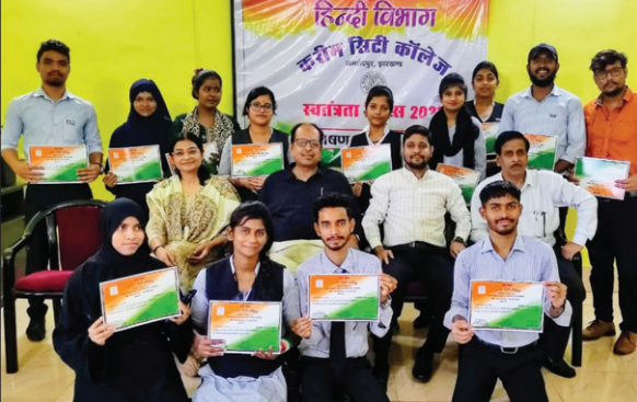
प्रतियोगिता में शामिल विद्यार्थी।