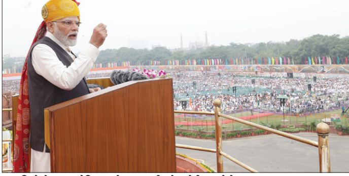
लालकिले से राष्ट्र संबोधित करते प्रधानमंत्री नरेन्द्र मोदी।

प्रधानमंत्री ने कहा कि 2047 तक देश का तिरंगा विकसित भारत का प्रतिनिधित्व करेगा। इसके लिए शुचिता, पारदर्शिता और निष्पक्षता की जरूरत है। हमें उन बुराइयों से आंख मिचौली बंद करना होगा जिनसे देश सातों से जुझता आ रहा है। यह बुराइयां हैं- भ्रष्टाचार, परिवारवाद और तृष्णीकरण। उन्होंने