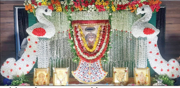
फूलों से सजा जीण माता का दरबार।