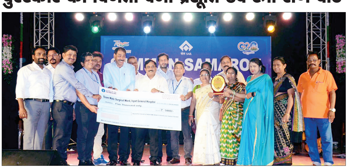
पुरस्कार प्राप्त करती प्रसूति एवं स्त्री रोग वार्ड की टीम

PHOTON NEWS ROURKELA: राउरकेला इस्पात संयंत्र के इस्पात जनरल अस्पताल में सेवा की गुणवत्ता में सुधार के लिए रोगी सेवा पुरस्कार की शुरुआत की गई है। विभिन्न इकाइयों के कर्मचारियों के बीच प्रतिस्पर्धी