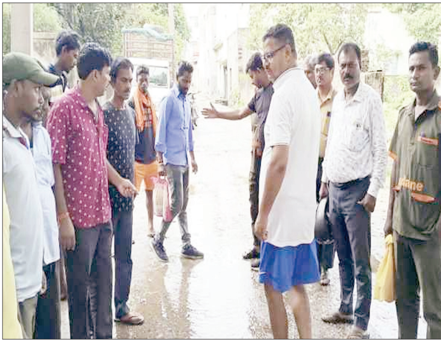
सड़क पर बहता पानी और एकत्रित लोग