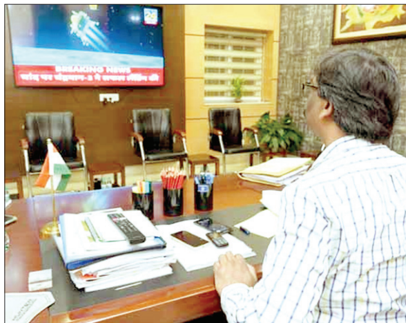
चंद्रयान-3 की लैंडिंग की लाइव स्ट्रीमिंग देखते सीएम

PHOTON NEWS RANCHI: मुख्यमंत्री हेमंत सोरेन ने आज भारत के मिशन चंद्रयान-3 की चांद के दक्षिणी ध्रुव पर सफल लैंडिंग की लाइव स्ट्रीमिंग देखी। मुख्यमंत्री ने हर्ष व्यक्त करते हुए कहा- अद्भुत!! अविस्मरणीय!! तिरंगे की आन-बान और शान चंद्रमा पर पहुंच गया। देश के हमारे महान वैज्ञानिकों की