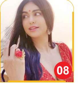
अदा शर्मा पर्दे पर बनेंगी फीमेल ...