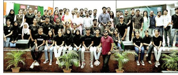
कार्यक्रम में शामिल छात्र-छात्राएं