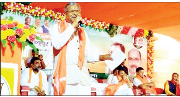
गव को संबोधित करते बाबूलाल मरांडी

भाजपा प्रदेश अध्यक्ष व पूर्व मुख्यमंत्री बाबूलाल मरांडी ने अपनी संकल्प यात्रा के दूसरे चरण की शुरुआत बुधवार को की। मधुपुर (देवघर) के डॉ श्यामा प्रसाद मुखर्जी मैदान में इसकी शुरुआत करते हुए जनसभा में हेमंत सरकार की विफलताओं, सत्ता संपोषित भ्रष्टाचार व ध्वस्त विधि व्यवस्था को लेकर हमला बोला। इसके अलावा सारठ में भी जनसभा में सरकार को घेरा। कहा कि राज्य में हत्या, लूट बलात्कार की घटनाएं हो रही हैं। पुलिस वसूली में लगी है। पुलिस अगर पकड़ती है, केस करती है तो वह अपराधियों पर नहीं, राज्य सरकार के विरोध में बोलनेवालों पर, सरकार के खिलाफ आंदोलन करनेवालों पर। राज्य में खान खनिज, बालू पत्थर की लूट मची है। इन लुटेरों को सरकार का संरक्षण प्राप्त है। सत्ता में बैठे लोग