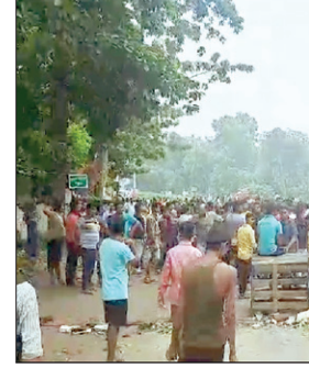
सड़क जाम करते आक्रोशित लोग

को एएसएमएमसीएच धनबाद ले गए। चिकित्सकों ने देव को मृत घोषित कर दिया, जबकि संतोष सिंह का इलाज चल रहा है। इस घटना से आक्रोशित झारखंड कॉलोनी लालबंगला के लोगों ने गोविंदपुर- धनबाद मुख्य सड़क को जाम कर दिया। जाम हटाने