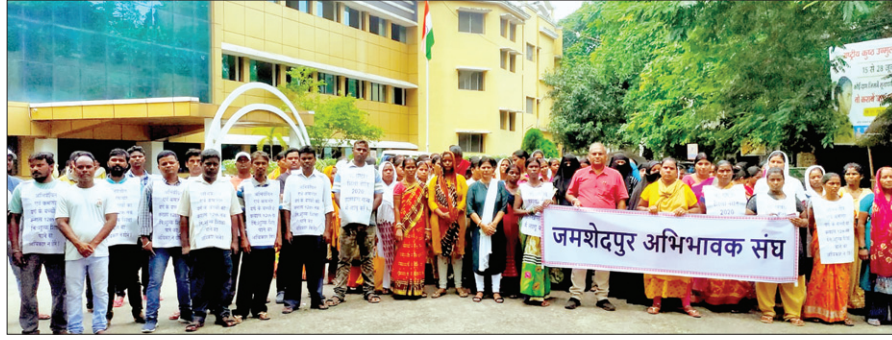
रैली में शामिल अभिभावक • फोटोन न्यूज

शहर के मोतीलाल नेहरू पब्लिक स्कूल व दयानंद पब्लिक स्कूल प्रबंधन के खिलाफ बुधवार को जमशेदपुर अभिभावक संघ के बैनर तले अभिभावकों ने रैली निकाली। इसमें दोनों स्कूलों में पढ़ने वाले कमजोर एवं अभिवर्चित वर्ग के बच्चों के अभिभावक शामिल थे। उनके बच्चों का शिक्षा का अधिकार अधिनियम (आरटीई)-2009 के तहत स्कूल में दाखिला हुआ था। प्रवेश कक्षा से आठवीं तक की पढ़ाई पूरी करने के पश्चात बच्चे जब नौवीं कक्षा में प्रमोत हो गये, तो दोनों स्कूलों के द्वारा इन बच्चों से फीस की मांग की जा रही है। साथ ही फीस नहीं देने की स्थिति में नाम काटने की चेतावनी दी गयी है। इसी के खिलाफ अभिभावकों