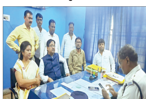
घटना को लेकर मामला दर्ज कराने पहुंचे लोग