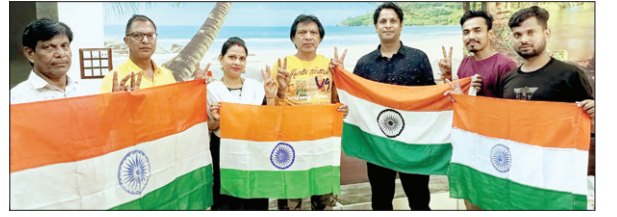
तिरंगा के साथ खुशियां मनाते कलाकार