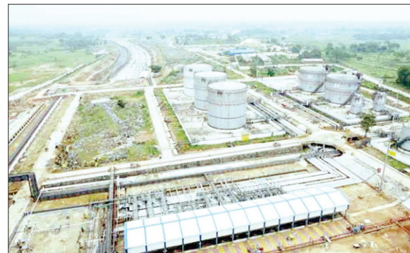
राधागांव में बना बीपीसीएल का ऑयल डिपो

PHOTON NEWS BOKARO : बोकारो जिले के राधागांव में भारत पेट्रोलियम कॉरपोरेशन लिमिटेड (बीपीसीएल) का ऑयल डिपो बनकर तैयार है। इसके सितंबर के दूसरे सप्ताह से शुरू होने की उम्मीद है। इस ऑटोमेटिक ऑयल डिपो से राज्य के सभी जिलों के पेट्रोल पंपों में पेट्रोल व डीजल की आपूर्ति की जाएगी। कंपनी के अधिकारी तैयारियों को अंतिम रूप देने में जुटे हुए हैं। ज्ञात हो कि बीते दिनों रेलवे रैक से डीजल कंपनी परिसर स्थित रेलवे साइडिंग में पहुंचा था, जिसे स्टोर कर रखा गया है। डीजल को टैंकर में डालने के लिए पाइपलाइन दुरुस्त की जा रही, इसके साथ ही जहां-जहां तकनीकी दिक्कतें हो सकती हैं, कंपनी के विशेषज्ञ उन्हें दुरुस्त करने में लगे हुए हैं।