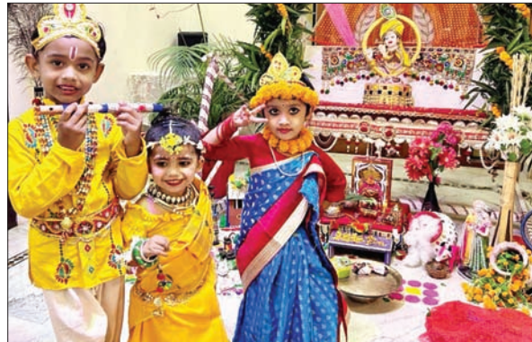
पूजा के बाद कृष्ण-राधा के रूप में नैदिर में नृत्य करते नन्दे बच्चे।

चौंसठ कलाओं से परिपूर्ण भगवान श्रीकृष्ण के अवतरण का महापर्व कृष्ण जन्माष्टमी बुधवार देर रात तक शहर और आसपास के क्षेत्रों में भक्तिपूर्ण वातावरण में धूमधाम से मनायी गई। इस अवसर पर पूरे दिन शहर के करां रोड स्थित रणछेड़ जी ठाकुर जी महाराज मंदिर (ठाकुरबाड़ी) और पिपराटोली के श्रीराम मंदिर के अलावा बाबा आम्रेश्वर धाम पर्सर स्थित राधाकृष्ण मंदिर सहित अन्य मंदिरों और देवालियों में पूजा-अर्चना की धूम रही। इस अवसर पर ठाकुरबाड़ी सहित अन्य मंदिरों को आकर्षक ढंग से सजाया गया है।