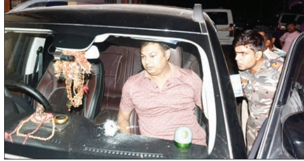
फायरिंग के बाद जांच करती पुलिस।

व्यवसायी ने पुलिस को बताया कि वह नयामोड़ स्थित राजनंदनी होटल से ऑपरेटर और मजदूर के लिए खाना लेकर कार से गेमन कॉलोनी जा रहा था। इस बीच घात लगाए अपराधियों ने जान