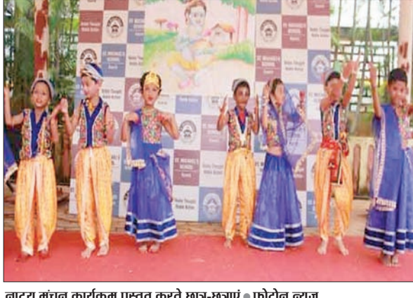
नाट्य मंचन कार्यक्रम प्रस्तुत करते छात्र-छात्राएं • फोटोन न्यूज

PHOTON NEWS RANCHI: राजधानी स्थित संत माइकल स्कूल में जन्माष्टमी पर विशेष प्रार्थना सभा का आयोजन किया गया। श्री कृष्ण के जन्मोत्सव पर बच्चों ने बह-चढ़कर हिस्सा लिया। राधा-कृष्ण के पोशाक में बच्चों ने मन मोह लिया। इस अवसर पर विभिन्न कार्यक्रम प्रस्तुत किये गये। छात्र-छात्राओं ने श्री कृष्ण और सुदामा की दोस्ती को नाट्य रूप में प्रस्तुत किया। साथ ही नृत्य के माध्यम से श्री कृष्ण के विभिन्न रूपों को दर्शाया। जन्माष्टमी पर गीत एवं भाषण भी किये गये प्रस्तुत जन्माष्टमी पर श्री कृष्ण के झूले का दृश्य झांकी के रूप में प्रस्तुत किया गया। इसके अलावा गीत एवं