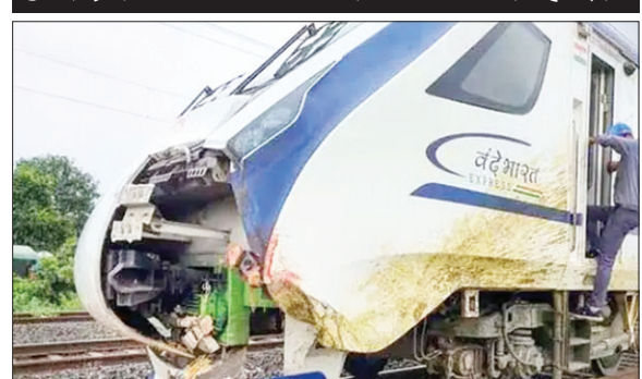
भैंस के टकराने से ट्रेन का अगला हिस्सा हुआ क्षतिग्रस्त

PHOTON NEWS RAMGARH : पूर्व मध्य रेलवे धनबाद रेल मंडल के बरकाकाना-कोडरमा रेल लाइन पर गुरुवार को ट्रेन संख्या (22349) पटना-रांची वंदेभारत एक्सप्रेस ट्रेन भैंस से टकरा गई। ट्रेन का अगला हिस्सा क्षतिग्रस्त हो गया। ट्रेन डेढ़ घंटे की देरी से बरकाकाना जंक्शन पहुंची। घटना में यात्रियों को कोई नुकसान नहीं पहुंचा। जबकि भैंस की मौत हो गई। जानकारी के अनुसार, कुजु स्टेशन के पार करते ही 11:16 बजे पोल संख्या 123/ए के समीप रेलवे ट्रैक को पार कर रही एक भैंस वंदे भारत एक्सप्रेस से टकरा गई, जिसके बाद ट्रेन दुर्घटना स्थल पर खड़ी हो गई। घटना के बाद ट्रेन 98 मिनट की देरी से