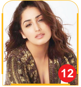
अक्षय का फिल्म बनाने का डेडिकेशन देख...