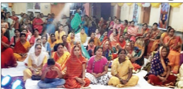
कथा सुनने के लिए उमड़ी श्रद्धालुओं की भीड़।

सुनकर श्रद्धालु भक्त भाव विभोर हो गए। कथा व्यास ने कहा कि गोपियों के बुलाने पर कृष्ण अपने सखाओं के साथ माखन चुराने के लिए गोपियों के यहां जाते थे। भगवान ने माखन चोरी लीलाओं को गोपियों के साक्षात्कार प्रेम को जागृत किया। भगवान ने कलिया नाग को उद्धार किया।