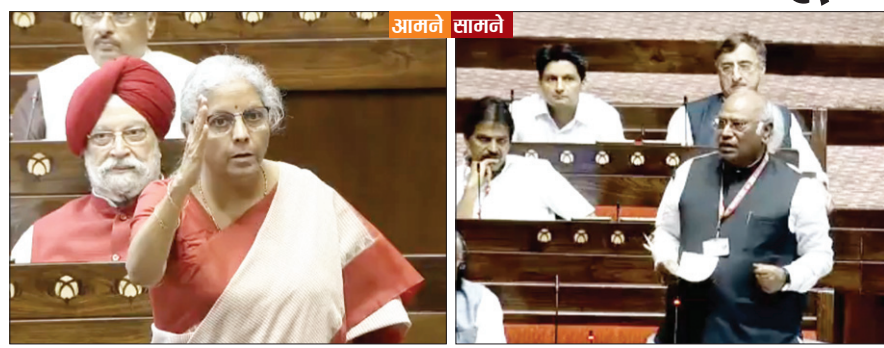
सदन में बोलती वित्त मंत्री निर्मला सीतारमण।

मल्लिकार्जुन खड़गे ने महिला आरक्षण बिल पर चर्चा करते हुए कहा- दलित और पिछड़ी जाति की महिलाओं को वो मौका नहीं मिलता, जो बाकी सब को मिलता है। उनकी इस बात पर सत्ता पक्ष ने हंगामा शुरू कर दिया। वित्त मंत्री निर्मला सीतारमण ने कहा- देश की राष्ट्रपति कौन हैं? वे ट्राइबल समाज से आने वाली महिला हैं। जिस पार्टी के आप अध्यक्ष हैं, उसमें कई सालों तक एक महिला ही अध्यक्ष रही हैं। सत्ता और विपक्ष के बीच काफी देर तक चले हंगामे के बाद भी खड़गे ने अपना भाषण जारी रखा। उन्होंने कहा- मैं इस बिल का स्वागत करता हूँ। यह बिल राज्यसभा में 2010 में पास हो चुका है। मैं कोशिश कर रहा था कि जो कानून बने, उसका लाभ गरीबों को, महिलाओं को मिले। मैं उनको प्रोत्साहित करने के लिए बोल रहा था, लेकिन वो बीच में बोलने लगे।