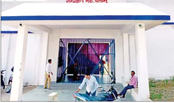
सम्प्रेक्षण गृह, पलामू

PHOTON NEWS PALAMU : डालटनगंज के जेलहाता स्थित रिमांड होम (सम्प्रेक्षण गृह पलामू) से मंगलवार दोपहर एक बार फिर दो नाबालिग फरार हो गए। कैपस के शौचालय की गैस पाइप को तोड़कर दोनों नाबालिग फरार हुए। इस संबंध में शहर थाना को सूचना दे दी गयी है। पुलिस के साथ समन्वय बनाकर दोनों की तलाश तेज की गयी है। उन्होंने बताया कि एक सप्ताह पहले दोनों नाबालिग चोरी कांड में पकड़े गए थे।