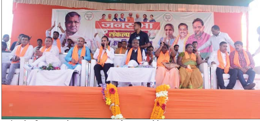
कार्यक्रम में उपस्थित भाजपा प्रदेश अध्यक्ष बाबूलाल मरांडी व अन्य। • फोटोन न्यूज

संकल्प यात्रा के आठवें चरण के दौरान मंगलवार को पोटका विधानसभा क्षेत्र में भाजपा के प्रदेश अध्यक्ष बाबूलाल मरांडी ने हेमंत सरकार पर जमकर हमला बोला एवं भ्रष्टाचार मुक्त, अपराध मुक्त शासन के लिए भाजपा की सरकार बनाने का आह्वान किया। जनसभा की संबोधित करते हुए उन्होंने कहा कि झारखंड लूटने वालों को सुरक्षा मिल रही है और व्यापारियों की हत्या हो रही है। सुरक्षा मांगने के बावजूद नहीं मिलना सरकार के नीतियों पर बड़ा खवाल खड़ा करता है। लापरवाह अधिकारी पर कार्रवाई होना ही चाहिए। उन्होंने कहा कि मामले में