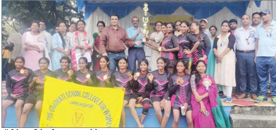
टॉफी के साथ विजेता टीम व अन्व।