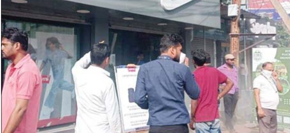
। • फोटोन न्यूज

PHOTON NEWS ROURKELA : उदितनगर के द्वारकापुरी होटल के पास एक स्पोर्ट्स शोरूम में आज दोपहर आग लग गयी। आग लगने से कुछ सामान और कपड़े जल गए। अग्निसमन कर्मचारियों के पहुंचने से पहले ही कर्मचारियों ने आग पर काबू पा लिया था। शॉट सफिर्ट से आग लगने की आशंका किया जा रहा है। शोरूम के कर्मचारियों और