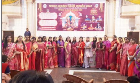
कार्यक्रम में उपस्थित अग्रसेन सेवा संघ के सदस्य।