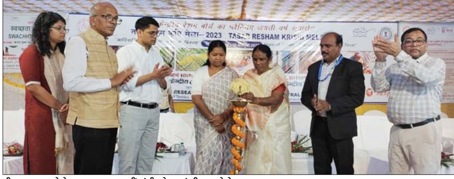
दीप जलाकर मेले का उद्घाटन करती मंत्री जोबा माझी।

इसके पूर्व मौजूद अतिथियों द्वारा अग्र परियोजना केंद्र में मौजूद कोकून बैंक कक्ष का अवलोकन कर संचालित गतिविधियों की जानकारी ली। तत्पश्चात पर्यावरण संरक्षण एवं रेशम कीट पालन में सहयोगी वृक्ष का रोपण किया गया। समारोह स्थल आगमन पर सर्वप्रथम