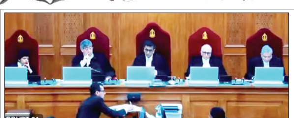
सुप्रीम कोर्ट में सुनवाई के दौरान 5 जजों की संविधान पीठ।