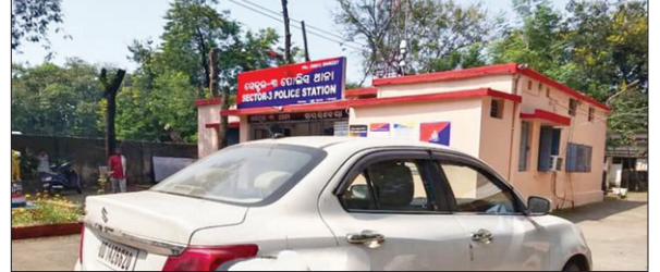
थान में जमा बरामद कार।

पुलिस ने छानबीन शुरू की तो संबंधित चोर ने वाहन को बालिजाड़ी में