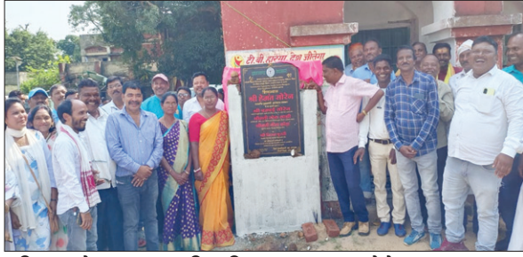
भूमि पूजन के अवसर पर उपस्थित विधायक व अन्य।

उन्होंने कहा कि वर्षों से आम जनता की मांग थी कि मझगांव सामुदायिक स्वास्थ्य केंद्र का निर्माण किया जाए। इसके लिए काफी प्रयास किये, इसके बाद ही इसे आज अंजाम तक पहुंचा जा सका। इसी प्रकार मझगांव प्रखंड