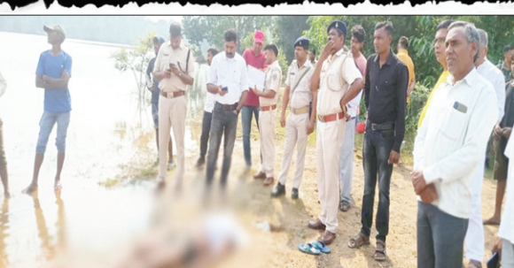
हजारीबाग के लोटवा डैम पहुंचकर छानबीन में जुटी पुलिस।