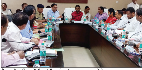
बैठक में उपस्थित केंद्रीय मंत्री अर्जुन मुंडा व अन्य।

PHOTON NEWS CHAIBASA : समाहरणालय स्थित सभागार में मंगलवार को खूटी लोस. सांसद सह जनजातीय कार्य मंत्रालय के केंद्रीय मंत्री अर्जुन मुंडा की अध्यक्षता में जिला विकास समन्वय एवं अनुश्रवण समिति (DISHA) की बैठक हुई। मौके पर मनोहरपुर विधायक सह महिला बाल विकास एवं समाज कल्याण विभाग की मंत्री जीबा माझी, सांसद व विधायक मौजूद रहे। बैठक में सर्वप्रथम विगत बैठक की कार्यवाही का अनुपालन प्रतिवेदन सहित जिला में विभिन्न विभागों के माध्यम से संचालित विकास व जनकल्याण की योजनाओं के अद्यतन प्रतिवेदन