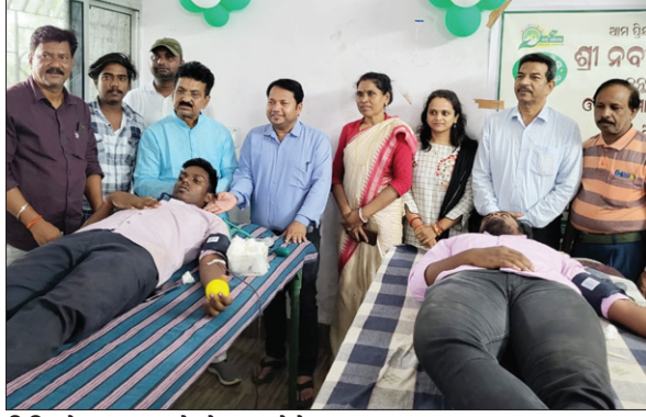
शिविर में रक्तदान करते लोग।