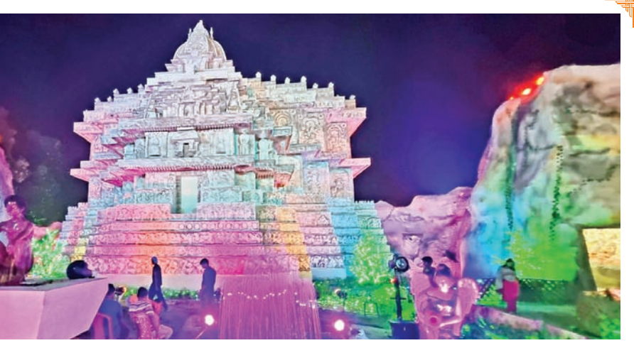
JAMSHEDPUR : नवरात्र का महापर्व शुरू हो गया है। इस दौरान मां दुर्गा के दर्शन को मत्क मठियों का रूख करेगे। लेकिन सबसे बड़ा आकर्षण पूजा पंडाल है। जमशेदपुर शहर में करीब 300 से अधिक जगहों पर इस बार छोटे बड़े पूजा पंडाल बनाए जा रहे हैं। इनमें सबसे बड़ा पूजा पंडाल आदित्यपुर स्थित में बना है जिसका नाम प्रवीण सिंह सेवा संस्थान दुर्गापूजा पंडाल है। करीब 50 लाख रुपये की लागत से बने इस पूजा पंडाल का उद्घाटन हो चुका है।