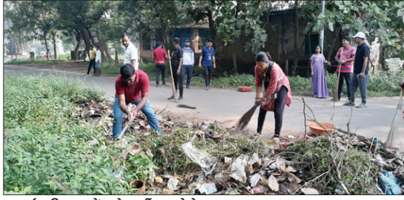
सफाई अभियान में लोग कर्मी।

PHOTON NEWS ROURKELA : राउरकेला इस्पात संयंत्र (आरएसपी) के टाउन इंजीनियरिंग विभाग की सार्वजनिक स्वास्थ्य इकाई ने विशेष सफाई अभियान के तहत सप्ताह में स्टील टाउनशिप में 150 किलोमीटर से अधिक सड़क की सफाई की है। इस विशेष अभियान का उद्देश्य संयंत्र और स्टील टाउनशिप के विभिन्न क्षेत्रों में स्वच्छता मानकों को ऊपर उठाना है। इसके अलावा,