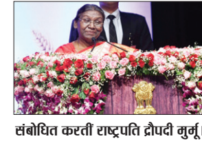
संबोधित करती राष्ट्रपति द्रौपदी मुर्मू।

राष्ट्रपति द्रौपदी मुर्मू ने बुधवार को पटना के बापू सभागार में राज्यपाल और मुख्यमंत्री की उपस्थिति में चौथे कृषि रोडमैप का शुभारंभ किया। इस मौके पर उन्होंने कहा कि मैं राष्ट्रपति पद से मुक्त होने के बाद अपने गांव जाकर खेती करूंगी। उन्होंने कहा कि बिहार भी मेरा राज्य है। यहाँ कभी मेरे पूर्वज रहते थे। मैं किसान की बेटी हूँ। कृषि रोडमैप की सारी जानकारी मुझे लेनी है। राष्ट्रपति ने कहा कि