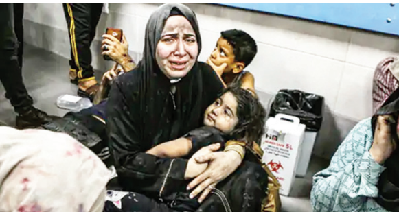
गाजा सिटी में अस्पताल पर हमले में अपनों को खोने के बाद रोती हुई महिला