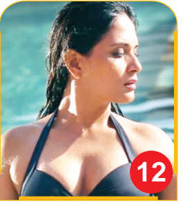
कुछ फिल्मों करने का ऋचा चड्ढा को आज...