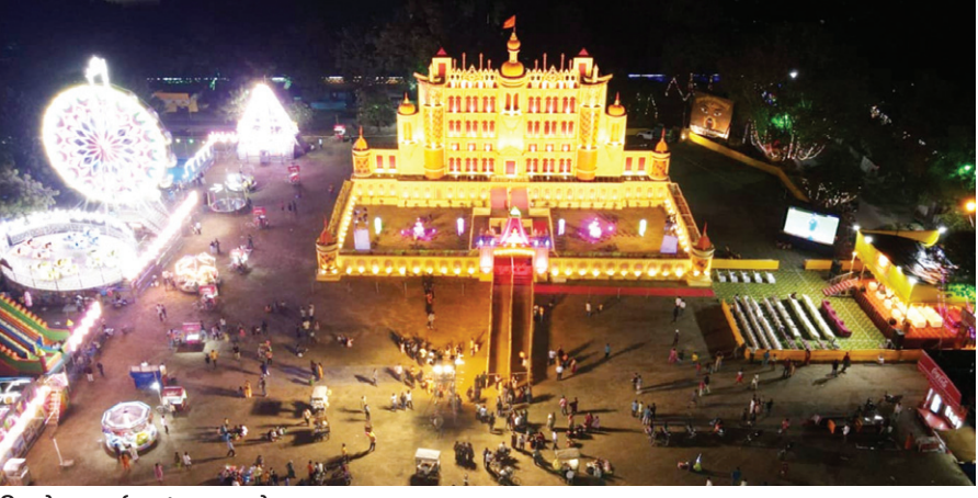
सिन्दगोड़ा दुर्गापूजा पंडाल, जमशेदपुर।