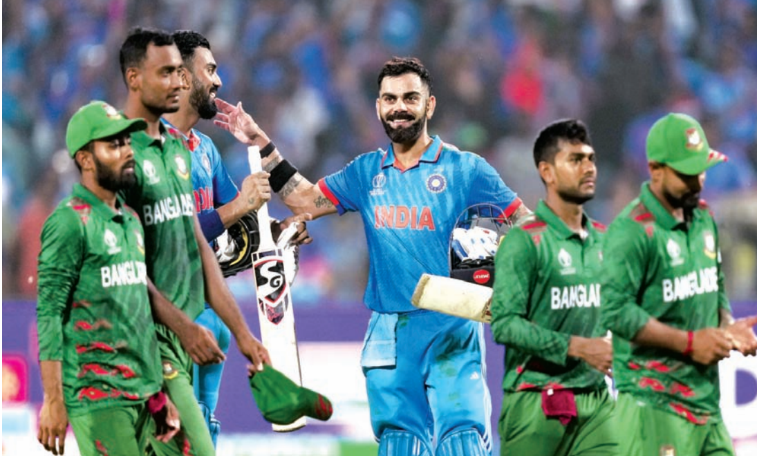
कोहली ने फेंकी तीन गेंदें

टीम इंडिया ने वर्ल्ड कप 2023 में लगातार चौथी जीत हासिल की है। भारतीय टीम ने बांग्लादेश को 7 विकेट से हराया। विराट कोहली (103* रन) ने 48वां वनडे शतक जमाया। उन्होंने सबसे तेज 26 हजार इंटरनेशनल रन भी पूरे कर लिए हैं। विराट ने 567 पारियों में यह अचीवमेंट हासिल की। कोहली से पहले सचिन तेंदुलकर 600 पारियों में 26 हजार बने थे। पुणे के एमसीए मैदान पर गुरुवार को बांग्लादेश ने टॉस जीतकर बल्लेबाजी करते हुए 50 ओवर में 8 विकेट पर 256 रन बनाए। 257 रन का टारगेट भारतीय बल्लेबाजों ने 41.3 ओवर में 3 विकेट पर हासिल कर लिया। कोहली के अलावा, शुभमन गिल (53 रन) ने 10वां अर्धशतक जमाया, जबकि कप्तान रोहित शर्मा ने 48 रनों का योगदान दिया। इससे पहले बांग्लादेश का स्कोर एक समय बिना किसी नुकसान के 93 रन था लेकिन इसके बाद भारतीय गेंदबाजों ने हार्दिक पंड्या के चोटिल हो जाने के बावजूद उसे बड़ा स्कोर नहीं बनाने दिया। हार्दिक ने नौवें ओवर में गेंद संभाली लेकिन लिटन दास के स्ट्रेट ड्राइव को कोने के प्रयास में उनका टखना मुड़ गया।