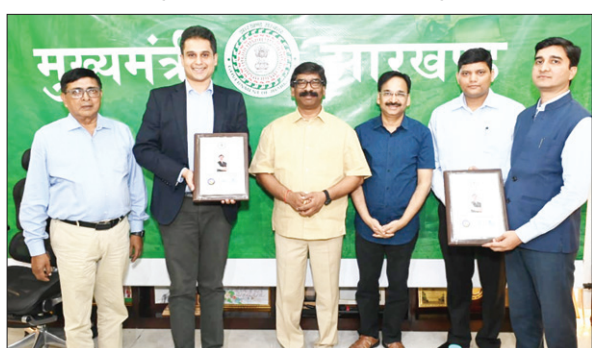
डीड साइन करने के बाद सीएम हेमंत, अपोलो हॉस्पिटल व निगम की टीम।

● राज्य में स्वास्थ्य व्यवस्था को मजबूत बना रही राज्य सरकार : मुख्यमंत्री