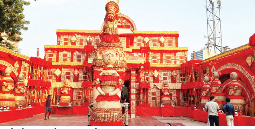
बागबेड़ा रोड नंबर 4 दुर्गा पूजा पंडाल, जमशेदपुर।