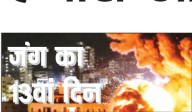
जंग का 13वां दिन

AGENCY TEL AVIV-YAFO : इजराइल और हमास की जंग का गुरुवार 13वां दिन था। इजराइल पर दो तरफ से हमलों का डर था और यह सच साबित हुआ। इजराइल पर नॉर्थ से हिजबुल्लाह रॉकेट और मिसाइलें दाग रहा है तो साउथ से हमास। लेबनान बॉर्डर पर मौजूद इजराइल के आखिरी शहर मैटुला में हिजबुल्लाह के करीब 10 हजार लड़ाके एक्टिव हैं। इनके पास एंटी टैंक मिसाइलें तक हैं। एक तरफ गाजा फ्रंट खुला है, तो दूसरी तरफ लेबनान से भी खतरा बढ़ रहा है। हिजबुल्लाह शिया मिलिशिया ग्रुप है, जबकि हमास