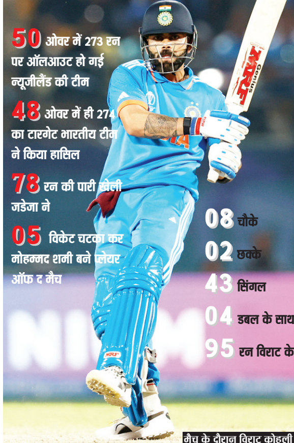
मैच के दौरान विराट कोहली।

274 रन का टारगेट चेज करने उतरी भारत की ओपनिंग जोड़ी ने सकारात्मक शुरुआत की। दोनों ने पहले पिच कंडीशंस को समझा, फिर शॉट खेलने शुरू किए। कप्तान रोहित शर्मा और शुभमन गिल की जोड़ी ने पावरप्ले के लगभग हर ओवर में बाउंड्री जमाई। भारतीय पारी के पावरप्ले का 9वां ओवर ही बाउंड्री रहित रहा। पावरप्ले में भारतीय ओपनर्स ने अर्धशतकीय साझेदारी की और टीम ने 10 ओवर में बिना नुकसान के 63 रन बनाए। इस दौरान गिल वनडे में सबसे तेज 2 हजार रन बनाने वाले बैटर बने हैं। उन्होंने 38 पारियों में अर्धशतक हासिल की। गिल ने हाशिम अमला का रिकॉर्ड तोड़ा। अमला को 2 हजार रन पूरे करने में 40 पारियां लगी थीं। पहले बेटिंग करने उतरी न्यूजीलैंड से डेरिल मिचेल (130) ने शतकीय पारी खेली, जबकि रचिन रवींद्र (75 रन) ने अर्धशतक जमाया। ग्लेन फिलिप्स ने 23 रन का योगदान दिया।