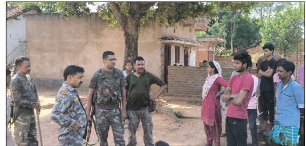
घटनास्थल पर जांच करती पुलिस।