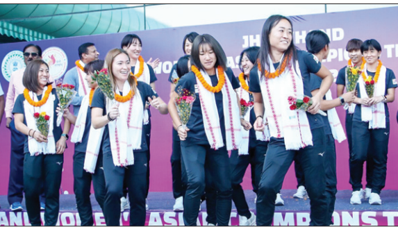
झारखंडी गीतों पर थिरके जापानी खिलाड़ी।