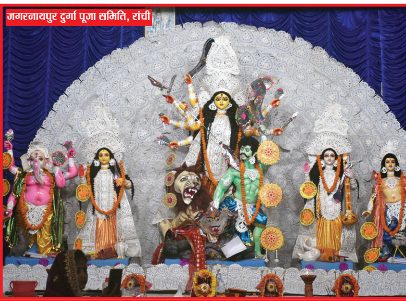
जगरनाथपुर दुर्गा पूजा समिति, रांची