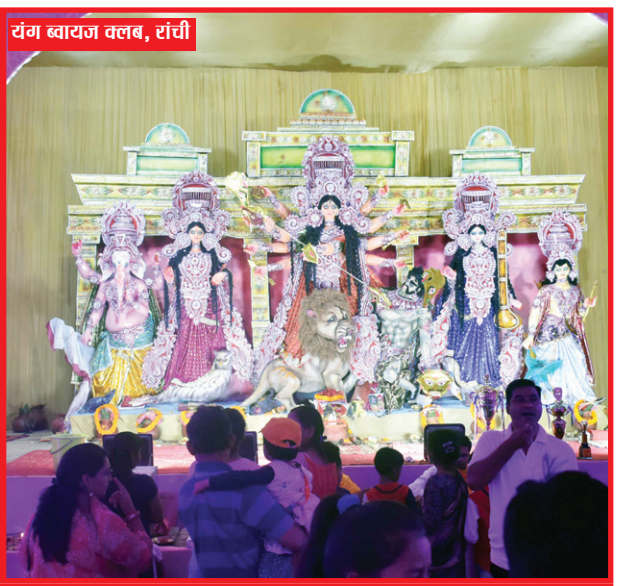
रंग बाराज वलब, रांची