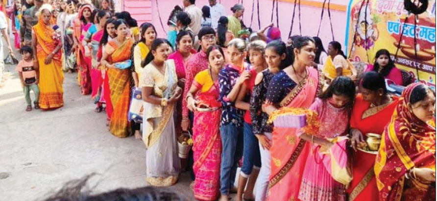
माता की पुष्पांजलि के लिए कतार में खड़ी महिलाएं।

गिरिडीह में रविवार को मां दुर्गा के शांत और सौम्य स्वरूप माता महा गौरी की भक्ति में डूबा रहा। अहले सुबह से ही भक्तों का रेला पूजा पंडाल और मंडप में पहुंचने लगा। दिन चढ़ते ही हर पंडाल और मंडप भक्तों की से भर चुका था। पंज रखने की जगह तक मिलना मुश्किल रहा। इसके बावजूद भक्तों की आस्था में कोई कमी नहीं देखी। भक्तों ने पूरे विधि-विधान के साथ माता की आराधना की। इसमें महिला, पुरुष और युवा सभी वर्ग के लोग शामिल रहे। कर्णप्रिय भजनों के बीच हर