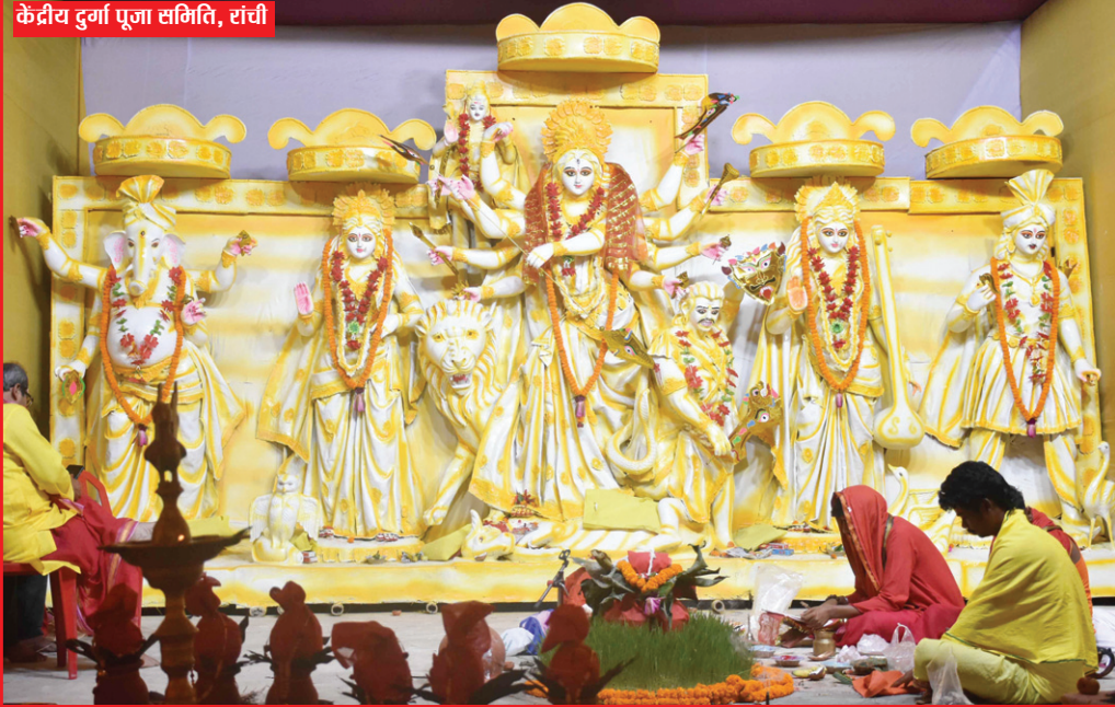
केन्द्रीय दुर्गा पूजा समिति, रांची