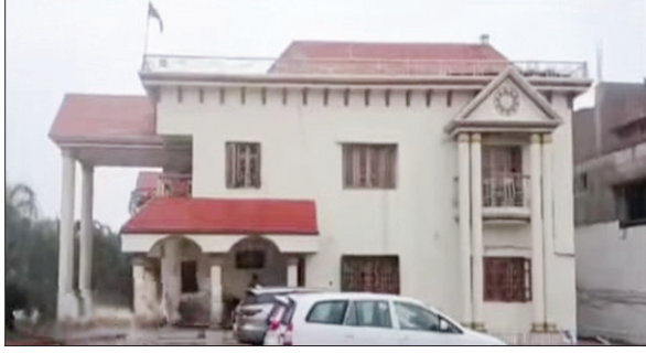
मकान से 30 करोड़ से ज्यादा रुपये जब्त किये गए। राज्य के बौध,