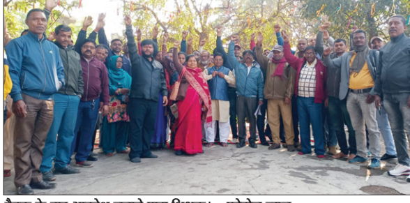
बैठक के बाद आक्रोश जताते पारा शिक्षक ।