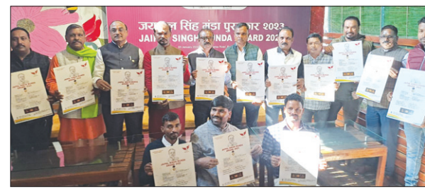
मोहराबादी मैदान स्थित ट्राइका रेस्ट्रेंट में पोस्टर का विमोचन करते पदाधिकारी।