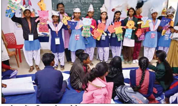
कार्यक्रम में उपस्थित बच्चे।

इस विज्ञान प्रदर्शनी में 15 जिलों के विद्यार्थियों ने भाग लिया। कुल 26 स्टालों पर उनके द्वारा तैयार विभिन्न विज्ञान परियोजनाएं प्रदर्शित की गईं। इसमें आधुनिक ड्रोन तकनीक का उपयोग करके पर्यावरण