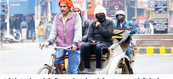
रांची में ठंड से बचने के लिए गर्म कपड़े व टोपी पहनकर घूमते दिखे लोग।

10 डिग्री तक पहुंच सकता है राजधानी का न्यूनतम तापमान