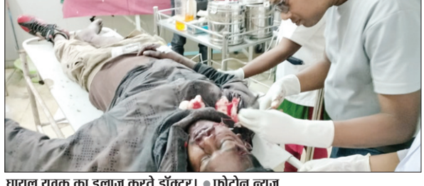
घायल युवक को इलाज करते डॉक्टर ।