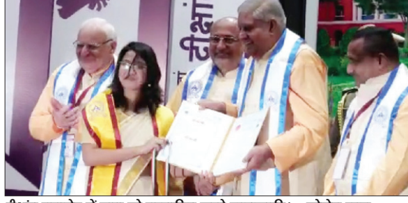
दीक्षांत समारोह में छात्रा को सम्मानित करते उपराष्ट्रपति ।

आईआईटी आईएसएम धनबाद के पेनमेन हॉल में रविवार को 43वां दीक्षांत समारोह आयोजन किया गया। इसमें मुख्य अतिथि उपराष्ट्रपति जगदीप धनखड़ ने विशिष्ट अतिथि राज्यपाल सीपी राधाकृष्णन 39 गोल्ड मेडलिस्ट छात्र-छात्राओं को सम्मानित किया। उपराष्ट्रपति जगदीप धनखड़ ने उपस्थित छात्र-छात्राओं को संबोधित करते हुए उन्होंने राज्यसभा सांसद धीरज साहू के यहां छोपे में मिले तीन सौ करोड़ रुपये की ओर इशारा किया और छात्रों से आग्रह किया कि वो भविष्य में एक ऐसी मशीन बनाएं जो कभी न थके वाला हो और वो तेजी से अनगिनत नोटों को बना सके। इसके साथ ही उन्होंने कहा कि आप