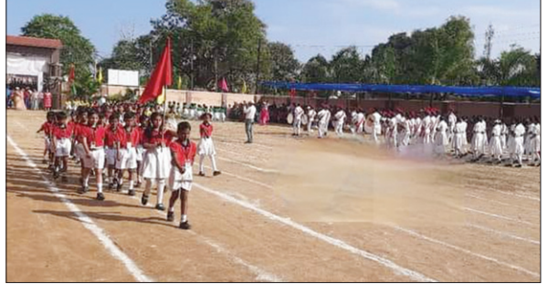
प्रतियोगिता में शामिल बच्चे।