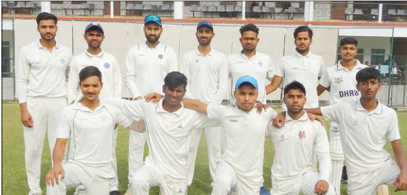
यंग झारखंड की टीम। • फोटोन न्यूज

पश्चिमी सिंहभूम जिला क्रिकेट संघ के तत्वावधान में खेले जा रहे एस आर रंगटा ए-डिवीजन लीग के अंतर्गत रविवार को खेले गए एक रोमांचक मुकाबले में गत वर्ष की चैंपियन टीम यंग झारखंड क्रिकेट क्लब चाईबासा ने मैच की आखरी गेंद पर रन बनाकर सेरसा चक्रधरपुर को तीन विकेट से पराजित कर अपनी जीत का सिलसिला बरकरार रखा। यंग झारखंड क्रिकेट क्लब की यह लगातार तीसरी जीत है। इस जीत के साथ ही अंक तालिका में अपने शुरु के तीनों मैच जीतकर बाहर अंकों के साथ यंग झारखंड की टीम पहले स्थान पर है। अपने शेष बचे दो मैचों में अगर यह टीम