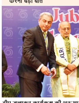
टीप जलाकर कार्यक्रम की शुरूआत करते उपराष्ट्रपति जगदीप धनखड़।