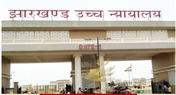
झारखण्ड उच्च न्यायालय