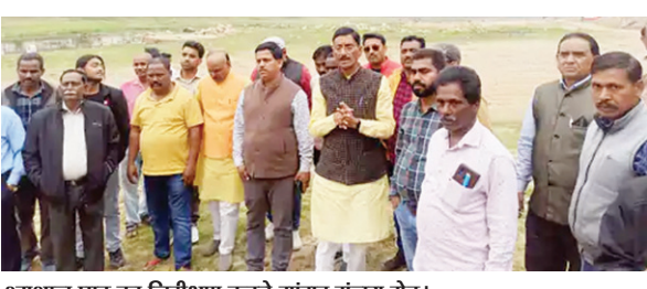
शमशान घाट का निरीक्षण करते सांसद संजय सेट।

जुमार नदी पर बनने वाले रांची के सबसे बड़े शवदाह गृह को लेकर सांसद संजय सेट ने उपरोक्त स्थल और शमशान घाट का निरीक्षण किया। सांसद संजय सेट की पहल पर जुमार नदी के शमशान घाट पर 7.5 करोड़ रुपए की लागत से रांची के सबसे बड़े शवदाह गृह का निर्माण होना है, जहां विद्युत चलित शवदाह की व्यवस्था भी होगी और चूल्हा भी रहेगा। यह मॉडर्न शवदाह गृह होगा, जहां लोग पारंपरिक रीति रिवाज से भी और विद्युत के माध्यम से भी अंतिम संस्कार कर