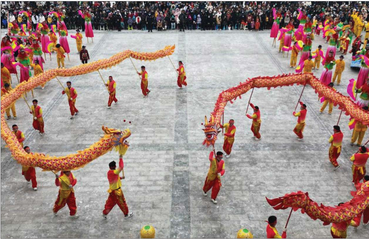
चीन में एक ड्रोन के जरिये ली गयी ड्रेगन डांस देखते हुए लोगों की तस्वीरें।

वाशिंगटन। गुगल के इमेल प्लेटफॉर्म जीमेल ने सेवा समाप्त किये जाने संबंधी वायरल फर्जी संदेश को खारिज करते हुए कहा है कि यह सेवा जारी रहेगी। जीमेल ने सोशल मीडिया प्लेटफॉर्म 'एक्स' पर अपनी पोस्ट में कहा, 'जीमेल यहां रहने के लिए है।' इससे पहले जीमेल से आयी फर्जी इमेल में दावा किया गया था कि अगस्त 2024 में यह सेवा समाप्त कर दी जायेगी।। अत सितंबर में गुगल ने कहा था कि जीमेल अब यूजर्स को जनवरी 2024 से बैसिक ब्राउजर एक्सेसिबल व्यु पर कनेक्टिविटी की अनुमति नहीं देगा। दूसरी तरफ गुरुवार को गुगल ने ऑटिफिकेशन इटेलीजेंस (एआई) मॉडल जैमिनी की लोगों की इमर्जिंग क्षमता को उस समय तक के लिए निबंधित कर दिया जब तक कि वे एआई मॉडल का उन्नत संस्करण जारी नहीं कर दें।