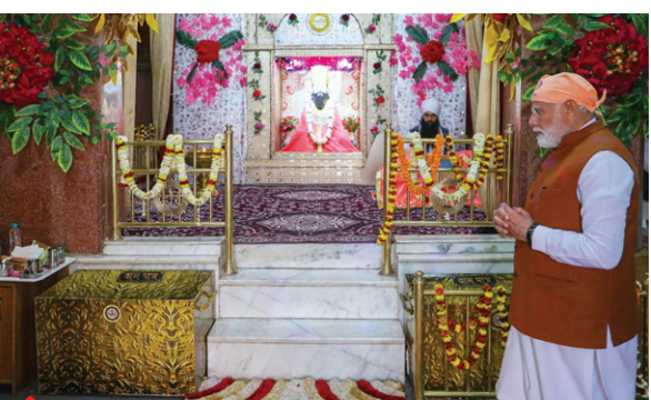
काशी में संत रविदास जयंती समारोह में शामिल होकर सम्मानित महसूस कर रहा हूँ। संत रविदास जयंती के आयोजन दिवसिका विकास कार्यों से तीर्थयात्रियों को बहुत लाभ होगा- प्रधानमंत्री नरेंद्र मोदी।

पीएम नरेंद्र मोदी शुक्रवार को वाराणसी में थे। उन्होंने औद्योगिक क्षेत्र करखियांव में काशी शंकुल के उद्घाटन के मौके पर वाराणसी और पूर्वांचल के विकास की बातें की तो, राहुल गांधी के दो दिन पहले काशी के युवाओं के नशे में पड़े होने वाले बयान पर हमला बोला। पीएम मोदी ने कहा कि दशकों के परिवारवाद भ्रष्टाचार और तृष्णकरण ने यूपी को विकास में पीछे रखा है। पहले की सरकारों ने यूपी को बीमारू राज्य बनाया। यहाँ के नौजवानों से उनका भविष्य छीना। लेकिन आज जब यूपी बदल रहा है जब यूपी के नौजवान अपना नया भविष्य लिख रहे हैं तब यह