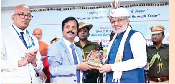
कार्यक्रम में राज्यपाल को नोनेटो देकर सम्मानित करते अतिथि।

रांची झारखंड के राज्यपाल सीपी राधा कृष्णन ने केन्द्रीय तसर अनुसंधान एवं प्रशिक्षण संस्थान, में केन्द्रीय रेशम बोर्ड के 66 नवनि्युक्त वैज्ञानिकों को प्रमाण पत्र वितरित करते हुए कहा कि सिल्क उद्योग का लोगों के सामाजिक-आर्थिक सशक्तिकरण में महत्वपूर्ण योगदान है। इस उद्योग में किसान एवं श्रमिकों का भी अहम योगदान है। उन्होंने नवनि्युक्त वैज्ञानिकों को कहा कि इस क्षेत्र को नवाचार, नई तकनीकी व नई प्रणाली के साथ विकसित करने की आवश्यकता है ताकि विश्व के मानचित्र पर भारत सर्वाधिक सिल्क उत्पादन एवं निर्यात करने वाला देश बन सके।