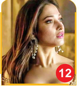
महिला किरदारों को सशक्त बनाने में भूमिका अदा...