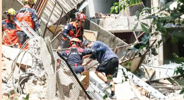
टूटी हुई इमारतों के मलबे में दबे लोगों को बाहर निकालती रेस्क्यू टीम।

विभाग के मुताबिक भूकंप ईस्ट ताइवान के हुलियन शहर में आया। इसका केंद्र धरती से 3.4 किलोमीटर नीचे था। भारतीय