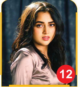
Tejasswi prakash Is a Beauty To Behold...