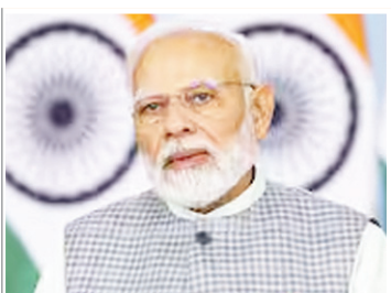
● कार्यकर्ताओं की मेहनत के दम पर चुनाव में बन रहे रिकॉर्ड

प्रधानमंत्री ने बुधवार को नमो ऐप के माध्यम से उत्तर प्रदेश के भाजपा कार्यकर्ताओं के साथ बातचीत की। उन्होंने कहा कि भाजपा कार्यकर्ताओं की कड़ी मेहनत के कारण लोकसभा-विधानसभा के हर चुनाव में नए रिकॉर्ड बन रहे हैं। मोदी ने कहा कि कार्यकर्ताओं का ये जोश देखकर मुझे तो प्रसन्नता होती है, लेकिन बाकी पार्टियों के नेता तो आपका ये जोश देखकर पहले ही टंडे पड़ जाते हैं। उन्होंने कहा कि आप सभी वोटों के सीधे संपर्क में होते हैं, उनके लिए आप ही भाजपा का चेहरा होते हैं। जब आप उनसे मिलते हैं तो वो आप में भी मोदी को ही देखते हैं। आप उन्हें जो भी बता रहे होते हैं तो उन्हें लगता है ये मोदी