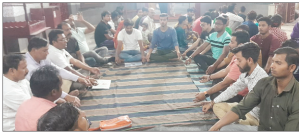
बैठक करते ग्रामीण।

जब यह पीसीसी पथ बनते हुए एदलवेड़ा गांव तक पहुंचा, तब ग्रामीणों ने निमाणधीन सड़क की गुणवत्ता पर नजर गई। ग्रामीणों ने पाया कि दो दिन पहले ढलाई की गई सड़क टूटने लगी है। सड़क पर कई जगह दरारें आ चुकी है।