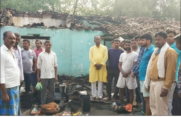
घटना के बाद नुष्ट आसपास के लोग।

जिले के तरहसी थाना क्षेत्र के बेदानी कला में स्थित एक किराना स्टोर में आग लगा दी गई। आग से करीब तीन लाख की संपत्ति जलकर नष्ट हो जाने की जानकारी दी गई है। इस संबंध में अंचल कार्यालय के साथ-साथ थाना में भी आवेदन देकर मुआवजा और घटना की जांच करने की मांग की गई है। दुकान में आग लगा देने की आशंका जताई है।