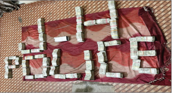
पुलिस द्वारा बरामद रुपए।