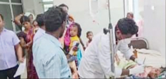
अस्पताल में इलाजत घायल। • फोटोन न्यूज