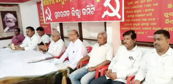
बैठक में शामिल टीपीआईएम के लोग।