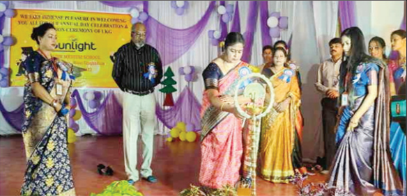
दीप जलाकर कार्यक्रम का उद्घाटन करती अतिथि।

मुख्य अतिथि सीजीएम आर पी सेलबम ने कहा कि आज हमें अपना बचपन याद आ गया। बच्चों का पहला स्कूल व पहला शिक्षक आजोवन याद आते हैं। यह स्कूल सभी क्षेत्र में बच्चों का सवागोंण विकास हेतु कार्य कर रही है। बच्चों का कौशल विकास बेहतर यहां हो रहा है। स्टेला सेलबम ने कहा कि यह स्कूल बच्चों का भविष्य गढ़ने का बेहतर कार्य कर रही है। यहां बच्चों को वैज्ञानिक तरीके से न