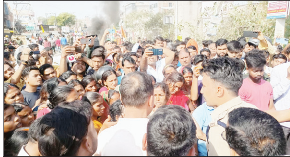
पुलिस के साथ हंगामा करती आक्रोशित भीड़।