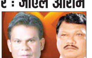
झंडी दे दी है। इसलिए उनके बीजेपी में शामिल होने के बाद पार्टी उन्हें उम्मीदवार बनाएगी।

PHOTON NEWS ROURKELA : पूर्व केंद्रीय कोयला राज्य मंत्री दिलिप राय मौजूदा आम चुनाव में राउरकेला विधानसभा सीट से भाजपा के उम्मीदवार हो सकते हैं। पार्टी की घोषणा से पहले चुनाव प्रचार के दौरान सांसद जोएल ओराम ने संकेत दिया है। उन्होंने कहा, राउरकेला विधानसभा सीट के लिए उम्मीदवार की घोषणा किसी भी वक्त की जा सकती है। अब दिलिप का कोर्ट के किए गए अपील से चुनाव लड़ने के याचिका पर फैसला दिलिप राय के पक्ष में आने उन्हें टिकट मिल सकता है। तत्कसर विधानसभा क्षेत्र के सबडेगा में चुनाव प्रचार के दौरान सांसद जुएल ओराम ने कहा कि दिल्ली हाई कोर्ट ने पहले ही दिल्ली में चुनाव लड़ने की हरी