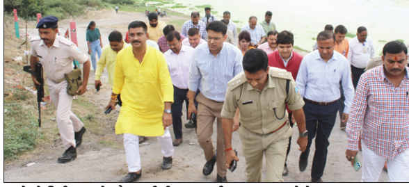
घाटों के निरीक्षण के दौरान डीसी, एसएसपी व अन्य। • फोटोन न्यूज

PHOTON NEWS JAMSHEDPUR : रामनवमी विसर्जन जुलूस और चैती छठ को लेकर उपायुक्त (डीसी) अनन्य मित्तल व वरीय पुलिस अधीक्षक (एसएसपी) किशोर कौशल ने मंगलवार को स्वर्णरेखा व खरकई नदी के घाटों का निरीक्षण किया। इस दौरान जिला के वरीय पदाधिकारियों ने सोनारी में देमुहानी छठ घाट, कदमा सती घाट व बिष्टुपुर में बोधनवाला घाट का निरीक्षण किया। उन्होंने नगर निकाय अधिकारियों व जुस्को के प्रतिनिधि को छठ घाटों को दुरुस्त करने, साफ सफाई कार्य, समतलीकरण, बैरिकेडिंग, प्रकाश व्यवस्था संबंधित कार्य, घाट तक