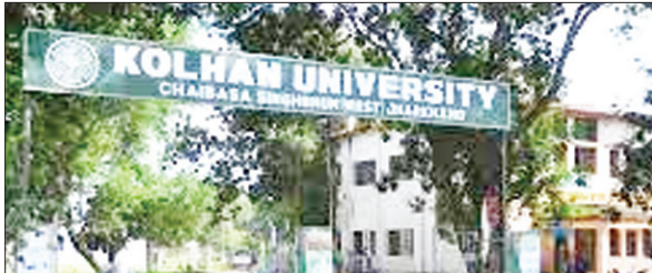
को-ऑपरेटिव लॉ कॉलेज में दाखिले की प्रक्रिया पूरी होगी। यहां एलएलबी की कुल 120 सीट है

PHOTON NEWS JAMSHEDPUR : को-ऑपरेटिव लॉ कॉलेज जमशेदपुर में संचालित एलएलबी प्रथम सेमेस्टर (सत्र 2023-26) में एडमिशन के लिए होने वाले प्रवेश परीक्षा के लिए ऑनलाइन आवेदन की प्रक्रिया मंगलवार से शुरू हो गयी है। इच्छुक छात्र कोल्हान विवि कि वेबसाइट पर जाकर आवेदन कर सकते हैं। जारी अधिसूचना के तहत आवेदन करने की अंतिम तिथि 4 मई है। वैसे विद्यार्थी जो किसी मान्यता प्राप्त विश्वविद्यालय से स्नातक हों, वे आवेदन कर सकते हैं। भरे हुए आवेदन की हार्ड कॉपी (प्रिंट) विश्वविद्यालय को रजिस्टर्ड पोस्ट के माध्यम से भेजनी है, जिसकी अंतिम तिथि 16 मई है। एलएलबी प्रवेश परीक्षा एक घंटे का होगा। इसमें 100 नंबर के 50 प्रश्न पूरे जाएंगे। मालूम हो कि इस प्रवेश परीक्षा के लिए जमशेदपुर