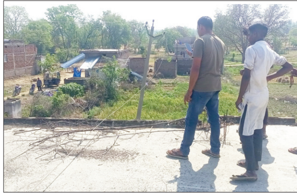
छत के ऊपर से गुजरता बिजली का तार।

स्थानीय लोगों की माने तो घरों के सामने या फिर छत के ऊपर से सटकर तार गुजरे हैं। कई बार लोगों को करंट भी लग चुका है और घर में आग भी लग गई है, जिससे एक बच्ची बुढ़ी तरह झुलस गई थी। गनीमत यह रही कि अभी तक किसी की जान नहीं गई है। बिजली तार हटाने