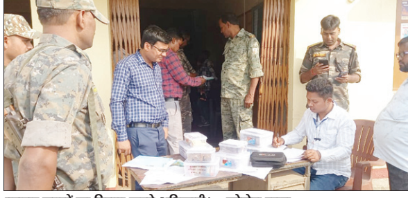
बरामद रुपये का हिसाब करते अधिकारी।

PHOTON NEWS JAMSHEDPUR : लोकसभा चुनाव के मद्देनजर पूर्वी सिंहभूम जिले की सीमा पर हर वाहन की कड़ी जांच की जा रही है। इसी क्रम में पोटका प्रखंड में झारखंड-ओडिशा बॉर्डर के रसूनचोपा चेकपोस्ट पर मंगलवार दोपहर छह बाइकों को ओवरलोडिंग के कारण रोका गया, इस दौरान सभी बाइक की बारी-बारी से जांच की गई तो जांच के दौरान सभी बाइकों से मिला कर 11.16 लाख रुपये मिले। बाइकों में इतनी नकदी देखकर एसएसटी