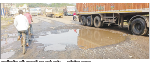
मनीफीट की सड़कों पर बड़े गड्डे। • फोटोन न्यूज

PHOTON NEWS JAMSHEDPUR : टेलको क्षेत्र के मनीफीट में रोड में बड़े-बड़े गड्डे हो गए हैं। इस रोड से भारी वाहनों का आवागमन दिन-रात होता रहता है, तो हजारों लोग रोजी-रोटी सहित अन्य आवश्यकताओं के लिए बाइक-कार या साइकिल से गुजरते हैं। गड्डे हो जाने से राहगीरों को बहुत परेशानी हो रही है, क्योंकि