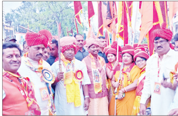
रामनवमी के तैयारी कार्यक्रम में गांग लेते श्रद्धालु।

भगवान श्रीराम के जन्मोत्सव को लेकर पूरे खूंटी जिले में हर्ष का माहौल है। क्या शहर और क्या गांव, हर ओर श्रीराम, वीर हनुमान के ध्वज लहरा रहे हैं। अयोध्या में भगवान श्रीराम लला की प्राण प्रतिष्ठा के बाद इस क्षेत्र में रामनवमी को लेकर जबरदस्त तैयारी की जा रही है। विभिन्न रामनवमी समितियां और अखाड़ेधारी राम जन्मोत्सव को भव्यतम बनाने के लिए लगातार प्रयास में लगे हैं। कहीं, श्रीराम, माता सीता, भाई लक्ष्मण और भक्त हनुमान की झांकियां निकालने की तैयारी हो रही है, तो कहीं अस्त्र-शस्त्र चालन और शोभायात्रा को सफल बनाने में रामभक्त लग गये हैं। रामनवमी को लेकर मंदिरों को भी आकर्षक ढंग से सजाया जा रहा है।