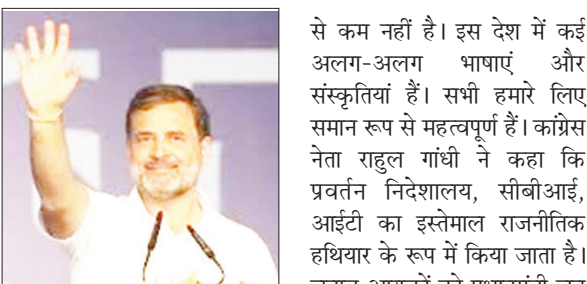
जनता से रुबरु राहुल गांधी।

शुक्रवार को कांग्रेस नेता राहुल गांधी ने तमिलनाडु के तिरुनेलवेली में एक चुनावी सभा को संबोधित किया। उन्होंने इस दौरान भाजपा पर हमला बोलते हुए कहा कि भाजपा विपक्ष के खिलाफ ईडी व सीबीआई का राजनीतिक इस्तेमाल कर रही है। राहुल गांधी ने कहा कि आज भारत में एक वैचारिक लड़ाई चल रही है। एक तरफ पेरियार के विचार, सामाजिक न्याय, स्वतंत्रता और समानता हैं। दूसरी तरफ नरेंद्र मोदी और उनकी