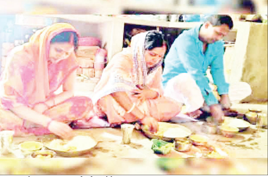
नहाय-खाय के बाद प्रसाद ग्रहण करती व्रती।

लौकी की सब्जी और चने की दाल : बता दें कि नहाय खाय के दिन विशेष तौर पर लौकी की सब्जी बनती है। इसके पीछे यह मान्यता है कि लौकी काफी पवित्र होता है। साथ ही इसमें पर्याप्त मात्रा (96 फीसदी) में पानी होता है? इसको खाने से शरीर में पानी