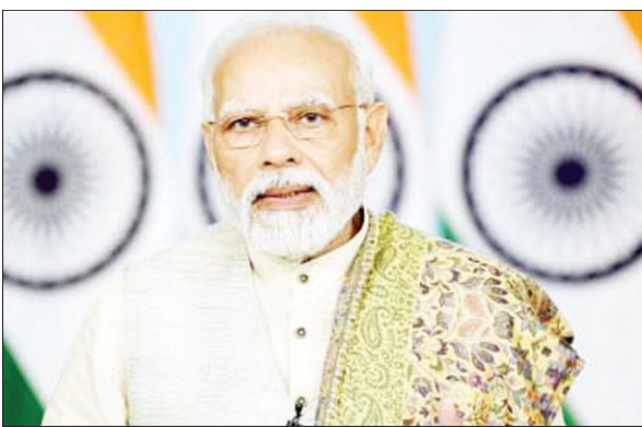
जनता को संबोधित करते प्रधानमंत्री नरेंद्र मोदी।

शुक्रवार को जम्मू-कश्मीर के उधमपुर में प्रधानमंत्री कहा कि यह चुनाव सिर्फ सांसद चुनने का नहीं है, बल्कि यह एक मजबूत सरकार बनाने का चुनाव है। पीडीपी-कांग्रेस जम्मू-कश्मीर को पुराने दिनों की तरफ ले जाना चाहती हैं। मोदी विकसित भारत के लिए विकसित जम्मू-कश्मीर के निर्माण की गारंटी दे रहा है, लेकिन कांग्रेस, नेशनल कॉन्फ्रेंस और पीडीपी इसे फिर उन पुराने दिनों की तरफ ले जाना चाहती हैं। इन पार्टियों ने जम्मू-कश्मीर का जितना नुकसान किया, उतना नुकसान किसी ने नहीं किया है।