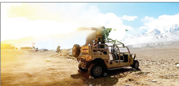
एंटी-टैंक गाइडेड मिसाइल।

भारतीय सेना के जवानों ने सटीक निशाने लगाए। इस अभ्यास में पूर्वी कमान की सभी मैकेनाइज्ड और इन्फैट्री इकाइयों