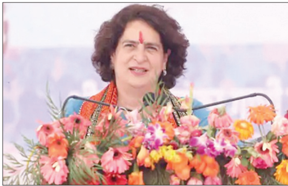
उत्तराखंड के रामनगर में जनता से वार्क प्रियंका गांधी।

शनिवार को कांग्रेस की महासचिव प्रियंका गांधी ने उत्तराखंड के रामनगर में चुनावी जनसभा को संबोधित किया। कहा, "हमारे परिवार ने देश के लिए खून दिया। देश के लिए आस्था और सच्ची श्रद्धा हमारे दिल में है। ये मेरे परिवार को कितनी भी गालियां दें, मेरे शहीद पिता का अपमान करें, लेकिन हम चुप रहते हैं, क्योंकि ये हमारे संघर्ष को नहीं समझते। हम चुप रहते हैं, क्योंकि इस देश के लिए आस्था और सच्ची श्रद्धा हमारे दिल में है। आपके सामने 10 सालों की सच्चाई है आप तय कीजिए। अब बार-बार मोदी सरकार नहीं चलेगी। इस बार जनता की सरकार बननी चाहिए। इस बार बेरोजगार नौजवान की सरकार बननी चाहिए। ऐसी सरकार बननी चाहिए, जिसके लिए आप सर्वोपरि हैं।"