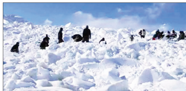
उन चौकियों पर जहां भीषण सर्दियों में जवान तैनात रहते हैं। अधिकारियों ने बताया कि विशेष कपड़ों, पर्वतारोहण उपकरणों और राशन की उपलब्धता ने सैनिकों को दुनिया के सबसे ठंडे युद्धक्षेत्र की कठोर परिस्थितियों

'ऑपरेशन मेघदूत' की 40वीं वर्षगांठ पर भारतीय सेना ने अधिकारियों ने हाल के दिनों में भारतीय रक्षा बलों द्वारा सियाचिन ग्लेशियर क्षेत्र में की गई कुछ प्रमुख पहलों के बारे में बताया। इसमें हेलीकॉप्टर और लॉजिस्टिक ड्रोन का भी जिक्र किया गया। सेना और राशन की उपलब्धता ने सैनिकों को दुनिया के सबसे ठंडे युद्धक्षेत्र की कठोर परिस्थितियों