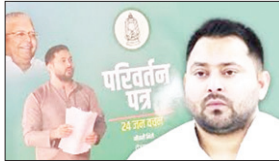
मिलना शुरू हो जाएगी। नौकरी की प्रक्रिया चालू की जाएगी।