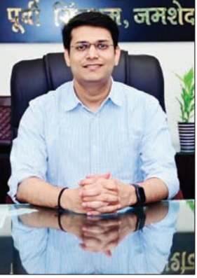
अनन्य मितल • फोटोन न्यूज

PHOTON NEWS JSR: जमशेदपुर लोकसभा क्षेत्र में 25 को मतदान होना है। इसके लिए जिला प्रशासन की ओर से घर-घर मतदाता पर्ची बांटी जा रही है। जिला निर्वाचन पदाधिकारी अनन्य मितल ने अपील की है कि जिन्हें अब तक मतदाता सूचना पर्ची नहीं मिली है, वे टोल फ्री 1950 पर शिकायत करें, आपके क्षेत्र के बीएलओ द्वारा घर पर जाकर मतदाता सूचना पर्ची उपलब्ध कराई जाएगी। जिले में मतदाता सूचना पर्ची वितरण का 18 मई को अंतिम दिन है।