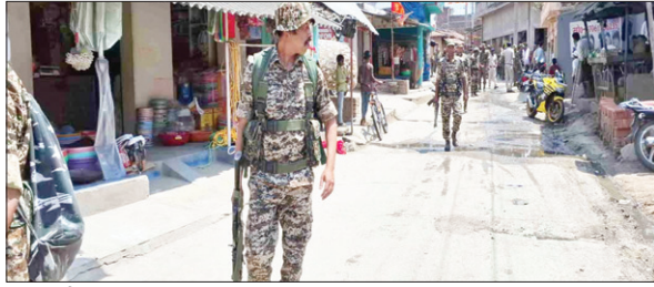
क्षेत्र में तैनात सुरक्षा बल के जवान। • फोटोन न्यूज

PHOTON NEWS CHATRA : लोकसभा चुनाव के पांचवें चरण में झारखंड में तीन सीटों पर 20 मई को मतदान होगा। इसमें अति नक्सल प्रभावित चतरा लोकसभा सीट भी शामिल है। चुनाव आयोग और जिला प्रशासन ने चतरा लोकसभा क्षेत्र में सुरक्षा की दृष्टिकोण से नौ मतदान केंद्रों के स्थल में परिवर्तन किया है।