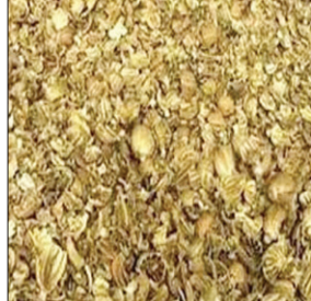
अफीम डोडा को अन्यत्र ले जाने के लिए तस्कर आनेवाले हैं।