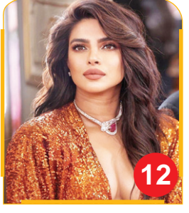
Priyanka Chopra's Sultry Strawberry...