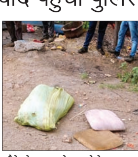
मौके से बरामद बोरा • फोटोन न्यूज

PHOTON NEWS JSR: सरायकेला-खरसावां जिला अंतर्गत आदित्यपुर थाना क्षेत्र के केंदुगाड़ स्थित पवन कांटा के पास पुलिस ने शुक्रवार की सुबह बोरा में बंद एक युवक का शव बरामद किया है। इसके पहले घटना को लेकर क्षेत्र में अफरा-तफरी का माहौल उत्पन्न हो गया था। पुलिस को घटना की जानकारी मिलते ही घटनास्थल पर पहुंची और बोरा में बंद शव को बरामद कर लिया। प्रत्यक्षदर्शियों के साथ-साथ पुलिस भी कह रही है कि युवक की हत्या कहीं और की गई है, लेकिन साक्ष्य छिपाने के लिए बोरा में बांधकर कहीं और फेंक दिया गया है।