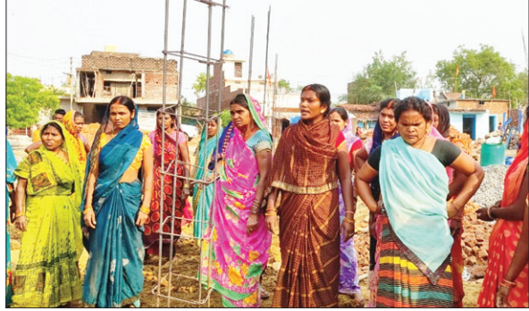
आक्रोशित ग्रामीण महिलाएं।

ग्रामीणों ने इस चहारदीवारी निर्माण का विरोध करते हुए मौके पर पहुंचे और दीवार देने के लिए जोड़ी गई ईंट को गिरा दिया। आरोप लगाया कि गलत तरीके से चहारदीवारी का निर्माण किया जा रहा है। दीवार दे देने से आवागमन से इस स्थान पर बाजार लगाया बंद हो जाएगा। आक्रोशित ग्रामीणों ने अंचलाधिकारी एवं