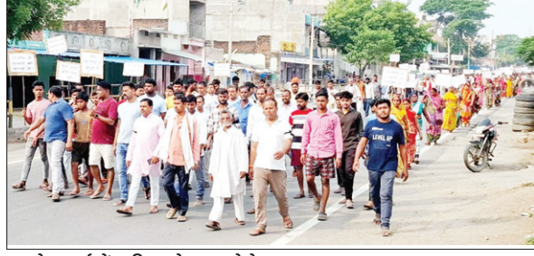
आक्रोश मार्च में शामिल लोग।

आक्रोश मार्च छतरपुर के जपला चौक से होते हुए अनुमंडल कार्यालय तक निकाला गया। लोग