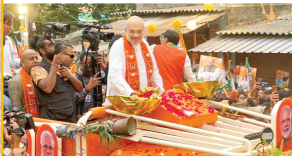
रोड शो में शामिल होते केंद्रीय गृह मंत्री अमित शाह।

PHOTON NEWS RANCHI : चौक, फिर महादेव मंडा की तरफ शुक्रवार को केंद्रीय गृह मंत्री अमित शाह ने रांची में संजय सेट के पक्ष में रोड शो किया। शाह के स्वागत के लिए अलग-अलग मंच बनाए गए थे। रोड शो के दौरान उनपर फूलों की बारिश की गई। लोग छतों से शाह की एक झलक देखने के लिए खड़े थे। ढोल नगाड़े के साथ महिलाओं की टोली पहुंची हुई थी। सड़क के दोनों ओर भीड़ दिखाई दी। शाह ने हाथ हिलाकर लोगों का अभिवादन किया। रोड शो के दौरान रांची का मौसम भी सुहाना हो गया, हल्की बूदाबांदा हुई। रोड शो राम मंदिर होते हुए पावर