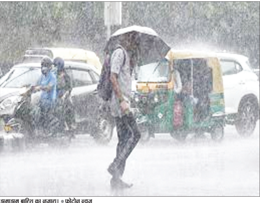
झमाझम बारिश का नजारा।

PHOTON NEWS RANCHI : झारखंड में मौसम ने एक बार फिर से करवट ली है। रविवार को दोपहर दो बजे के बाद राजधानी रांची में झमाझम बारिश हुई। बारिश के कारण मौसम सुहाना हो गया। मौसम विभाग के अनुसार, राज्य में 25 मई तक गरज के साथ हल्की बारिश के आसार हैं। झारखंड के पूर्वी, दक्षिणी एवं निकटवर्ती मध्य भागों में 20 और 21 मई को कहीं-कहीं गरज के साथ हल्की बारिश हो सकती है। 22 मई को भी राज्य के कुछ स्थानों पर गरजन के साथ बारिश के आसार हैं। 23 मई को राज्य के पूर्वी, दक्षिणी और निकटवर्ती मध्य भागों में गरज के साथ हल्की बारिश की संभावना है। मौसम विभाग के अनुसार, 25 मई तक राज्य में हल्के दर्जे की बारिश हो सकती है।