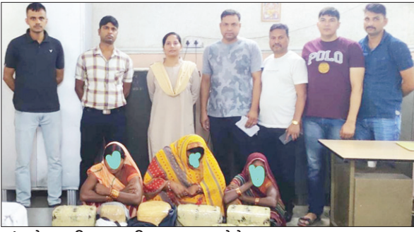
गांजा के साथ गिरफ्तार महिला तस्कर।