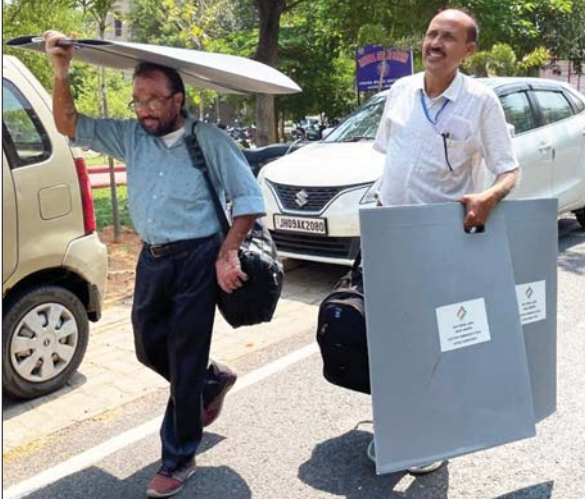
हजारीबाग में मतदान के लिए रवाना होते मतदान कर्मी

वर्ष 2019 में भारतीय जनता पार्टी (बीजेपी) ने इन 49 में 32 सीट जीती थी। वहीं शिवसेना को सात, टीएमसी को चार और कांग्रेस को