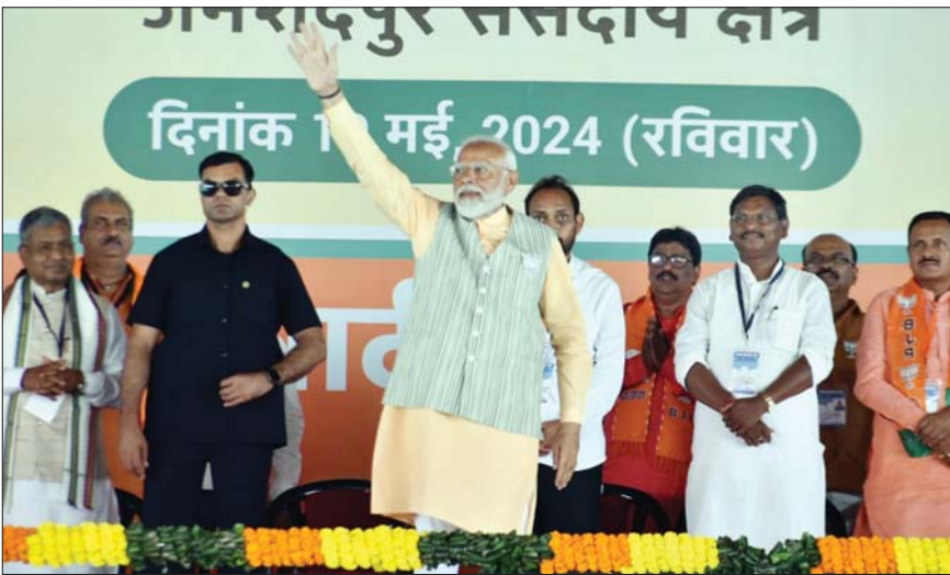
घाटशिला की जनसभा में जनता का अभिवादन करते प्रधानमंत्री नरेंद्र मोदी

प्रधानमंत्री नरेंद्र मोदी ने रविवार को जमशेदपुर संसदीय क्षेत्र के घाटशिला स्थित मउभंडार मैदान में जनसभा की। यहां भाजपा प्रत्याशी विद्युत वर्ण महतो को भारी मतों से जिताने का आह्वान करते हुए नरेंद्र मोदी ने कांग्रेस को उद्योग व निवेश विरोधी बताया। उन्होंने अपने अंदाज में कहा, मेरा उन सभी राज्यों के मुख्यमंत्री से सवाल है, जहां कांग्रेस की सरकार है, उनके शहजादे आए दिन उद्योगों का विरोध करते हैं। उद्योगपतियों का विरोध करते हैं। निवेश का विरोध करते हैं। आने वाले दिनों में कौन उद्योगपति उनके राज्य में जाकर पूंजीनिवेश करेगा? उनके राज्य में युवाओं का क्या होगा? सारे निवेशक मुझसे मिलने आते हैं। वो कहते हैं, हम कांग्रेस के नेतृत्व वाले राज्यों में नहीं जाएंगे, वहां निवेश के विरोधी की विचारधारा है। मैं नौजवानों से पूछता हूं, शहजादे की बातों को सुनकर कौन उन राज्यों में जाएगा। शहजादे की भाषा के कारण लोग आपके राज्य में आने को तैयार