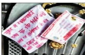
लगाए गए पोस्टर

CHAIBASA : जिले के जराईकेला ओपी क्षेत्र पंचपहिया में शनिवार की देर रात नक्सलियों ने पोस्टरबाजी की है। पोस्टरबाजी कर नक्सलियों ने लोगों से शहीदी सप्ताह मनाने की अपील की है। पोस्टरबाजी की सूचना मिलने पर रांची को सुबह पुलिस मौके पर पहुंचकर सभी पोस्टर को जल कर लिया। भाकपा नक्सलियों का शहीदी सप्ताह रांची से शुरू हो गया है। इसी को लेकर नक्सलियों ने अपनी मौजूदगी दिखाने की कोशिश की है। नक्सलियों ने पंचपहिया गांव के स्कूल से लेकर डोमलाई गांव और जराईकेला के विभिन्न जगहों पर भारी संख्या में पोस्टरबाजी की है। साथ ही नक्सलियों ने बुकलेट भी छोड़ा है। इसमें नक्सलियों ने आदिवासी भाषाओं का उपयोग करते हुए