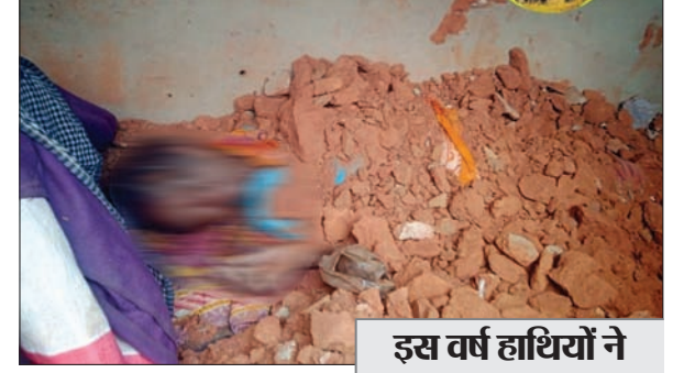
दिवार गिरने से दबी महिला