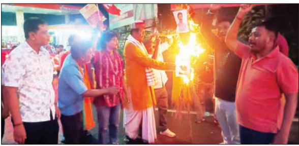
पुतला दहन करते भाजपा कार्यकर्ता