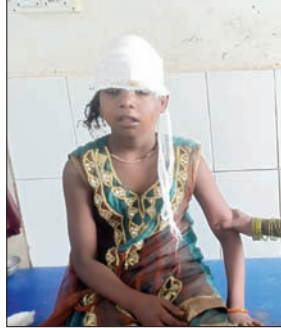
बच्ची का इलाज कराते परिजन