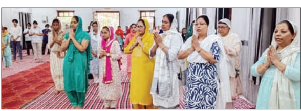
प्रार्थना करती महिलाएं