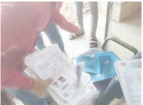
कूड़ेदान से निकले कागजात।

बिहार के नियोजित शिक्षकों की किस्मत जिस दस्तावेज के माध्यम से खुलने वाली थी और राज्यकर्मी का दर्जा मिलना था। वहीं दस्तावेज शिक्षा विभाग के शौचालय और कूड़ेदान के अंदर मिला है। जब विभाग को खबर मिली की 700 नियोजित शिक्षकों के सर्टिफिकेट गायब हैं तो सर्वेक्षण शुरू हुई। विभागीय खोजबीन शौचालय तक पहुंची तो सबके होश फाखा हो गए।