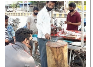
बेचने को लेकर मामला दर्ज किया गया है। इन दुकानदारों पर भारतीय न्याय संहिता की धारा 223, 290, 293 और फूड सेफ्टी एक्ट 2006 की 63 के तहत मामला दर्ज किया गया है।