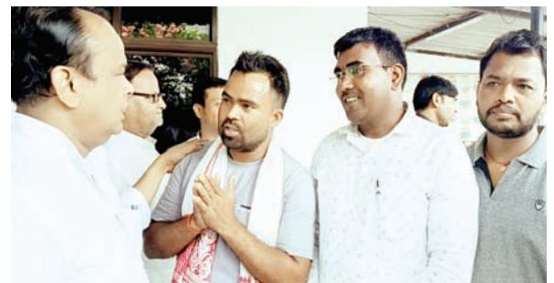
मंत्रि से बातचीत करते स्वयंसेवक।

राज्यभर की पंचायतों में सरकारी योजनाओं के क्रियान्वयन में सहयोग करने वाले पंचायत सचिवालय स्वयंसेवक अब आंदोलन के मूड में आ गए हैं। राज्य के सभी पंचायत सचिवालय स्वयंसेवक सोमवार 29 जुलाई 2024 से दो अगस्त तक झारखंड विधानसभा घेराव करेंगे।