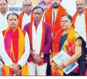
मंच पर मौजूद कई कार्यकारिणी के पदाधिकारी