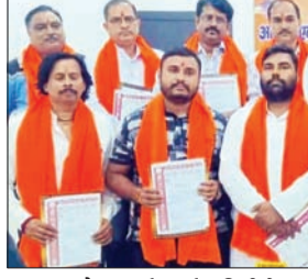
मंच पर मौजूद कई कार्यकारिणी के पदाधिकारी