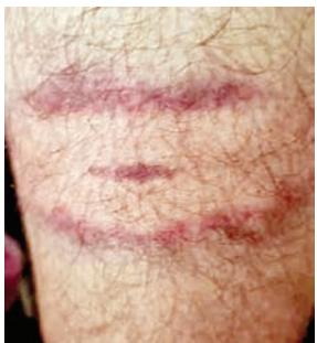
पुलिस की विट्डी से उमरा जख्म।

PHOTON NEWS RANCHI : पाकुड़ में पुलिस और छात्रों के बीच हिंसक झड़प को लेकर राष्ट्रीय एसटी-एससी ने आयोग ने संज्ञान लिया है। इसे लेकर आयोग ने रविवार को झारखंड के मुख्य सचिव, डीजीपी, पाकुड़ डीसी और एसपी को नोटिस भेजा है। भेजे नोटिस में कहा गया है कि समाचार पत्रों में प्रकाशित एक समाचार में लिखा गया है कि झारखंड में पुलिस के साथ झड़प में 11 आदिवासी छात्र घायल। आयोग ने इसके तहत प्रदत्त शक्तियों के अनुसरण में मामले की जांच करने का निर्णय लिया है। भारत के संविधान का अनुच्छेद 338अ। आपसे अनुरोध है कि उक्त आरोपों और मामलों पर की गई कार्रवाई के तथ्य और जानकारी इस नोटिस के माध्यम से प्रेषित की जाये।