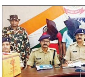
जानकारी देते पुलिस अधिकारी