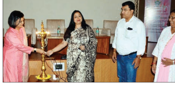
दीप प्रज्वलित करती अतिथि