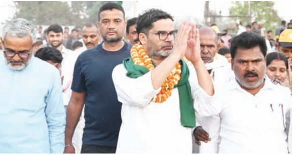
जनता का आशीर्वाद लेते प्रशांत किशोर।