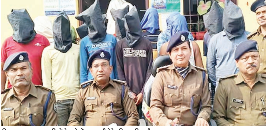
गिरफ्तार साइबर अपराधियों के बारे में जानकारी देते पुलिस अधिकारी।