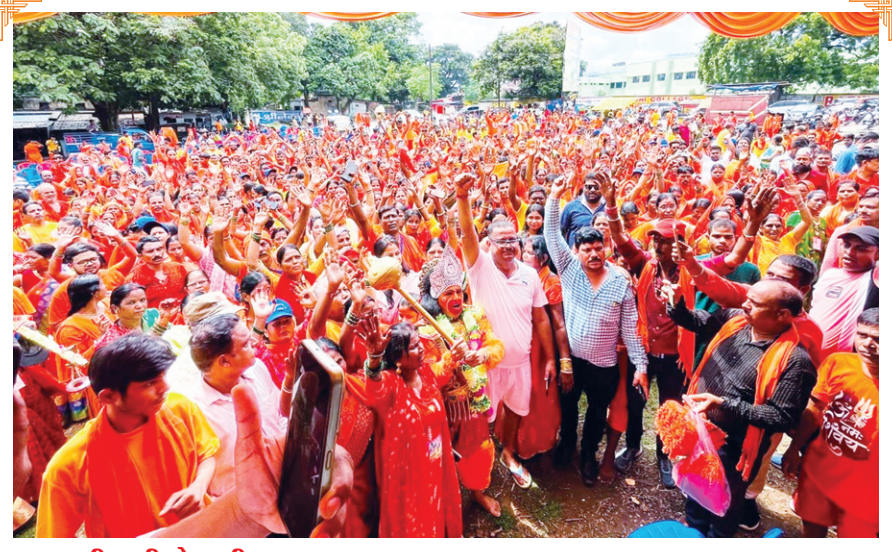
सवान की दूसरी सोमवारी आज : जमशेदपुर से देवघर के लिए रविवार को 1100 कांवरियों का जत्था रवाना हुआ। बाबा वैद्यनाथ सेवा संघ की ओर से लगातार छठे वर्ष आयोजित निष्कृत कांवर यात्रा की रवानगी के दौरान शहर के कई गणमान्य लोग शामिल हुए।

● हेमंत सोरेन का स्कीम प्रोजेक्ट अपनी सफलता की ओर ● नौ लाख किशोरियों को जोड़ने पर चल रहा काम समृद्धि योजना के तहत कुल 5 बार में 40 हजार तक आर्थिक सहायता सरकार की ओर से दी जाती है। यह सहायता वर्ग आठ से प्रारम्भ होकर उनके 12वें तक पहुंचने तक मिलती रहती है।