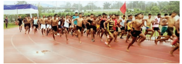
सेना भर्ती के लिए दौड़ लगाते अथर्वरथी।

तक के प्राप्ट आंकड़ों को देखें तो राजधानी के एक जून से अभी तक 350.3 एमएम बारिश हुई है। जबकि इस अवधि में 482.3 एमएम बारिश होनी चाहिए थी।