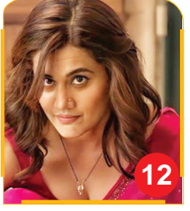
Taapsee Pannu Has The Cutest...