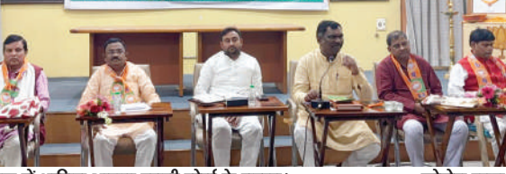
बैठक में शामिल भाजपा एससी मोर्चा के सदस्य

PHOTON NEWS RANCHI : भाजपा प्रदेश कार्यालय में अनुसूचित जाति मोर्चा के राष्ट्रीय महामंत्री सह झारखंड के प्रभारी भोला सिंह की अध्यक्षता में रविवार को भाजपा एससी मोर्चा एवं प्रबुद्ध जनों की बैठक का आयोजन किया गया। बैठक में भाजपा एस सी मोर्चा के राष्ट्रीय महामंत्री सह झारखंड के प्रभारी भोला सिंह ने आगामी विधानसभा चुनाव को लेकर कार्य योजना के बारे में प्रदेश पदाधिकारियों को संबोधित किया। उन्होंने सभी प्रदेश पदाधिकारियों से कहा कि झारखंड के सभी अनुसूचित जाति छात्रावास में जाकर छात्रों से मुलाकात कर उनकी सूची बनाने, प्रदेश के सभी सामान्य छात्रावास में भी एस सी छात्रावास में जाकर सभी विधानसभा क्षेत्र के छात्रों से जुड़कर उनकी समस्याओं से रूबरू होना और पार्टी के नीति सिद्धांत के बारे में उन्हें जानकारी देते हुए भाजपा के साथ जोड़ने का निर्देश दिया गया है। इसके साथ प्रदेश के सभी बस्ती में जाकर अनुसूचित जाति के लोगों से उनकी बातें सुनकर एवं उनकी समस्याओं से रूबरू होने के का निर्देश दिया गया है। प्रदेश पदाधिकारी को संबोधित करते हुए भाजपा एससी मोर्चा के राष्ट्रीय महामंत्री भोला सिंह ने सभी पदाधिकारियों को हर घर तिरंगा कार्यक्रम करने, मां के नाम से पेड़ लगाना, प्रदेश के सभी छात्रावास एवं कॉलेज में जाकर पौधरोपण करना, सभी प्रदेश पदाधिकारी को जिले में जाकर कर टोली बनाना शामिल है।