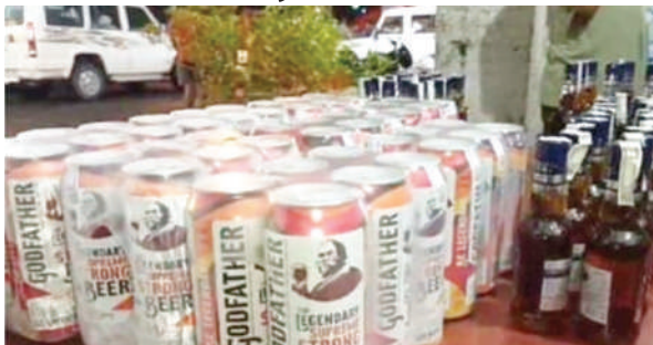
छापेमारी में बरामद शराब।