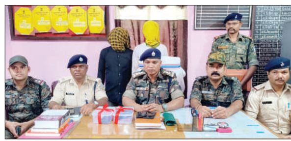
आरोपी के बारे में जानकारी देते पुलिस पदाधिकारी

हथियार का भय दिखाकर लगातार कर रहे थे लोगों से लूटपाट