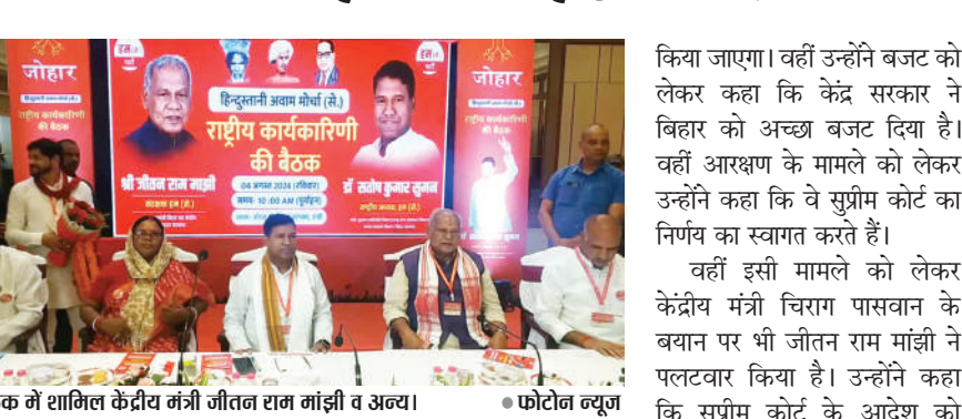
बैठक में शामिल केंद्रीय मंत्री जीतन राम मांझी व अन्य

ये वर्ग वोट करेगा तो पार्टी को काफी फायदा होगा। मजदूरों का निबंधन होना चाहिए और सरकार उन्हें अपनी व्यवस्था पर वोट डालने के लिए बुलाए। झारखंड में होने वाले आगामी विधानसभा चुनाव को लेकर हम पार्टी के मुख्य संरक्षक सह केंद्रीय मंत्री जीतन राम मांझी ने कहा कि हम पार्टी झारखंड और बिहार के चुनाव में उतरेगी। इसको लेकर झारखंड के लिए कुछ लोगों को जिम्मेदारी दी गई है। बिहार का उपचुनाव भी हम पार्टी लड़ेगी। आगे उन्होंने कहा कि लोकसभा चुनाव में हमें एक ही सीट मिली, इसके बावजूद उन्हें केंद्रीय मंत्रिमंडल में जगह दी गई। केंद्रीय सूक्ष्म-लघु और मध्यम उद्यम मंत्री जीतन राम मांझी ने कहा कि वे विभाग पीएम नरेंद्र मोदी ने मुझे दिया है। आज देश में लघु सूक्ष्म उद्योग की संख्या 6 करोड़ है। आगामी भविष्य में इसमें सुधार