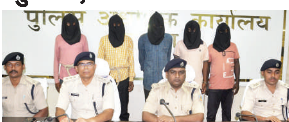
पुलिस गिरफ्त में बदमाश।

PHOTON NEWS DUMKA : मेसर्स शिव शंकर इंटरप्राइजेज कशर प्लांट में लूटपाट की घटना का उद्घेदन करते हुए दुमका पुलिस देशी कड़ा एवं लूटा मोबाइल समेत पांच अपराधियों को गिरफ्तार कर जेल भेजने में सफल रही। पुलिस ने इनके पास से एक देशी कड़ा, दो जिंदा कारतूस, घटना में प्रयुक्त तीन बाइक, मजदूरों के पास से लूटा गया चार मोबाइल एवं 27,550 रुपये नकदी बरामद किया है। मामले का उद्घेदन रविवार को