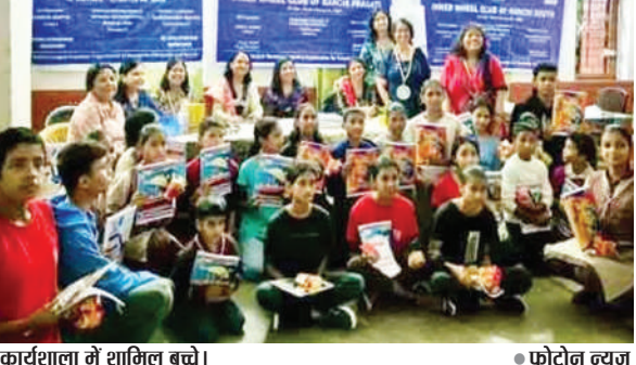
कार्यशाला में शामिल बच्चे