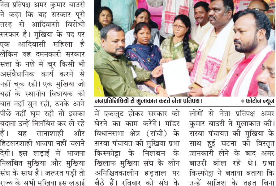
जनाप्रतिनिधियों से मुलाकात करते नेता प्रतिपक्ष