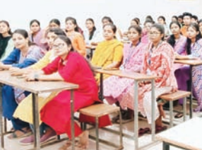
कार्यक्रम में मौजूद छात्र-छात्राएं।

संस्कृत सप्ताह के पहले दिन शुक्रवार को डा. श्यामा प्रसाद मुखर्जी विश्वविद्यालय के संस्कृत विभाग एवं संस्कृत भारती की ओर से भव्य शोभायात्रा निकाली गई। शोभायात्रा का उद्देश्य संस्कृत भाषा और भारतीय संस्कृति के प्रति जागरूकता फैलाना और युवाओं को इस प्राचीन भाषा के महत्व से अवगत करना था। शोभायात्रा में विभिन्न विश्वविद्यालयों एवं महाविद्यालय के संस्कृत विभाग के छात्र-छात्राओं, शिक्षकों, और संस्कृत प्रेमियों ने उत्साहपूर्वक भाग लिया। शोभायात्रा के दौरान वैदिक मंत्रों का उच्चारण, श्लोक पाठ और विभिन्न संस्कृत स्तोत्रों का गायन किया गया। इसके साथ ही विद्यार्थियों ने विभिन्न आयोजनों के माध्यम से संस्कृत भाषा और उसके