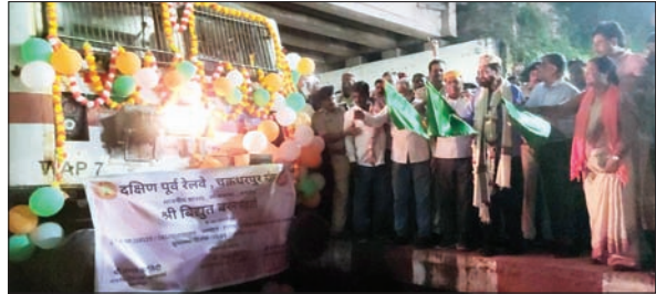
टाटानगर स्टेशन पर झंडी दिखाते सांसद व अन्य

JAMSHEDPUR : टाटानगर को बिहार के जयनगर से जोड़ने वाली ट्रेन नंबर 18119 टाटा-जयनगर एक्सप्रेस को शुक्रवार शाम जमशेदपुर सांसद बिबुत्त बरण महतो ने टाटानगर स्टेशन के प्लेटफार्म नंबर एक से शाम 6.50 बजे झंडी दिखाकर रवाना किया। इस दौरान इस ट्रेन से कुल 488 यात्रियों ने सफर की शुरुआत की, जिसमें स्लीपर क्लास से 395 यात्री, थर्ड एसी से 69 और सकेड एसी से 24 यात्रियों ने यात्रा की।