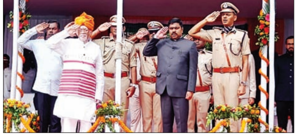
राष्ट्रध्वज को सलामी देते राज्यपाल संतोष गंगवार

स्वतंत्रता दिवस पर राज्यपाल संतोष गंगवार ने झारखंड की उप राजधानी दुमका में तिरंगा फहराया। राष्ट्र ध्वज को सलामी देने के बाद उन्होंने राज्यवासियों को संबोधित किया। उन्होंने कहा कि आज का दिन देशवासियों के लिए बहुत ही गर्व का दिन है। सदियों की गुलामी के बाद आज ही के दिन भारतवासियों ने ब्रिटिश दासता से मुक्ति पाई थी ' हमें यह आजादी कई महान सपूतों के बलिदान एवं त्याग से प्राप्त हुई है ' है। आजादी की इस लड़ाई में राष्ट्रपिता महात्मा गांधी, डॉ. राजेंद्र प्रसाद, पंडित यापन बेहतर हो सकेगी। मंत्री ने सरकार की उपलब्धियां बताईं।