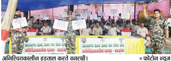
अनिश्चितकालीन हड़ताल करते वनरक्षी।

PHOTON NEWS RANCHI : शुक्रवार से झारखंड के वन विभाग के वनरक्षी अपनी मांगों को लेकर अनिश्चितकालीन हड़ताल पर चले गए हैं। बता दें कि झारखंड सरकार द्वारा 2014 की वनरक्षी नियुक्ति नियमावली में संशोधन करते हुए वनपाल पद को सौ प्रतिशत प्रमोशन से नियुक्ति की जगह पाचास प्रतिशत सीधी बहाली के लिए संशोधित किया गया है। इसके साथ