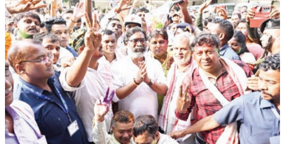
मुख्यमंत्री के साथ जश्न मनाते लोग।