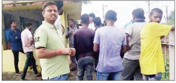
हंगामा करते स्थानीय लोग व मौके पर जुटी भीड़

चक्रधरपुर रेल मंडल में एक रेलकर्मि शराब पीकर ड्यूटी कर रहा था। मामला चक्रधरपुर रेल मंडल के भोया रेल फाटक का है। स्वतंत्रता दिवस के दिन इस फाटक पर जमकर बवाल हुआ। वह इसलिए कि रेल फाटक करीब ढाई घंटे तक बंद रहा और सड़क पर राहगीर परेशान रहे। दोनों तरफ वाहनों की लंबी कतार लग गई। जम कर राहगीरों ने रेल फाटक के गेटमैन से बात की तो वह गालीगलौज करने लगा। राहगीरों से बहस करने लगा। जब राहगीरों ने गेटमैन से कहा कि वह शराब पीकर ड्यूटी क्यों कर रहा है तो वह कहने लगा-हां पीकर ड्यूटी करता हूँ, तुम मेरा क्या कर लोगे। इसके बाद भी गेटमैन रुका नहीं, राहगीरों को धमकी देता रहा। इसके बाद लोगों ने इसकी जानकारी चक्रधरपुर रेल मंडल के डीआरएम से लेकर सीनियर