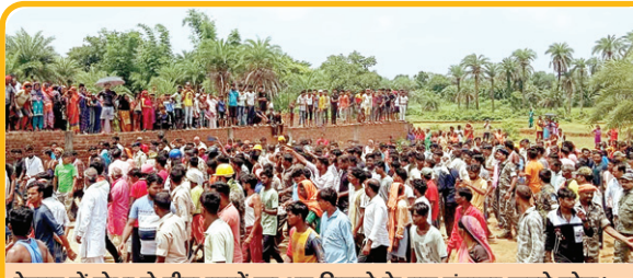
देवघर में डीमा से तीन बच्चों का शव मिलाने के बाद हंगामा करते लोग।

RANCHI : कोलकाता के आरजी कर मेडिकल कॉलेज में ट्रेनी डॉक्टर रेप-हत्या के विरोध में जूनियर डॉक्टरों का देशव्यापी आंदोलन चल रहा है। रांची के रिम्स के जूनियर डॉक्टरों भी हड़ताल पर हैं। जूनियर डॉक्टरों एसोसिएशन (जेडीए) ने शुक्रवार को भी पेन डाउन मूवमेंट जारी रखने का फैसला किया है।