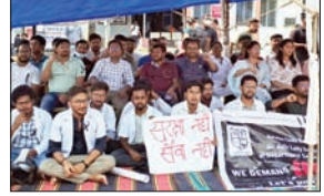
JAMSHEDPUR : कोलकाता में जूनियर डॉक्टर के साथ दरिंदगी की घटना के बाद पूरे देश के डॉक्टर हड़ताल पर हैं। जमशेदपुर में भी हड़ताल का असर देखने को मिला। महात्मा गांधी मेमोरियल (एमजीएम) मेडिकल कॉलेज के ओपीडी को जूनियर डॉक्टरों ने शुक्रवार सुबह बंद करा दिया। इससे अस्पताल पहुंचे मरीजों को काफी परेशानी हुई। डॉक्टर अस्पताल परिसर में धरने पर बैठ सुरक्षा की मांग करते हुए नारेबाजी करने लगे। इस बीच ओपीडी रजिस्ट्रेशन काउंटर खोला गया पर जूनियर डॉक्टरों ने इसका विरोध करते हुए जबरन रजिस्ट्रेशन काउंटर को बंद करवा दिया। हालांकि मरीजों ने इमरजेंसी काउंटर में पंजी कटवाकर अपना इलाज कराया, जबकि कई लोग बिना इलाज के चले गए। शनिवार को शहर में सौनियर डॉक्टरों की भी हड़ताल रहेगी।