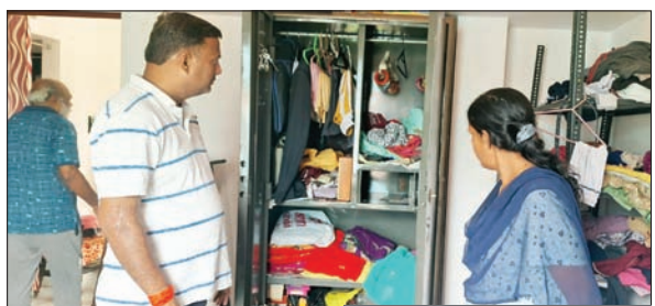
घर में सुली अलमारी दिखाती महिला