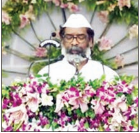
कार्यक्रम को संबोधित करते सीएम

मुख्यमंत्री हेमंत सोरेन ने रांची के मोरहाबादी मैदान में झंडोलाल किया। इस दौरान समारोह स्थल पर सुरक्षा के पुख्ता इंतजाम थे। कार्यक्रम में आने वाले लोगों पर पैना नजर रखी जा रही थी। सघन जांच के बाद ही लोगों को प्रवेश दिया गया। सीएम हेमंत ने सबसे पहले सभा को संबोधित करते हुए झारखंड के वीर सपूतों के साथ साथ स्वतंत्रता संग्राम में हिस्सा लेने वाले सेनानियों को याद करते हुए उन्हें नमन किया। इस दौरान उन्होंने सरकारी नौकरी को लेकर घोषणाएं की हैं। उन्होंने कहा कि झारखंड कर्मचारी चयन आयोग ने नियुक्ति की प्रक्रिया शुरू कर दी