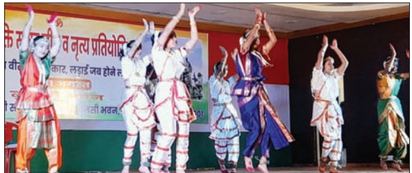
बिष्टपुर स्थित तुलसी भवन में नृत्य करती छात्राएं ● फोटोन न्यूज

JAMSHEDPUR : सिंहभूम जिला हिंदी साहित्य सम्मेलन व तुलसी भवन की ओर से तुलसी जयंती समारोह के तहत देशभक्ति गीत एवं नृत्य प्रतियोगिता हुई। समूह नृत्य के विजेता : प्रथम : सेंट जेवियर्स इंग्लिश हाई स्कूल (खासमहल), द्वितीय : विद्या भारती चिन्मया (टेलको), तृतीय : डीएवी बिष्टपुर, तृतीय : डीएवी पब्लिक स्कूल (एनआईटी आदित्यपुर), प्रोत्साहन : डीवीएमएस इंग्लिश स्कूल (कदमा), डीएवी पब्लिक स्कूल, (एनआईटी आदित्यपुर), प्रोत्साहन