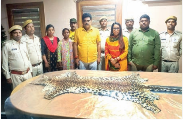
तेंदुए की खाल के साथ वन विभाग के अधिकारी व कर्मचारी